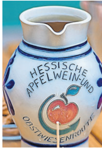
Die Teilnehmer erwarten tolle Insider-Tipps.

Bei dem etwa zweistündigen Spaziergang unter dem Motto „Bad Nauheim mit Geschmack“ geht es durch die Innenstadt, vorbei an eindrucksvollen Sehenswürdigkeiten. Die Gäste erhalten spannende Insider-Tipps und an drei verschiedenen Orten werden süße, herzhaft und klassisch hessische Leckereien gereicht. Die erste Tour startet am Montag, 25. April um 17.00 Uhr an der Tourist Information der Bad Nauheim Stadtmarketing