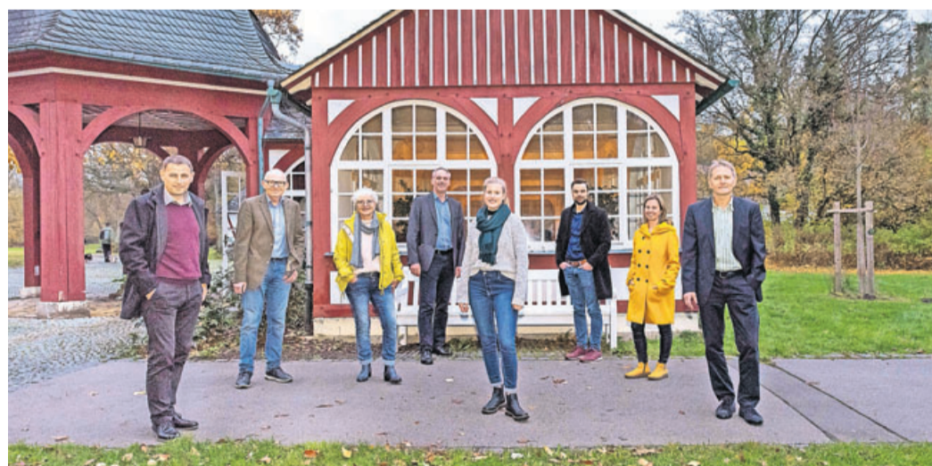
Wirtschaftsförderung Wetterau, Landkreis und Verein Oberhessen laden zur ersten Präsentation der neuen lokalen Entwicklungsstrategie ein.

Friedberg. Wir möchten wieder Leader-Region werden! – Das hat der breite Beteiligungsprozess im Rahmen der Erarbeitung der Lokalen Entwicklungsstrategie (LES) in den letzten Monaten deutlich gezeigt. Die neue Leader-Förderperiode von 2023 bis 2027 steht kurz bevor und so auch die Bewerbung unserer Region, wieder als Leader-Region nachhaltige Entwicklung im ländlichen Raum zu fördern. Die Lokale Entwicklungsstrategie (LES) für unsere Leader-Region, welche die Grundlage der Bewerbung darstellt, hat viele Bürger bewegt. Seit November vergangenen Jahres war die Bevölkerung aufgerufen, Ihre Ideen, Projekte und Visionen für unsere Region Wetterau/Oberhessen mitzuteilen. In den fünf Bürgerdialogen war dies genauso möglich, wie bei den vier Handlungsfeld-Workshops und online über eine Beteiligungsplattform. Die Beteiligung war nicht nur zahlreich, sondern auch sehr ideenreich und hat