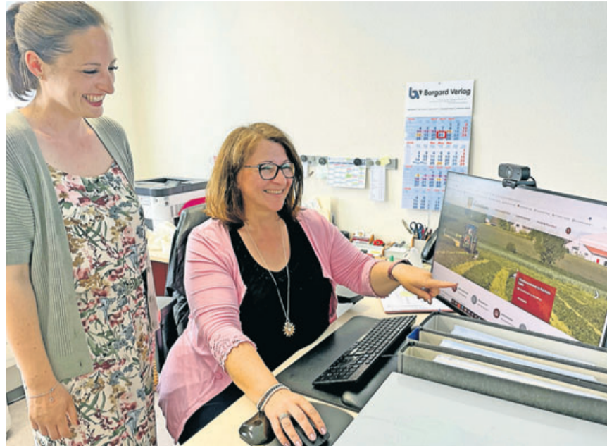
Die neue Website soll die Mitarbeiter im Rathaus entlasten.

terminen, Tagesordnungen und Erreichbarkeiten, bietet der neue Internetauftritt insbesondere im Bereich Leben und Wohnen umfangreiche Möglichkeiten. „Zu den unterschiedlichsten Lebenssituationen gibt es passende Informationen, wie beispielsweise zu Kitas, Grundschule oder Hei-