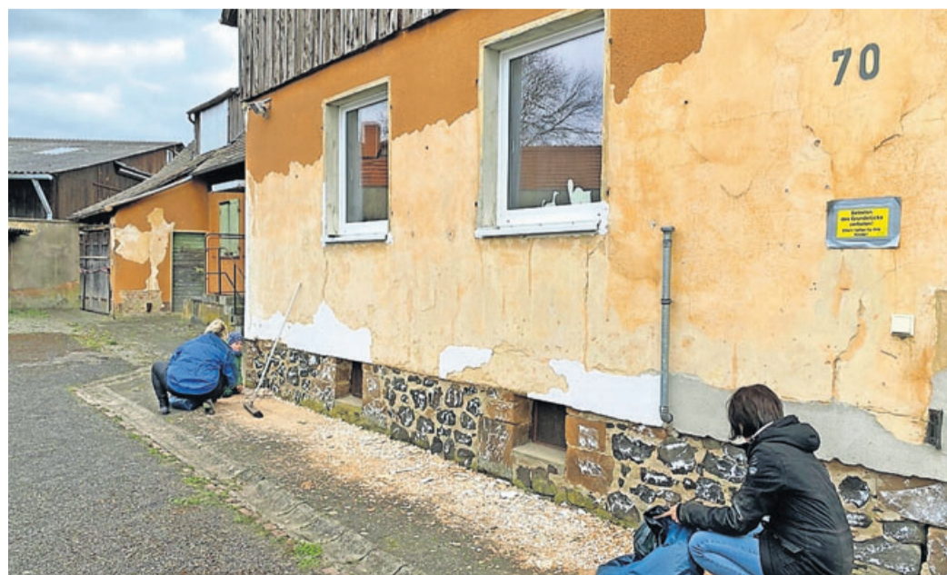
Die Außenfassade des Vereinsheims ist dringend herzurichten.

Der Konferenzraum im Vereinsheim des „Nebenan“ wurde vor kurzem fertig und so stand fest, dass in den Osterferien unkompliziert begonnen werden könnte. Beim ersten Treffen und Kennenlernen der