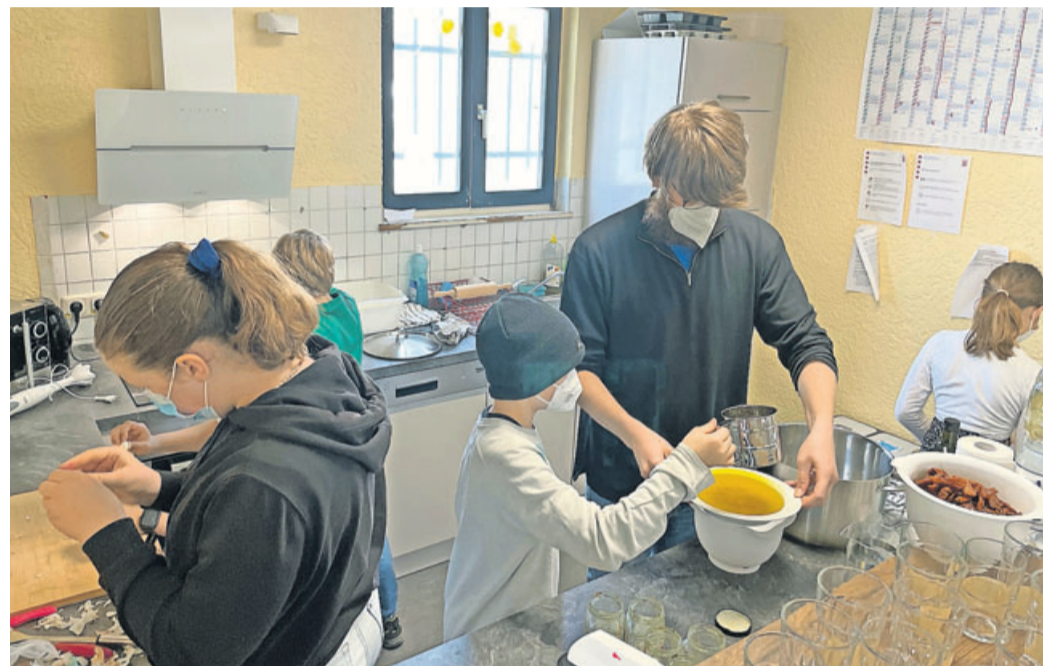
Bei einem gemeinsamen Kochkurs, wurde ein Drei-Gänge-Menü zubereitet.

Jugendarbeit präsentierte vielseitiges Programm in den Ferien