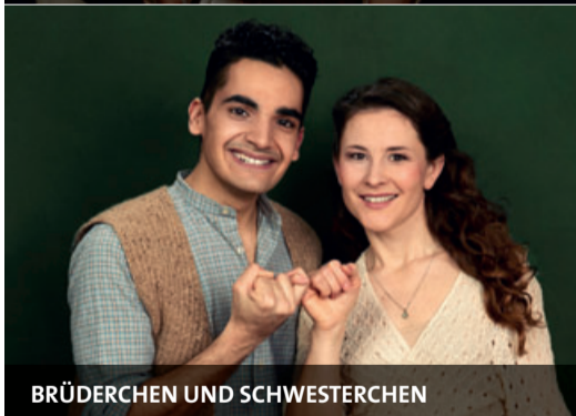
BRÜDERCHEN UND SCHWESTERCHEN