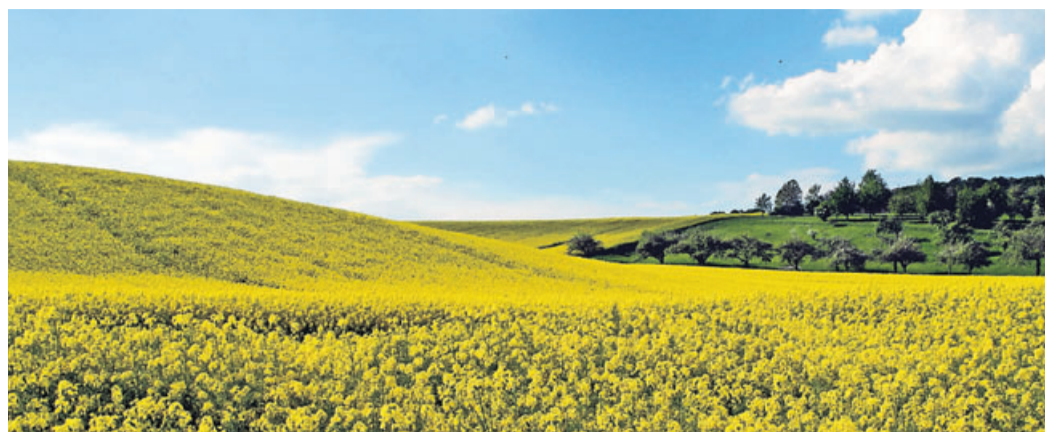
Grün und gelb in betörender Intensität, die Wetterau ist im Frühjahr besonders schön.

Fotografiert werden soll alles, was typisch für die Region ist: Das Landleben und die Natur, die bunte Kulturlandschaft, mittelalterliche Stadtbilder, aber auch das urbane Leben und moderne Arbeitsplätze.