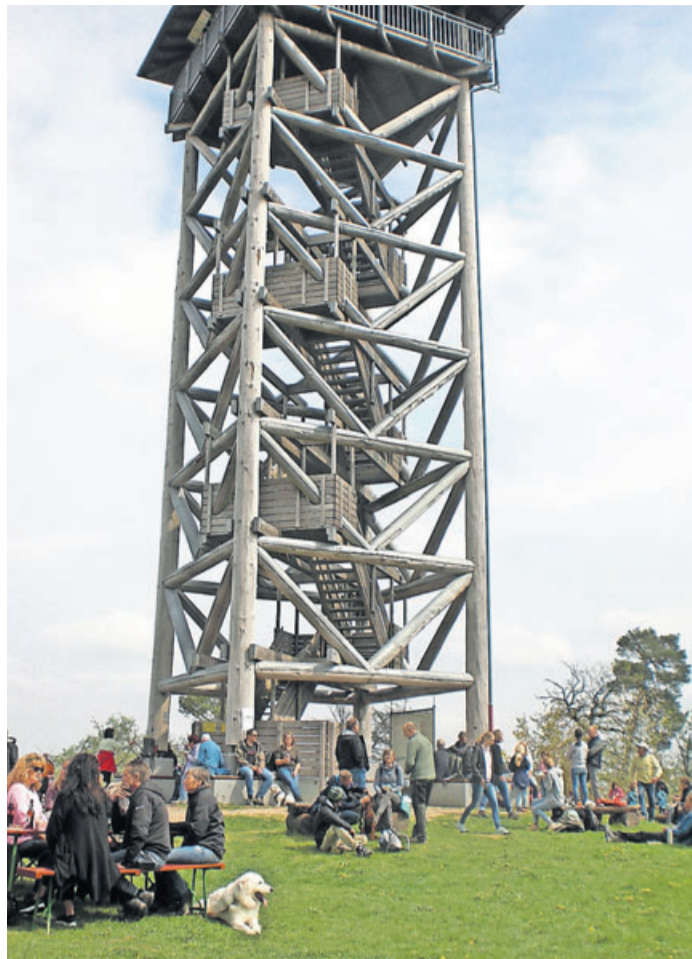
Der 23,25 Meter hohe Hausbergturm auf dem Gipfel des 486 Meter hohen Hausbergs war das Ziel der vielen Wanderer und Ausflügler.

Butzbach (js). Der Hausberg-turm in der Nähe des Butzbacher Stadtteils Hoch-Weisel ist inzwischen weithin bekannt als lohnendes Ziel für Wanderer und Ausflügler. Aber nur wenige wissen, dass bereits am 25. Mai 1873 der 1. Hausberg-turm mit einer Höhe von 10 m eingeweiht wurde. 1875 stürzten orkanartige Stürme diesen Turm um. Ein Jahr später wurden die beschädigten Teile ausgebessert und der Turm wieder errichtet. Ab da fand alljährlich zu Himmelfahrt auf dem Hausberg ein Fest statt. 1941 musste der Turm wegen Baufälligkeit abgerissen werden. Auch ohne Aussichtsturm wurden danach am 1. Mai Hausbergfeste abgehalten, die jedoch mit der Errichtung der Radarstation der US-Army ausgesetzt werden mussten. Als 2005 der Wintersteinturm errichtet wurde, ergriff der spätere 1. Vorsitzende Manfred Imbescheid die Initiative, erkundigte sich bei Behörden und suchte Verbündete in der Gemeinde.