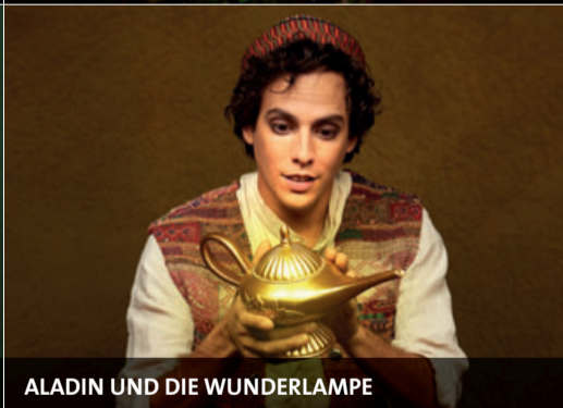
ALADIN UND DIE WUNDERLAMPE