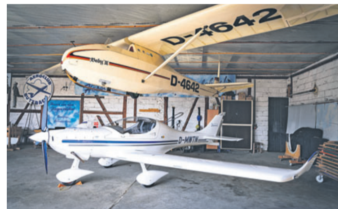
Das neue Flugzeug vom Typ Dynamic WT9.

Butzbach. Die neue Flugsaison beim Aero-Club Butzbach startet in diesem Jahr mit einem neuen Fluggerät: Nach dem Verkauf eines Motorseglers im vergangenen Jahr beschlossen die Mitglieder den Kauf eines neuen Ultraleichtflugzeugs vom Typ Dynamic WT9.