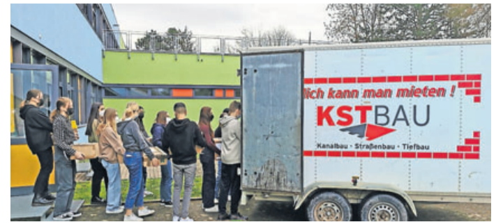
Die Klasse 9 G1 hilft beim Verladen der Pakete.

Friedberg. „Statt nur traurig zu sein, müssen wir etwas tun!“ meinte ein Schüler einer 8. Klasse der Henry-Benrath-Schule in Friedberg. So ist eine Idee entstanden, zur Tat überzugehen und eine Sachspendenaktion an der Schule zu organisieren. Nach den Hilfsprojekten, die die Schule in der Vergangenheit in Zusammenarbeit mit der Organisation „StayWithMoria“ sehr erfolgreich durchgeführt hat, konnte aktuell eine erfolgreiche Hilfsaktion für die Ukraine gestartet werden. Die SchülerInnen der Schule erstellten auch diesmal wieder Hygiene- und Lebensmittelpakete, die in den Pausen in der Schule im Sammelraum abgegeben werden konnten. Auch war es möglich einzelne Produkte abzugeben, die dann von fleißigen Schülern der Jahrgänge 8., 9. und 10. während der Pausen oder nach dem Unterricht sortiert und in neue Pakete umgepackt wurden.