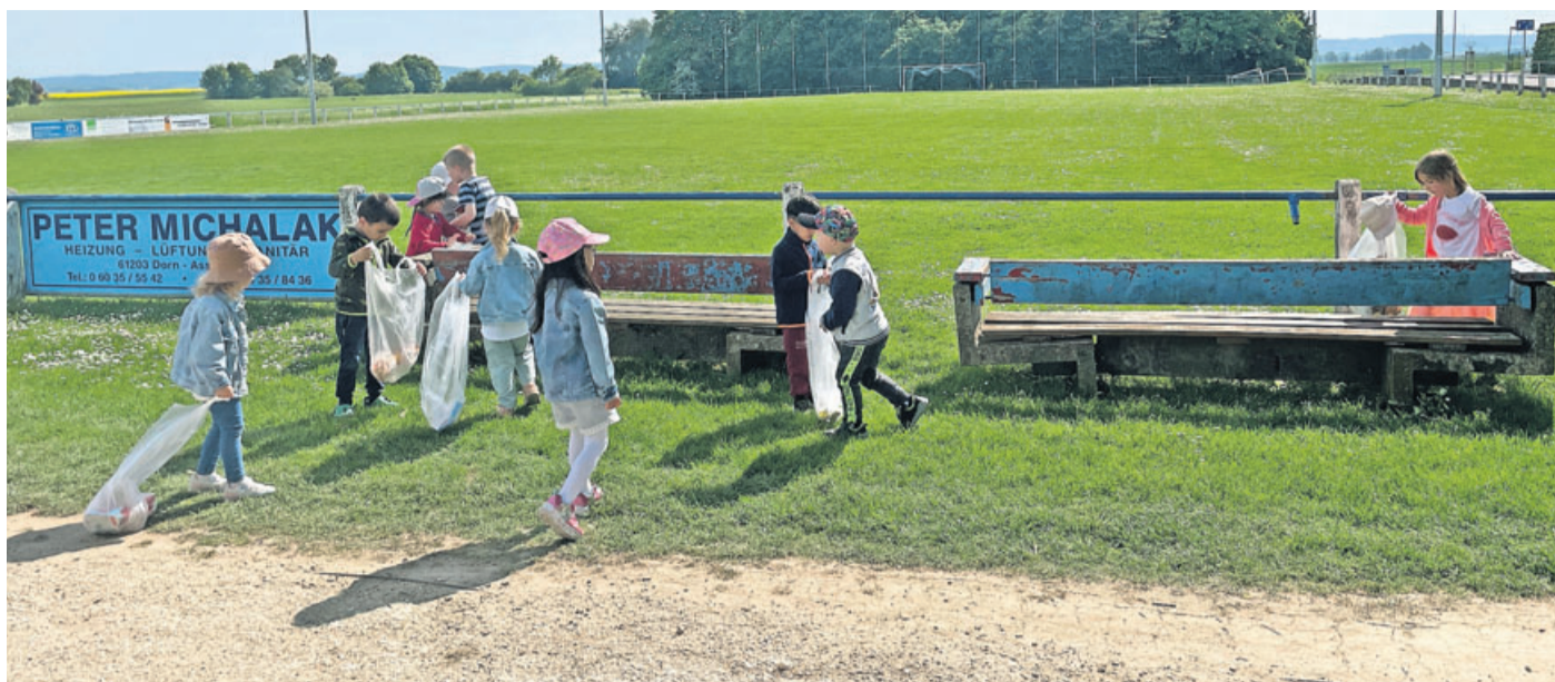
Die Kinder sammeln fleißig Müll am Sportplatz ein.

Reichelsheim. Gemeinsam mit den Kindern aus den städtischen Kindertagesstätten Wichtelwiese in Dorn-Assenheim und Steinbeißer in der Kernstadt machte sich Reichelsheims Bürgermeisterin Lena Herget-Umsonst auf den Weg, um Müll zu sammeln. „Man kann nicht früh genug anfangen, unseren Kindern einen verantwortungsvollen Umgang mit Umwelt und Natur zu vermitteln.“