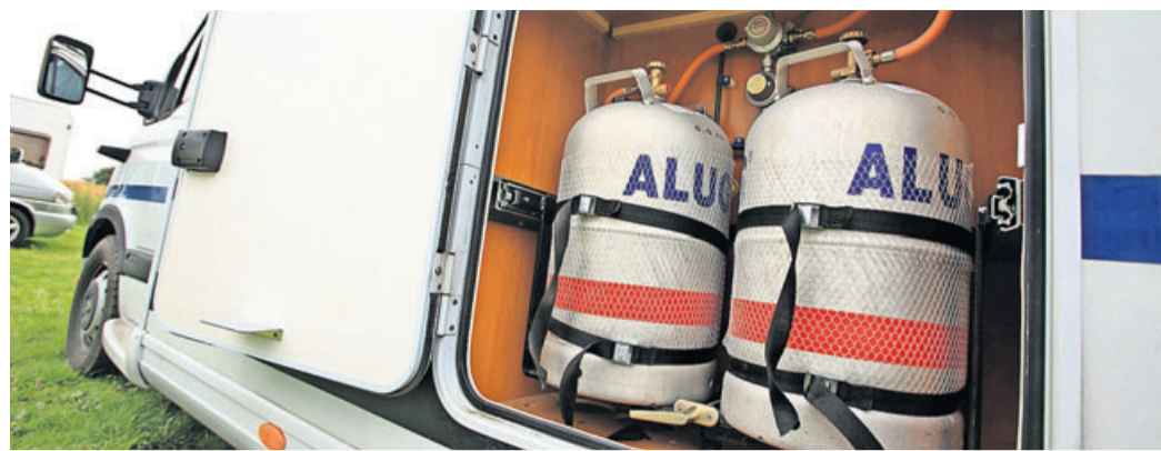
Kochen, Heizen und auch Kühlen: Flüssiggas im Wohnmobil sorgt für Komfort und Unabhängigkeit - doch die Anlage muss sicher sein.

Ein Tipp: Die Dichtheit der Schläuche lasse sich mit Hausmitteln prüfen, so Hermann Dinkler, der sich beim TÜV-Verband mit Brand- und Explosionsschutz beschäftigt. Es braucht demnach nur Wasser