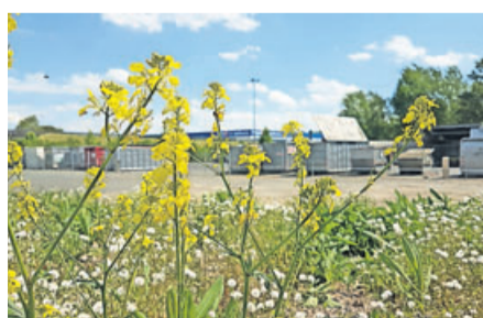
Die Blumenwiese des Recyclinghofs Friedberg-Dorheim ist ein Paradies für Bienen.

Recyclinghof Friedberg Dorheim leistet Beitrag zum Tag der Bienen