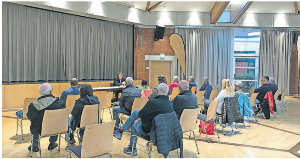
Rund 20 Bürger kamen zu der Veranstaltung.

Darüber hinaus bot sich den Besucherinnen und Besu-