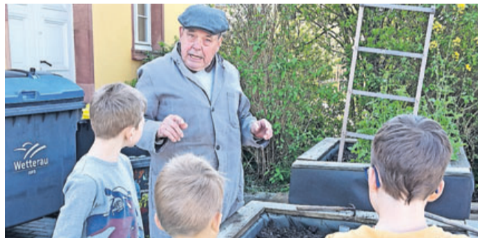
Mit fachlicher Unterstützung des OGV Rodheim wurden die Hochbeete der Kita bepflanzt.

Rodheimer Kindertagesstätte „Alte Schule“