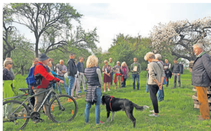
Am Ende des Spaziergangs erwartete die Teilnehmer ein kulinarischer Abschluss.

anschauliche Informationen. Über die Nutzung der Streuobstwiese im bäuerlichen Betrieb informierte an der zweiten Station AK-Mitglied Micha-