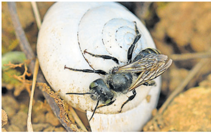
Die Zweifarbig-Schneckenhaus-Mauerbiene ist eine der ersten zu beobachtenden Wildbienen im Jahr. Die ersten Männchen erscheinen bereits ab Anfang März. Die Weibchen nutzen zur Eiablage ausschließlich verlassene Schneckenhäuser.

Jedes Wildbienen-Weibchen kümmert sich selbst um seine Nachkommen. Dafür legt sie Brutzellen in