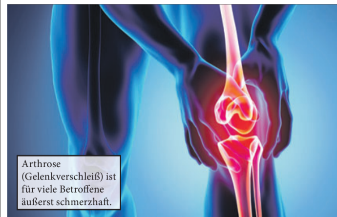
Arthrose (Gelenkverschleiß) ist für viele Betroffene äußerst schmerzhaft.