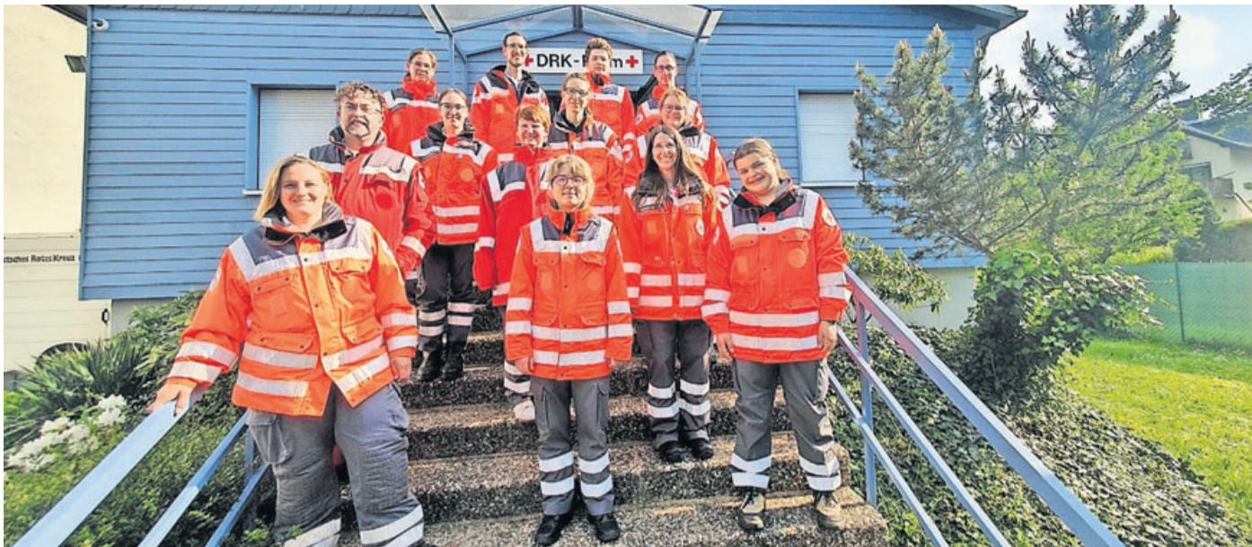
Die Teilnehmer der Helfergrundausbildung Sanitätsdienst.