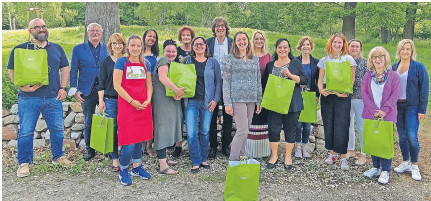
Haben an den Seminaren erfolgreich teilgenommen: die Erzieherinnen aus den Kitas der Stadt Bad Nauheim.

Zwölf Bad Nauheimer Kitas erneuern ihr KIKS UP-Genuss Zertifikat