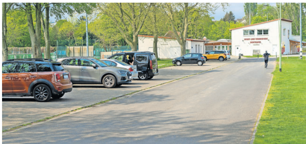
Hier herrscht Parkplatznot: der Dortelweiler Sportplatz.

CDU und SPD wollen Parkplatzsituation verbessern