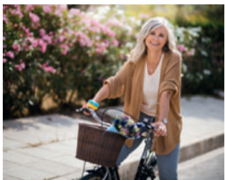
Bewegung macht nicht nur Spaß, sie stärkt auch die Knochen.

Circa 6,3 Millionen Menschen – zu meist Frauen, aber auch rund 1,1 Millionen Männer – sind von Osteoporose betroffen 1 . Die Erkrankung wird oft erst erkannt, wenn es aus einem geringfügigen Anlass zu einem Knochenbruch kommt. Ist die Diagnose gestellt, wird nur jeder Fünfte angemessen behandelt 1 . Eine aktive Lebensweise und eine kalziumreiche Ernährung tragen zudem sowohl dazu bei, einer Osteoporose vorzubeugen als auch eine Behandlung der Erkrankung zu unterstützen.