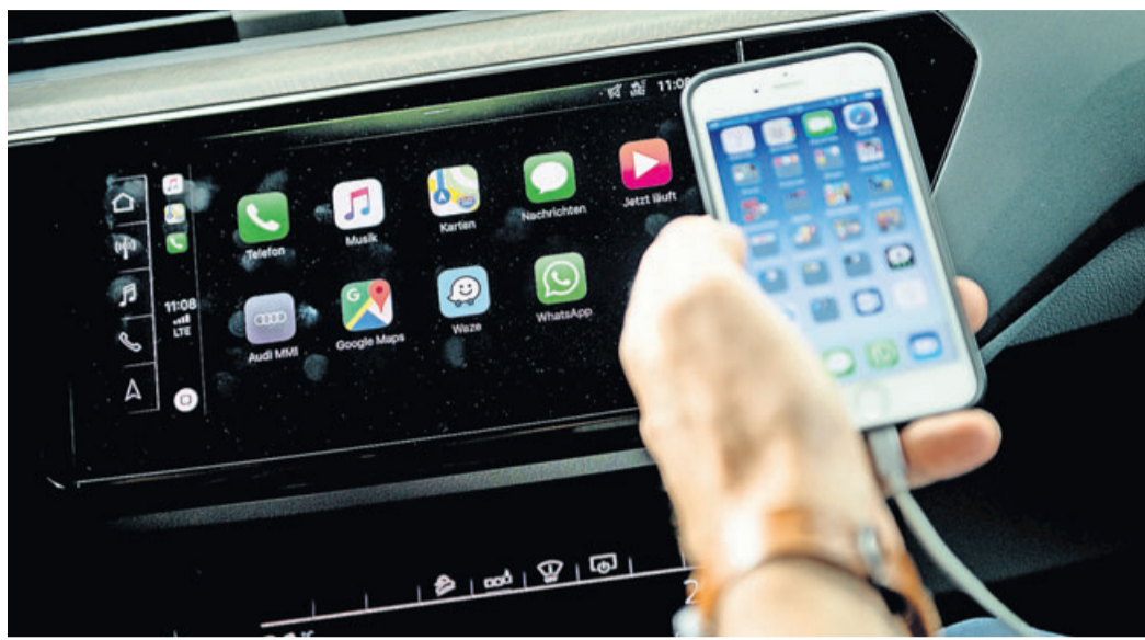
Voll vernetzt: Viele Funktionen in modernen Autos laufen über Apps – und brauchen dafür häufig auch persönliche Daten.

Da kaum ein Hersteller dafür eine Löschroutine anbietet, gehe das oft nur „in nerviger