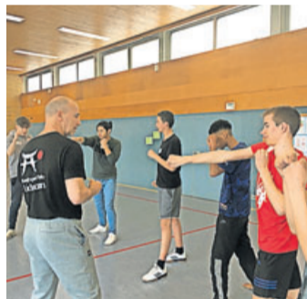
Auch die Selbstverteidigung spielte eine Rolle.