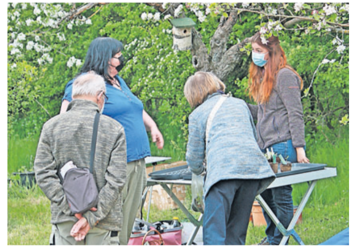
Das Angebot war groß, die Auswahl fiel daher nicht leicht.

Breites Angebot an Pflanzen Nabu Friedberg