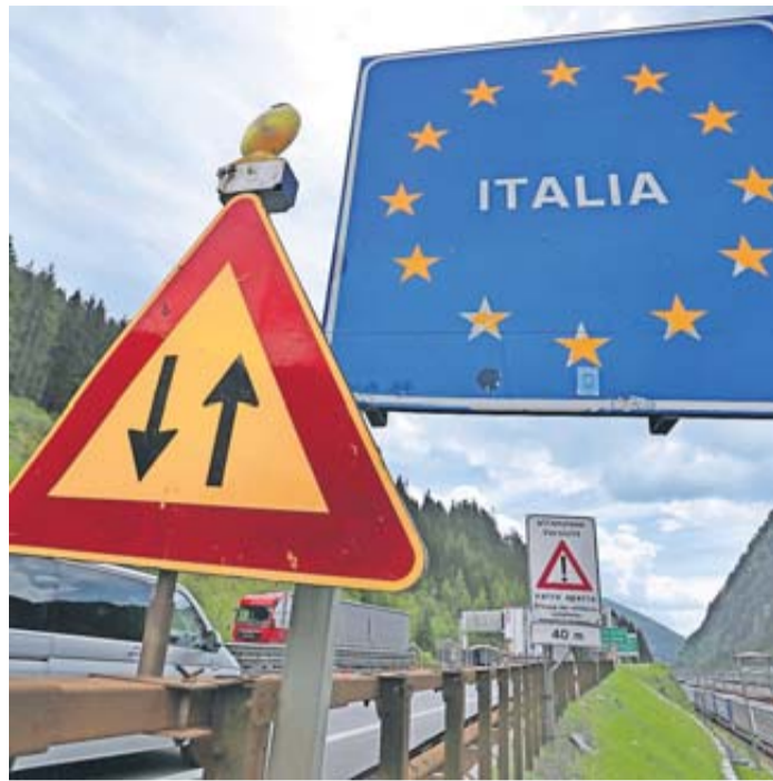
Ob Italien oder Spanien: Jedes EU-Land hat seine eigenen Verkehrsregeln - und die sind teilweise recht kurios.

In Schweden gibt es etwa in Stockholm und Göteborg eine City-Maut. Sie wird automatisch erhoben, sobald man die Kontrollstation passiert. Die Rechnung kommt per Post. Im historischen Zentrum einiger italienischer Städte wie Florenz oder Rom gibt es Ein- und Durchfahrtsverbote zu bestimmten Zeiten, die per Video überwacht werden. Wessen Hotel in solch einer Zone liegt, der kann bei rechtzeitiger Nachfrage aber eine Zufahrtsgenehmigung erhalten. Wer im Ausland ein Tempoli-