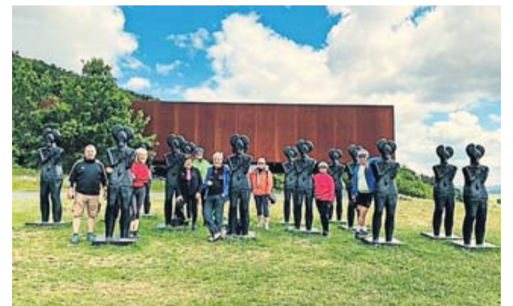
Die elf Radfahrer vor dem Keltenmuseum.

und sich über die Welt der alten Kultur informieren. Über die Strecke Lindheim und Altstadt wurde der Ortsteil Höchst erreicht. Von hier aus ging es in die kleine Bergwertung zum Kloster Engelthal hinauf. Über Wald- und Wiesenwege fuhr die Gruppe dann über Bönstadt und dem Niddaradweg zurück nach Rosbach. Nach rund 71 Kilometern und etwa 600 Höhenmetern ging ein erlebnisreicher Tag zu Ende.