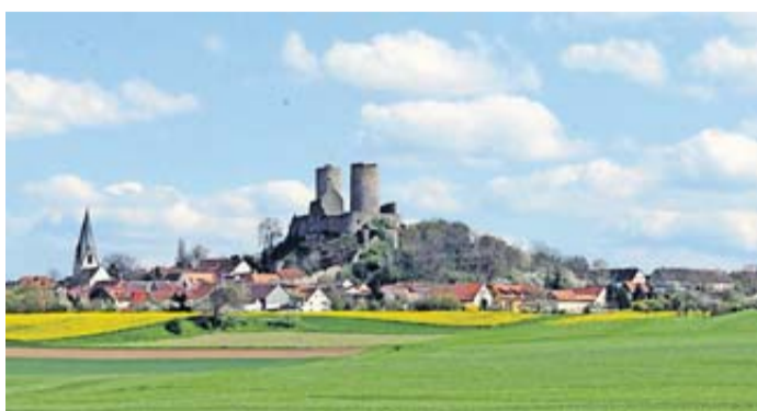
Die Burg Münzenberg.

Wetteraukreis. Am 1. August 1972 wurden die beiden Kreise Friedberg und Büdingen zum Wetteraukreis vereinigt. Eine Geburtstagsfeier zum 50. Geburtstag soll auf einem der Wahrzeichen des Wetteraukreises, der Burg Münzenberg, stattfinden.