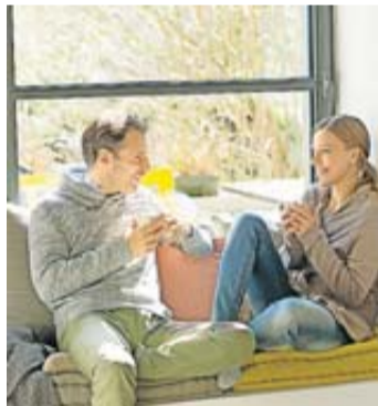
Nur die Ruhe! Ein Immobilienkauf will wohlüberlegt sein.

Um beim Kauf der Traumimmobilie möglichst wenig Kompromisse eingehen zu müssen, sollten Kaufinteressenten zuerst ihren Bedarf kritisch hinterfragen: In welcher Lage wollen wir wohnen? Wie viele Zimmer brauchen wir jetzt und zukünftig? Wie viel Platz benötigen wir mindestens und höchstens? Das hilft Käufern, bereits beim Sichten von Anzeigen, den Fokus auf das Wesentliche zu legen. Viele Angebote fallen dann schon durch das Raster. Ebenso wichtig ist eine solide Finanzierung: Wie viel Eigenkapital ist vorhanden? Wie viel Kredit ist erforderlich? Wichtig ist außerdem, mindestens zehn