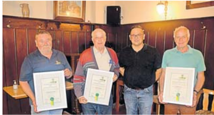
Die Geehrten erhielten je eine Urkunde zur Ernennung zum Ehrenvorsitzenden sowie ein Kuvert.