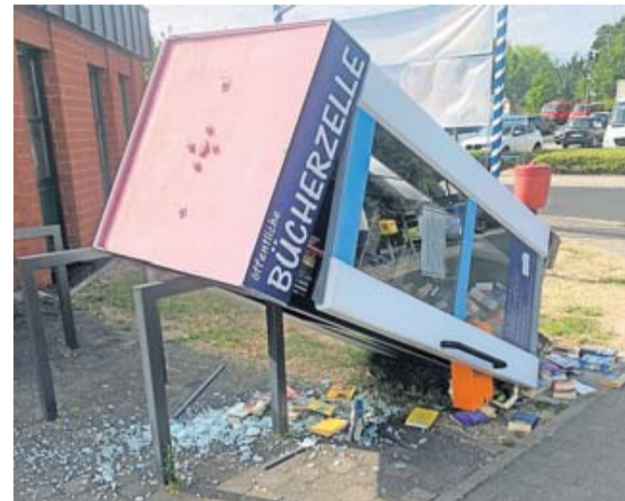
Die Zelle wurde aus der Bodenverankerung gerissen und umgeworfen.