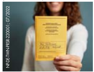
NABU-Flyer zum Welt-Hepatitis-Tag 2022

ein Hepatitis-Check durchgeführt und der Impfstatus überprüft werden. Denn gegen Hepatitis A und B gibt es seit Jahrzehnten gut verträgliche und wirksame Impfstoffe. Ist eine Auslandsreise geplant, können die Impfungen oftmals als Reiseimpfung durchgeführt und von der Krankenkasse erstattet werden. Zusätzlich können bei dem Termin auch die Standardimpfungen Covid-Booster, Tetanus, Diphtherie, Pertussis, Influenza sowie Gürtelrose und Pneumokokken bei den über 60-Jährigen aufgefrischt werden. Eine Arztbesuche findet man unter bereit-zu-reisen.de . (GlaxoSmithKline)