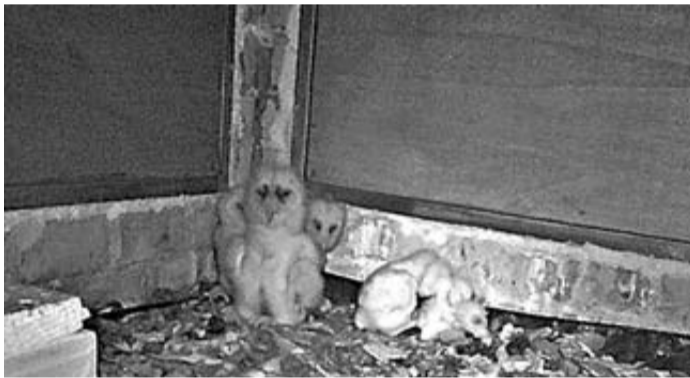
Junge Schleiereulen warten auf Nahrung.

Erneut sind junge Schleiereulen in die Niststätte eingezogen