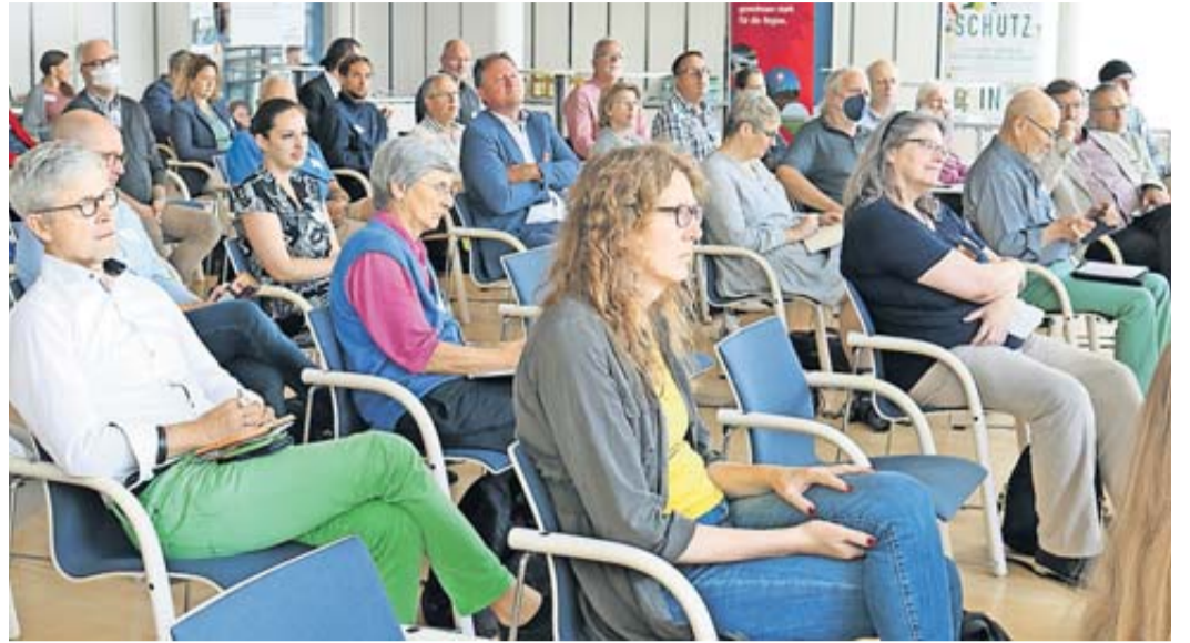
Engagierte Akteurinnen und Akteure zusammenbringen – das war das Ziel der Wetterauer Klimaschutzkonferenz.

Umso wichtiger sei es, für das Thema zu sensibilisieren und aufzuzeigen: Was sind die Themen und Maßnahmen, mit denen vor Ort wirklich etwas bewegt werden kann? Wo und