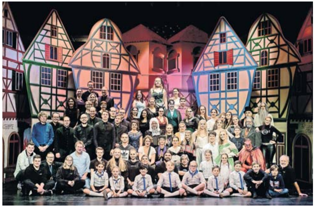
Die Theatergruppe Assenheim, hier bei ihrer Inszenierung von „Faust“ 2019 im Dolce Jugendstil-Theater, erhält den Kulturpreis 2022.

Die Theatergruppe Assenheim bereichert seit über 40 Jahren das kulturelle Leben in der Wetterau und das auf ganz unterschiedliche Weise. Gegründet wurde die Gruppe von theaterbegeisterten Menschen, die Stücke für Kinder angeboten haben. Schnell entwickelte sich der Verein zu einer immer professioneller agierenden Amateurbühne, die sich in den verschiedenen Sparten des Theaters – Schauspiel, Musik, Gesang, Tanz und Musical – perfektionierte. Bühnenstücke wurden kreiert und aufgeführt und darüber hinaus Menschen unterschiedlichen Alters, Geschlechts und Herkunft motiviert, selbst zu Theatermachern zu werden. Das erste Stück, das die Theatergruppe Assenheim auf die Bühne brachte, war der Räuber Hotzenplotz von Otfried Preußler. Mittlerweile werden Jahr für Jahr zwei Bühnenstücke