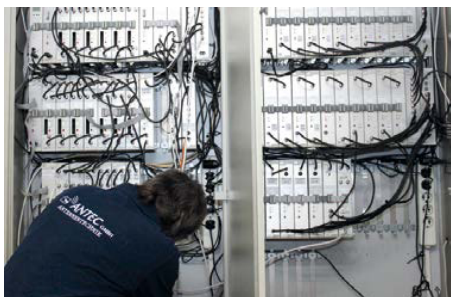
Aufbereitungssysteme für Breitbandsignale sind maßgeblich für höhere Bandbreiten im Netz.

Unser technischer Kundendienst ist für den Aufbau, Betrieb und Service von Breitbandanlagen zuständig. Unser Angebot umfasst zudem die komplette Peripherie – Elektrotechnik, Videoüberwachung, Sicherheitssysteme und Satellitenkommunikation. Eine Stärke unseres Unternehmens ist die Nachvollziehbarkeit des Kundennutzens. Wir agieren nicht schematisch, sondern mit großer Flexibilität und immer nach Bedarf. Dabei sind wir nicht auf eine Technik festgelegt. Eines unserer Projekte dient zum Beispiel der verbesserten Sicherheit einer Wohnsiedlung in Wiesbaden durch Videoüberwachung und Videoaustausch mit Hausmeister und Sicherheitsfirmen. Über Breitbandtechnologie wird eine digitale Verbindung geschaffen. Die Wohnsiedlung ist so viel sicherer und attraktiver für Familien geworden.