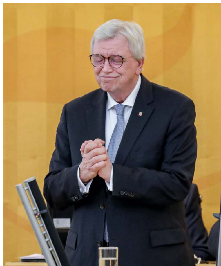
Volker Bouffier trat nach zwölf Jahren als hessischer Ministerpräsident zurück. Vor seiner Zeit als Regierungschef war er fast elfeinhalb Jahre Innenminister. Insgesamt war der frühere Basketballer und Jurist fünf Jahrzehnte in der Politik, davon 40 Jahre in verschiedenen Ämtern.

Diese Erfolgsgeschichte wollen wir nun gemeinsam mit Boris Rhein fortzuschreiben, damit Hessen auch in den kommenden Jahrzehnten ein erfolgreiches Land mit Vorbildcharakter bleibt. ■