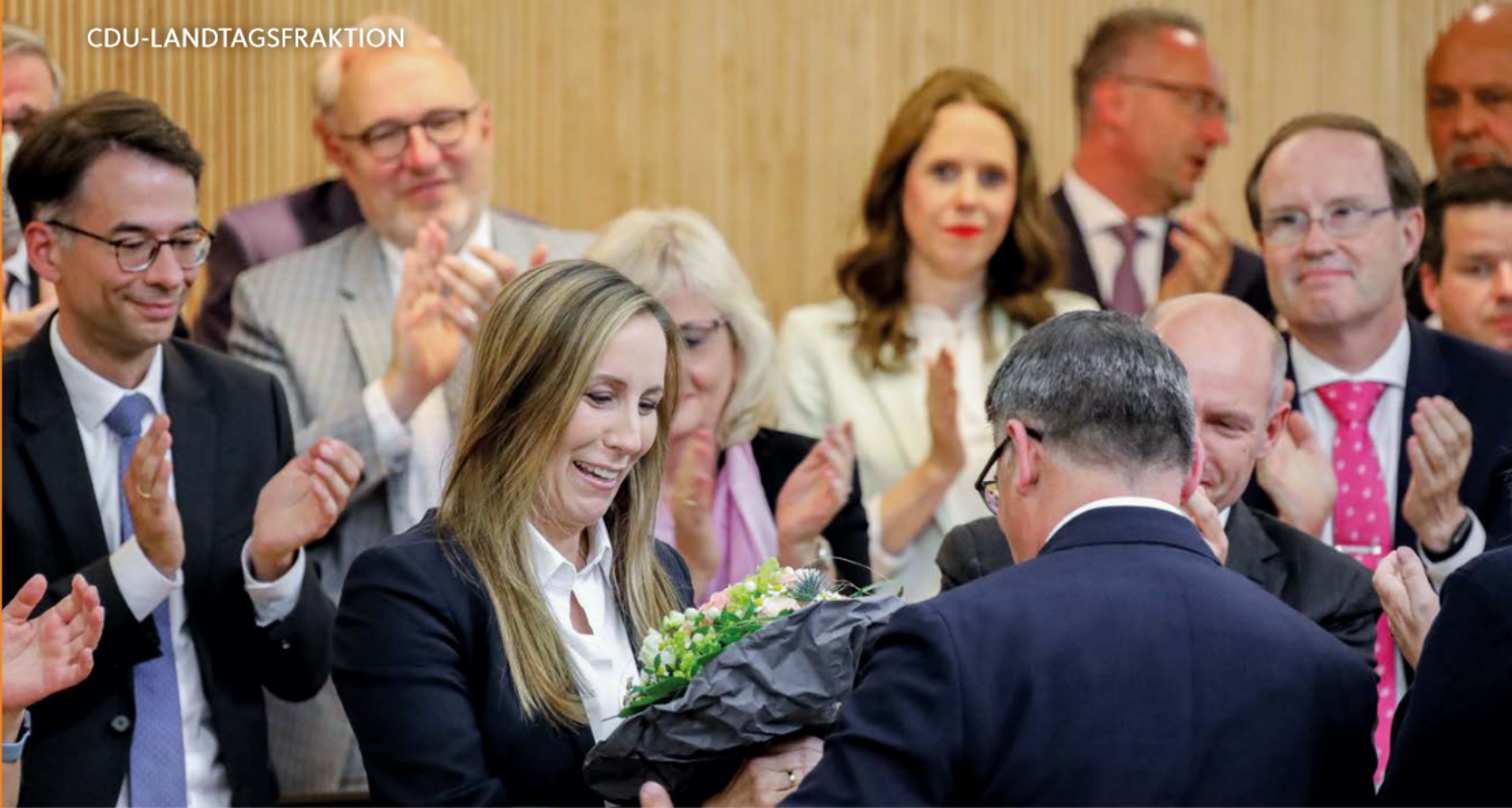
Die 42-jährige Astrid Wallmann ist die erste Frau an der Spitze des hessischen Parlaments.

Boris Rhein ist ein sehr erfahrener und über Fraktions- und Parteigrenzen hinweg angesehener und hoch geschätzter Politiker und Kollege. Sowohl als hessischer Wissenschafts- wie auch als Innenminister hat er politische und gesellschaftliche Entscheidungen von höchster Bedeutung für unser Land an vorderster Stelle erfolgreich mitgestaltet. Als Präsident des obersten Verfassungsorgans in Hessen hat er den Hessischen Landtag nach innen und außen über Jahre hinweg in hervorragender und überzeugender Weise vertreten und repräsentiert. Und nicht nur deshalb sind wir absolut davon überzeugt, dass er unser Land mit ebenso viel Weitsicht und Sorgfalt, mit Leidenschaft in der Sache und mit Blick auf das Wohl der Menschen führen und weiterentwickeln wird. Dafür wünschen wir ihm alles Gute, Gottes reichen Segen und lassen ihn wissen: