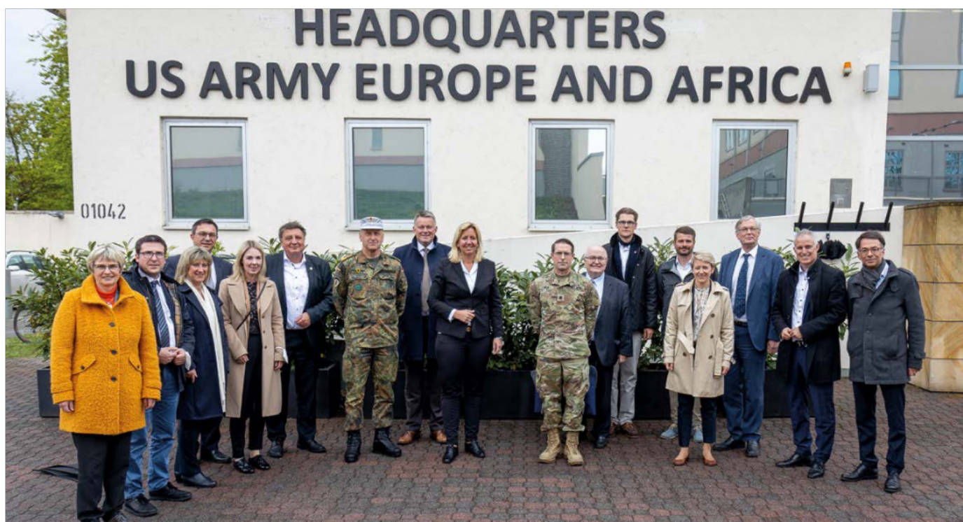
Die Fraktionsvorstände aus Hessen und Rheinland-Pfalz zu Besuch beim Hauptquartier der US Army Europe and Africa in Wiesbaden

Gerade deswegen war es wichtig und richtig, dass die Union im Bund die seit Wochen fehlende Führung des Kanzlers eingefordert und die Entscheidung für die Lieferung