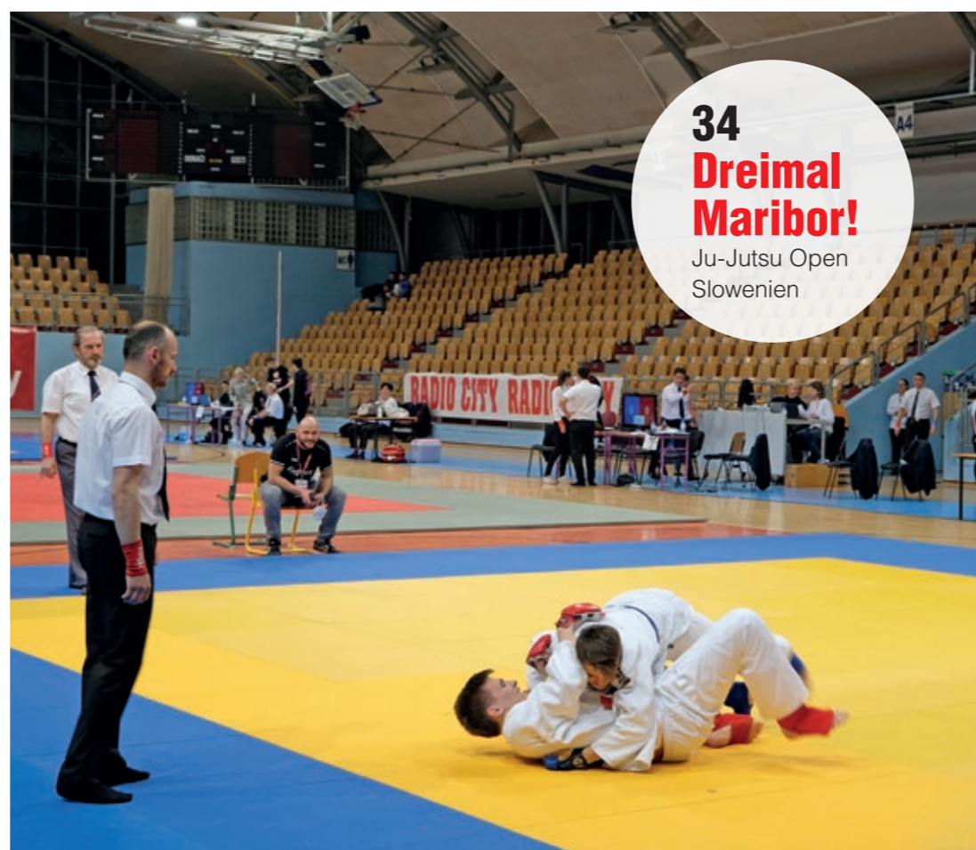
34 Dreimal Maribor! Ju-Jutsu Open Slowenien