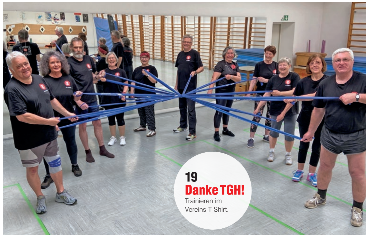
19 Danke TGH! Trainieren im Vereins-T-Shirt.