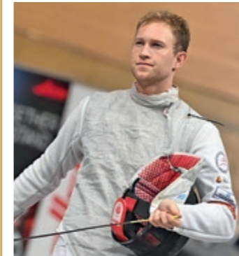
Alexander Kahl Platz 1 Florett dt. Rangliste