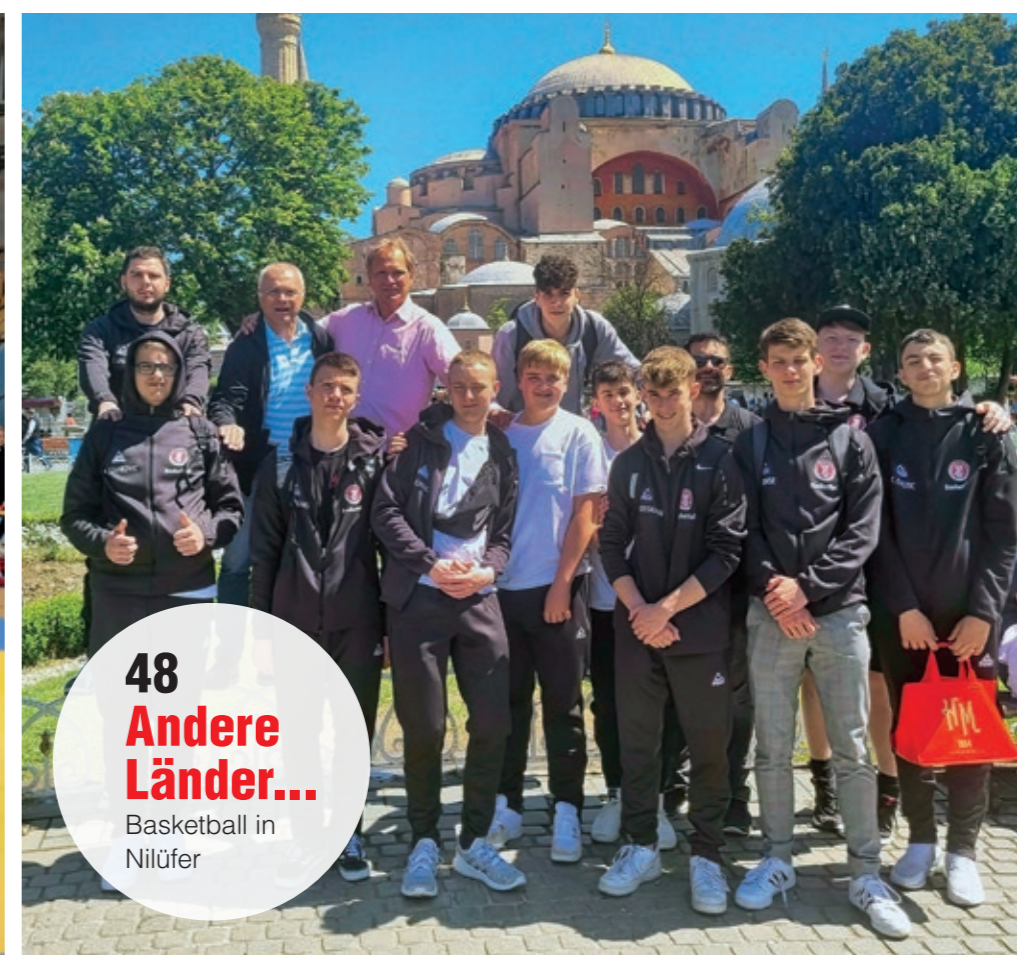
48 Andere Länder... Basketball in Nilüfer