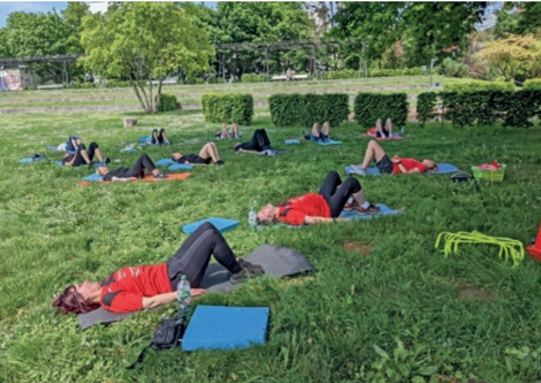
Yoga unter der Eiche