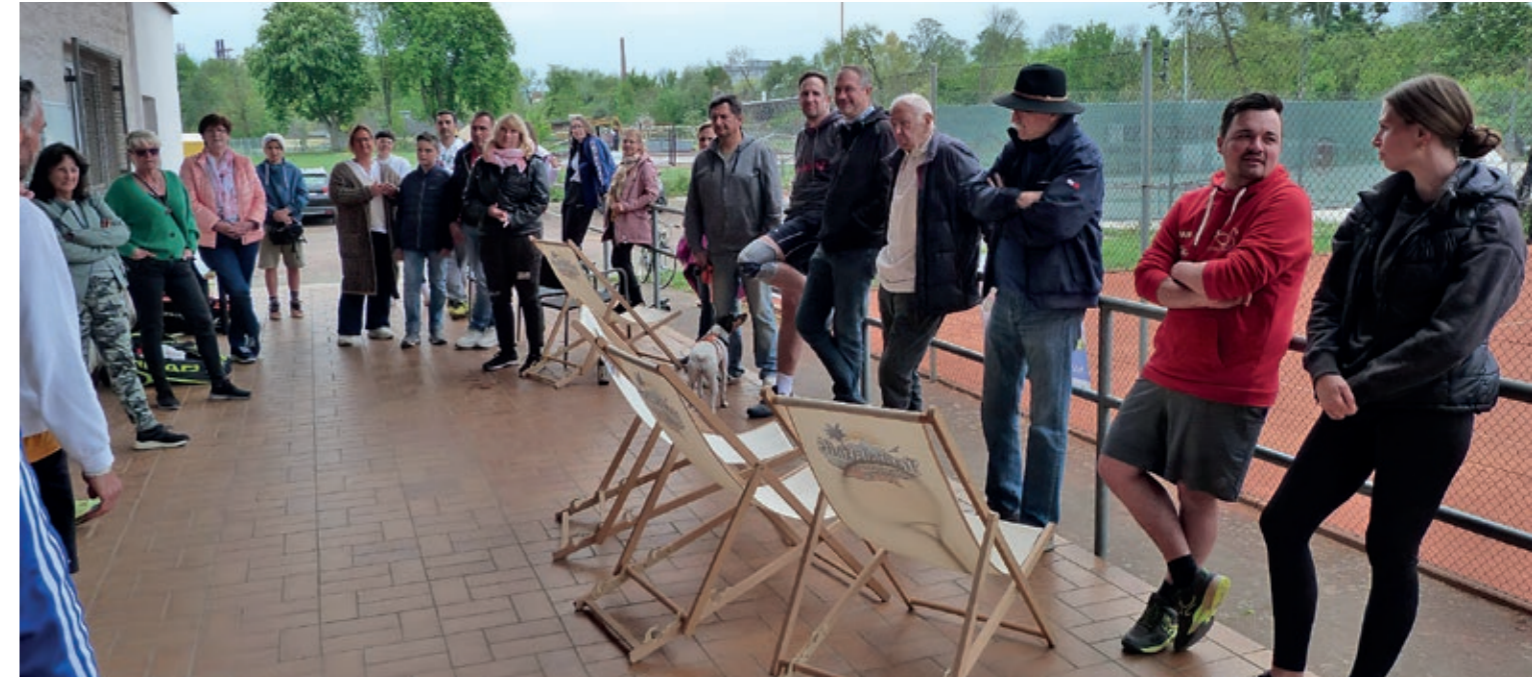
Zuschauer Tag der offenen Tür