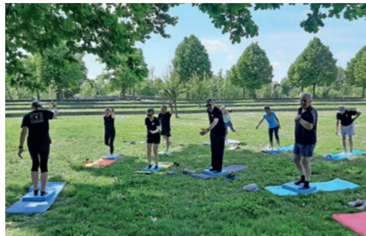
Balance im Schatten

Schwerpunkt unserer sportlichen Aktivitäten ist unser regelmäßiges Training am Montag. Dabei bieten wir „ganzjährig“ ein abwechslungsreiches und saisonal abgestimmtes Trainingsprogramm. Traditionell werden in der SKI-Abteilung auch die sozialen und zwischenmenschlichen Kontakte unter den Abteilungsmitgliedern gepflegt. Sei es nun bei gemeinsamen Wanderungen oder einem humorvollen Rosenmontagstraining. Dieser Teil ist leider pandemiebedingt in der Vergangenheit etwas zu kurz gekommen. Es ist eben ein Unterschied, ob man wöchentlich ca. 1,5 Std. miteinander trainiert oder einfach mal einen Tag gemeinsam verbringt. Aus diesem