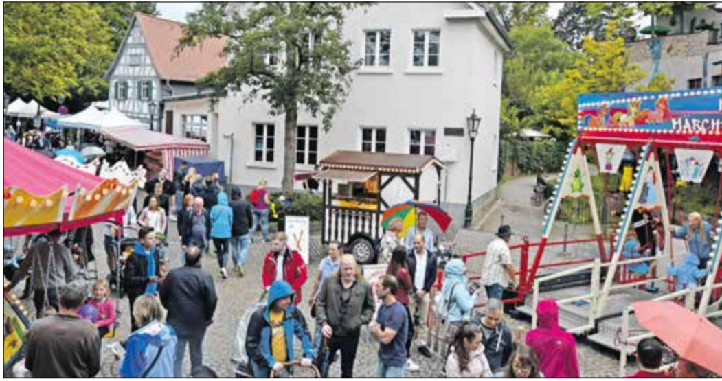
Auch in diesem Jahr wird auf den Straßen und Plätzen der Innenstadt gefeiert.