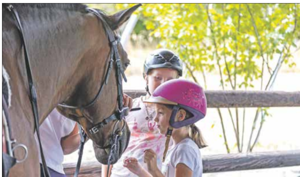
Sichtlich neugierig und entspannt genossen die Kinder die Nähe zu den Pferden.

Auch der Verein „Miteinander leben in Kelkheim e.V.“ erhofft sich durch das Engagement, dass die Kinder und ihre Angehörigen von dem Kontakt mit den Pferden profitieren werden. Fortsetzung auf Seite 2