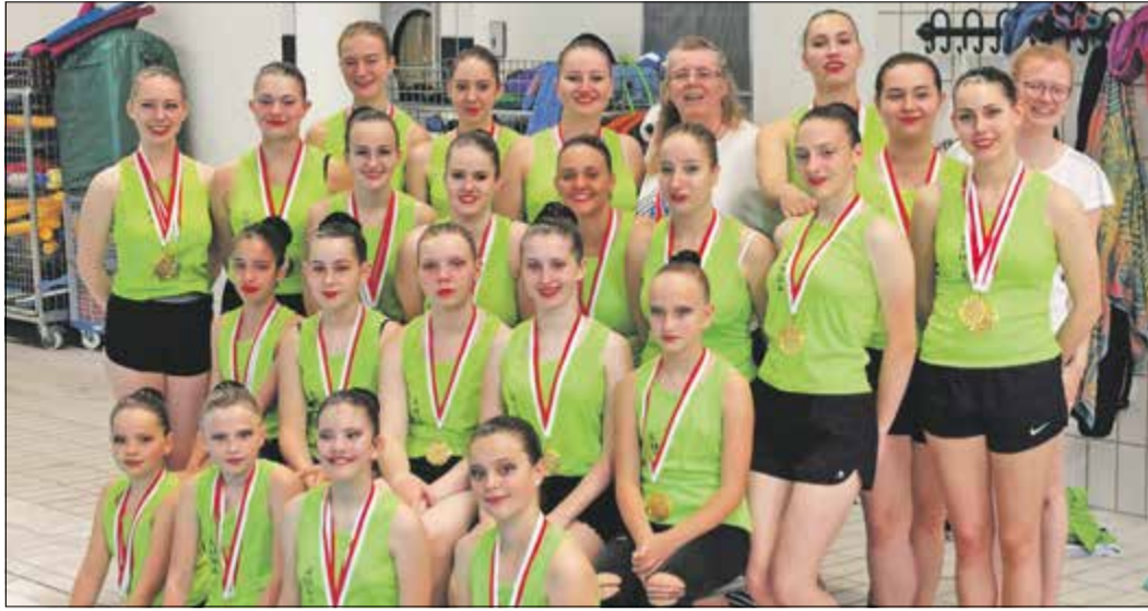
Die Siegerinnen des ESSC nach ihrer erfolgreichen Teilnahme an den Hessenmeisterschaften

Bad Soden (bs) – Mit dreizehnmal Gold kehrten die Synchronisten des Ersten Sodener Schwimm-Clubs von den Hessischen Altersklassen- und Offenen Meisterschaften zurück, die Anfang Juli in Frankfurt stattfanden. Das Synchro-Team aus Bad Soden dominierte die Veranstaltung und ließ den Konkurrentinnen der anderen Vereine nur vier weitere Meistertitel übrig.