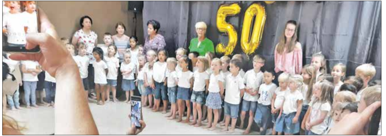
Schick hatten sich alle gemacht für das besondere Jubiläum.

delle und Projekte, die in der Sonnenburg stets für eine besondere Atmosphäre sorgen, Revue passieren. Im Anschluss an den offiziellen Teil sorgten Tanz- und Musikdarbietungen, die die Kinder in wochenlanger Vorbereitung einstudiert hatten, für einen kurzweiligen Nachmittag, bei dem auch die Gelegenheit bestand, mit dem Kitateam persönlich ins Gespräch zu kommen. Zur Stärkung gab es eine ganze Reihe kindgerechter Snacks, die in Zusammenarbeit mit dem Förderverein der Sonnenburg vorbereitet worden waren.