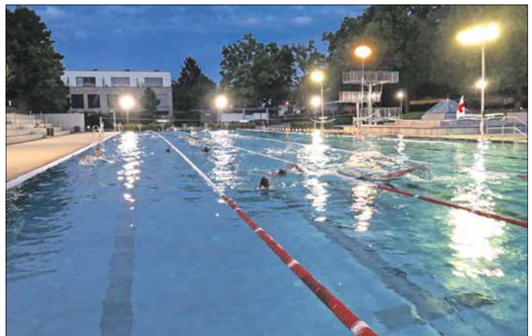
Tolle Stimmung am Abend des ersten Ferienwochenendes

Annette Gäbler vom Orga-Team blickt nach der schönen Veranstaltung optimistisch in die Zukunft. So könnte es auch im Jahr 2023 eine Neuauflage des Schwimmfestes geben. Der große Zuspruch bestätigt einmal mehr, dass das fröhliche Schwimmfest im FreibadSoden für viele Familien ein besonderer Anziehungspunkt ist.