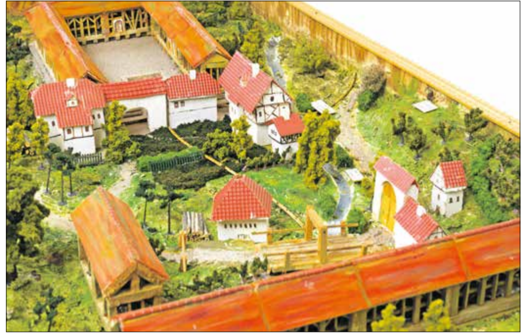
Modell der Sodener Saline