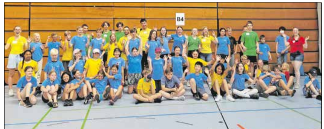
Die Gruppe B der Ferienspiele.