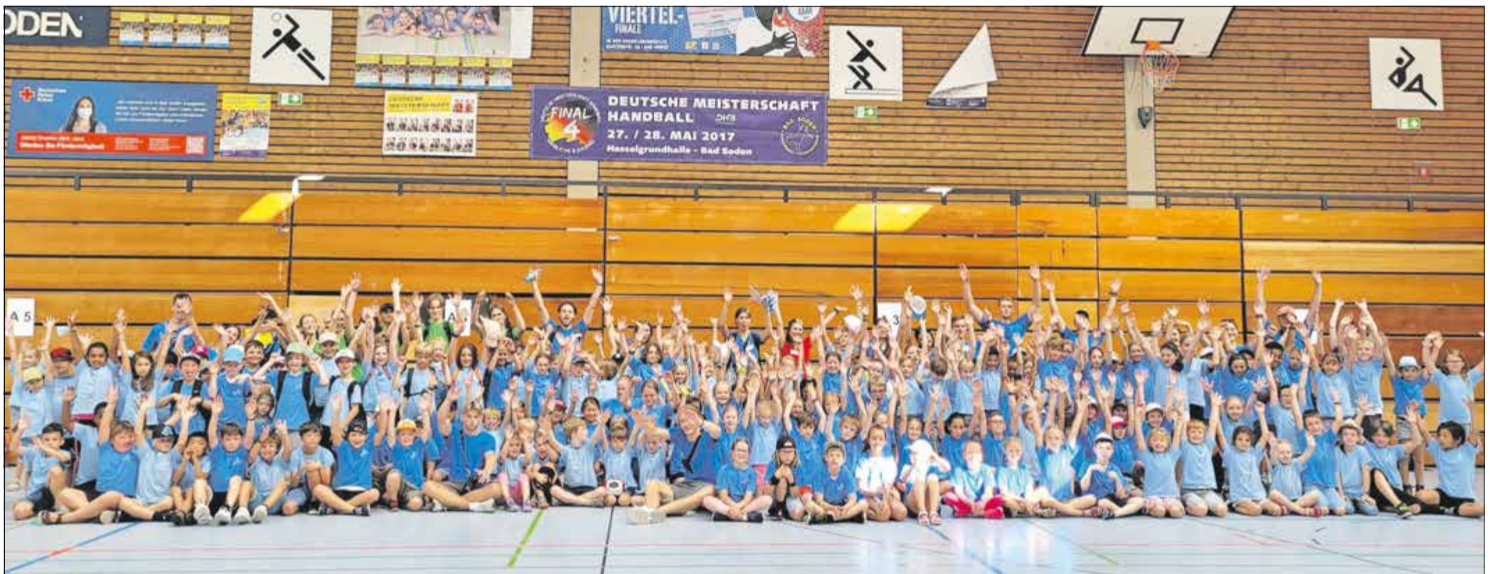
Die Kinder der Gruppe A und B freuten sich auf die Ferienspiele.