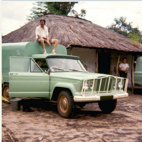
Der Kaiser Jeep, der im Reisedienst in Malawi nützliche Dienste leistete

Im April merkte ich, dass sich im Land Unheil zusammenbraute. Ich hörte eine Rundfunkansprache von Präsident Dr. Hastings Banda. Er behauptete, Jehovas Zeugen würden sich in die Politik einmischen und keine Steuern zahlen. Das war natürlich völlig aus der Luft gegriffen. Wie wir alle wussten, war das eigentliche Problem unsere Neutralität, besonders unsere Weigerung, Parteimitgliedskarten zu kaufen.