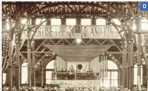
C. Die Besucher des Kongresses, der 1922 in Cedar Point (Ohio) stattfand