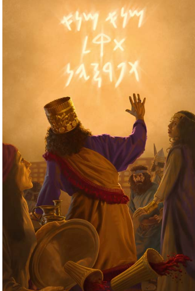
Jehova nahm Belsazar das Königreich weg und gab es den Medern und Persern (Siehe Absatz 12)

12. Nenne ein Beispiel dafür, dass Jehova Könige abgesetzt hat. (Siehe Bild.)