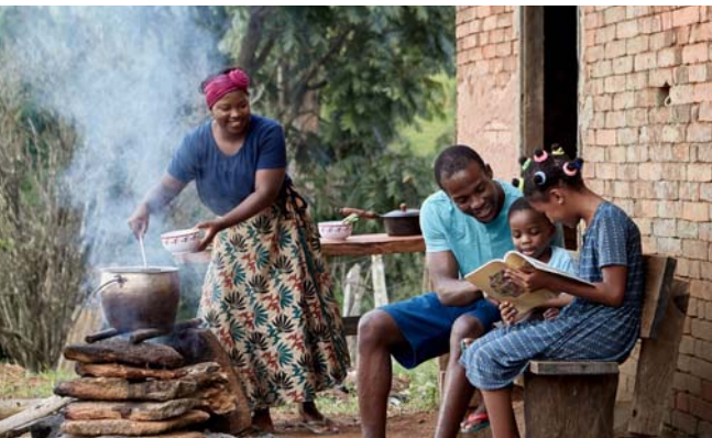
Eine ausgewogene Ansicht über Geld hilft uns, mit dem zufrieden zu sein, was wir haben (Siehe Absatz 16)

dein Herz, denn ihm entspringen die Quellen des Lebens“ (Spr. 4:23). Um unser buchstäbliches Herz zu schützen, müssen wir uns gesund ernähren, ausreichend bewegen und schlechte Gewohnheiten meiden. Ähnliches gilt für unser sinnbildliches Herz. Wir ernähren uns täglich von Gottes Wort, bereiten uns auf die Zusammenkünfte vor und beteiligen uns daran. Aktiv bleiben wir, indem wir uns regelmäßig im Predigtendienst einsetzen. Und schlechte Gewohnheiten meiden wir, indem wir uns von allem fernhalten, was unser Denken verderben könnte, zum Beispiel unmoralische Unterhaltung und schlechter Umgang.