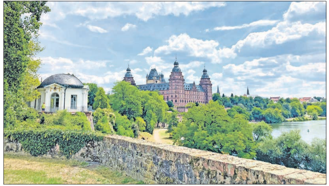
Begehrtes Fotomotiv: Bis ins Jahr 1803 residierten im Aschaffener Schloss Johannisburg die Kurerzbischöfe.

Ohne das Ziel aus den Augen zu verlieren, geht es wieder bergauf, vorbei am klassizistischen Frühstückstempel über den letzten noch erhaltenen Teil des ehemaligen Stadtgrabens hinweg zum Pompejanum. Begeistert von der Kultur der Antike, ließ König Ludwig I. von 1840 bis 1848 diese Nachbildung eines Pompejier Wohnhauses bauen. Es sollte als Anschauungsobjekt dienen und erfüllt diesen Zweck auch heute noch. Umringt ist das Gebäude, das den Besucher in die Zeit des Altertums zurückversetzt, von einer mediterranen Gartenanlage. Hier findet man Mandelbäume, Trauben und Araukarien. Ein Laubengang bietet Schatten, und der wasserspeiende Löwe davor eine kleine Abkühlung.