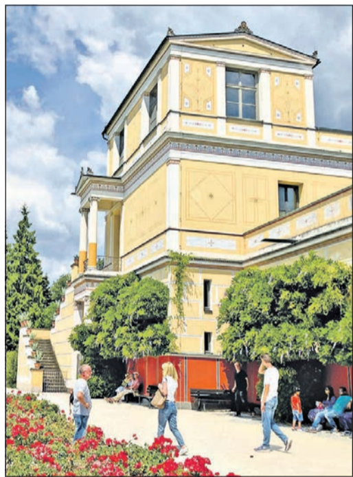
Begeistert von der Kultur der Antike ließ König Ludwig I. von 1840 bis 1848 diese Nachbildung eines Pompejier Wohnhauses bauen.

Das Schloss inklusive Schlossgarten ist im Sommer täglich von 9 bis 18 Uhr geöffnet. Montags ist Ruhetag. Der Eintrittspreis beträgt 3,50 Euro, ermäßigt 2,50 Euro. Staatsgalerie, Paramentenkammer sowie die fürstlichen Wohnräume sind momentan geschlossen. Wer mag, kann direkt eine Kombikarte kaufen, die auch den Eintritt ins Pompejanum ermäßigt. Sie kostet sieben, ermäßigt sechs Euro. Das Pompejanum hat dieselben Öffnungszeiten wie das Schloss. Mehr Informationen gibt es im Internet unter www.schloesser-bayern.de . Jede halbe Stunde fährt eine Regionalbahn vom Frankfurter Südbahnhof zum Aschaffener Hauptbahnhof. Die Züge RB54 Richtung Bamberg und RB58 Richtung Laufach Bahnhof wechseln sich ab. Nachdem man den Südbahnhof mit der U3 oder S5 Richtung Südbahnhof angefahren hat, dauert die Weiterfahrt noch rund eine dreiviertel Stunde bis zum zentral gelegenen Aschaffener Hauptbahnhof. Umsteigen muss man ab Frankfurt Südbahnhof nicht mehr und zurück nach Frankfurt kommt man ebenfalls mit der RB54 Richtung Frankfurt Hauptbahnhof und RB58 Richtung Rüsselsheim Opelwerk Bahnhof.