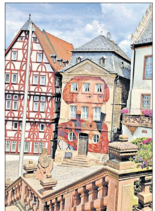
Blickfang ist das ehemalige Stiftskapitelhaus, heute Sitz des Stiftsmuseums.