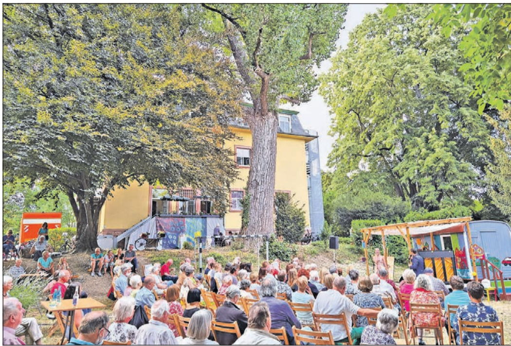
Zahlreiche Besucher genießen die Operette im Rahmen der Reihe „Kultur an unbekanntenen Orten“ an der Villa Luce.