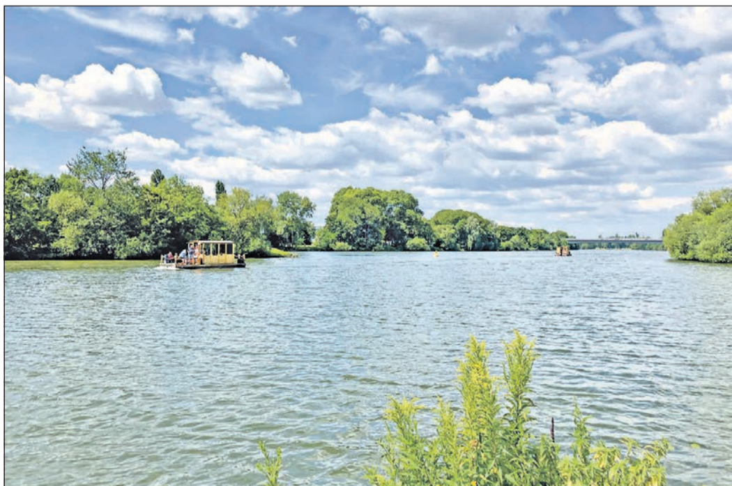
Ab und zu fährt eines der Mainflöße vorbei. Mit bis zu zwölf Personen kann man für ein paar Stunden selber zum Kapitän werden und über den Main schippern.

Bis ins Jahr 1803 residierten im Schloss Johannisburg die Kurerzbischöfe. Nun ist die Vierflügelanlage eine reichlich besuchte Attraktion. Einen weiten Blick über das Maintal bietet die Terrasse direkt vor dem Schloss. Hier kommen erste Urlaubsgefühle hoch. Blickt man auf den Fluss, befinden sich Schloss und Burgraben direkt hinter einem. Von 1605 bis 1614 dauerte der Bau unter der Leitung des Straßburger Bauleiters Georg Ri-