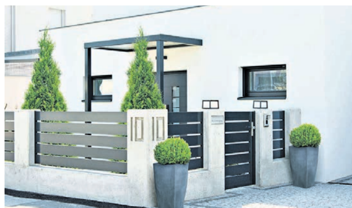
Aluminiumzäune mit Querlattung sind besonders beliebt und passen gut zur modernen Architektur.

Hanglage gibt es mit steigenden Bändern passende Lösungen. Unter www.guardi.de finden sich mehr Details und Anregungen für die eigene Planung.