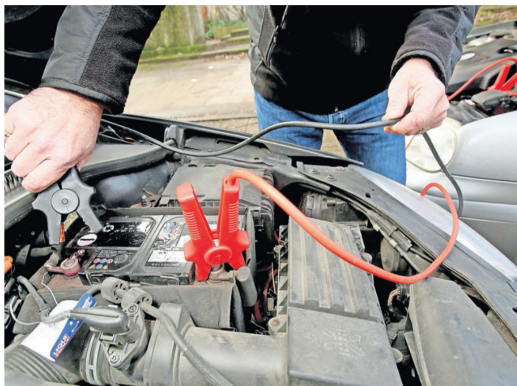
Bis die Funken fliegen: Wer Starthilfe gibt, sollte wissen was er tut.