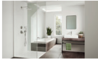
Für eine gesunde Umwelt: Auch bei Neubau und Sanierung auf Plastik verzichten. Kaldewei zeigt, wie es geht.

Schätzungen zufolge werden pro Jahr rund 600.000 Bäder- und Duschwannen aus Acryl in Neubauten,