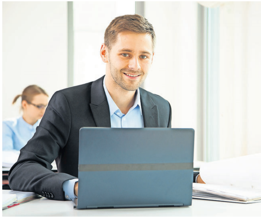
Wer noch neu ist im Berufsleben, wird oftmals nicht für voll genommen. Wichtig ist, nicht extra erwachsen wirken zu wollen - sondern, sich wohlzufühlen.

Wir suchen Reinigungskräfte (m/w/d) für Objekt: in Hasselroth, ab 18 Uhr, Di, 2,5 Std., Do, 3,5 Std (Minijob); im Kreis Gelnhausen ab 15 Uhr je 2 Std.; in Altenhaßlau je 2,5 Std. ab 14 Uhr Mo.-Fr. (Schulreinigung/Schlüsselobjekt). Wir suchen Springer/Vorarbeiter mit Führerschein (Klasse B/ PKW wird gestellt), 1% Regelung, 100-120 Std. pro Monat für den Main-Kinzig-Kreis. Uwe Hoss GmbH ☎ 06055/84109 o. 0171/7784180, e-mail: info@hoss-gmbh.de