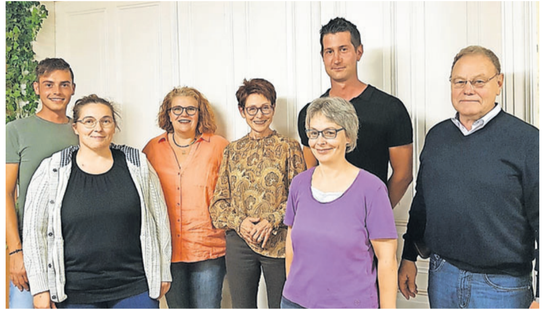
Der Verein schaut zuversichtlich in die Zukunft.

Jahreshauptversammlung des Reit- und Fahrvereins Bad Soden-Salmünster