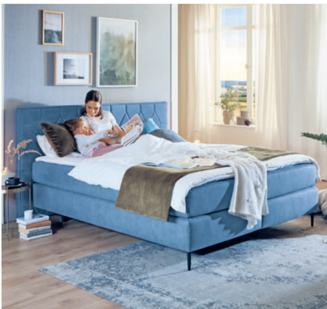
Die Original Orthopädisches Boxspringbetten gibt es nur bei Polster Aktuell. Bitte aus Sicherheitsgründen einen Beratungstermin vereinbaren.

Im Relaxsessel-Studio finden Kunden ihren Wunschstuhl im Maßanzug-Komfort