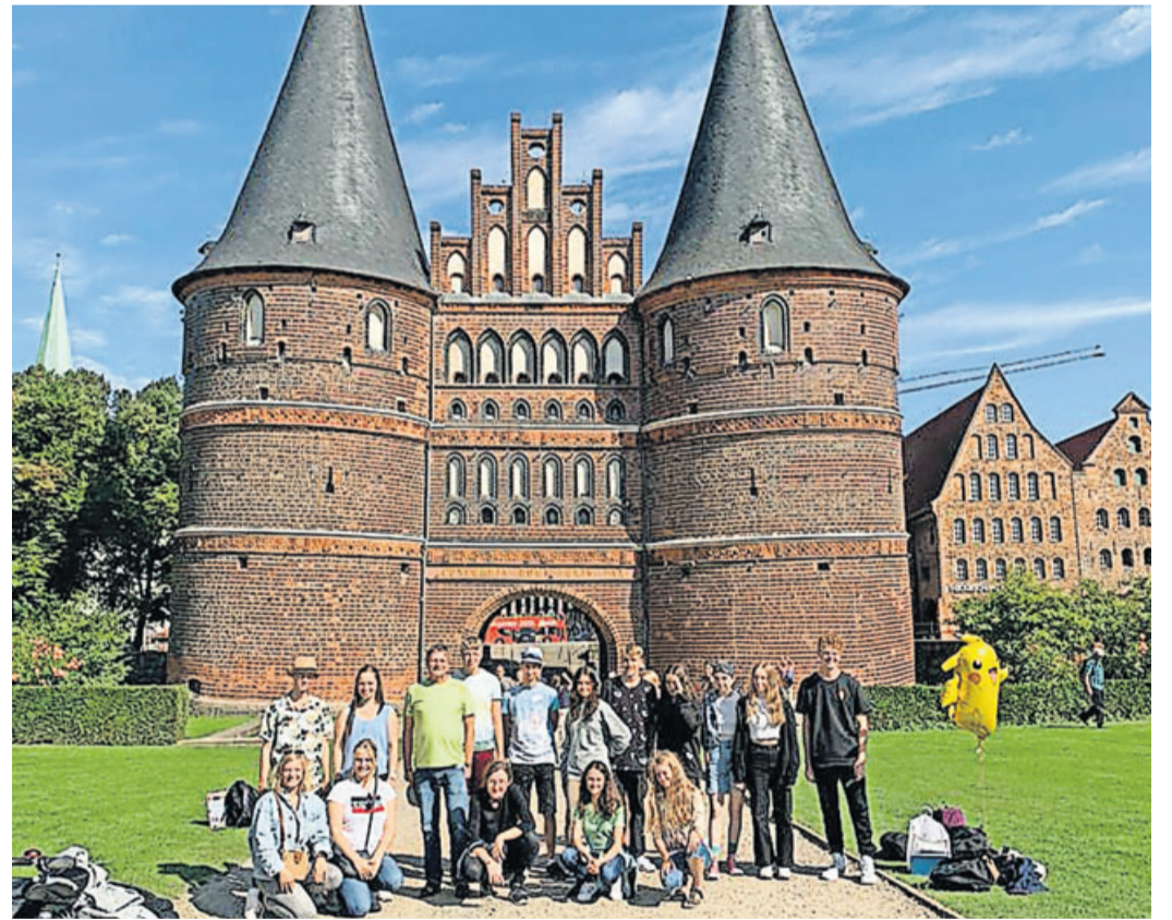
Die Stadt Lübeck wurde ebenfalls besucht.

Die nächsten Tage überraschten uns immer wieder mit Regen, sodass die ein oder andere Fahrradtour verschoben wurde. Dafür lernten wir