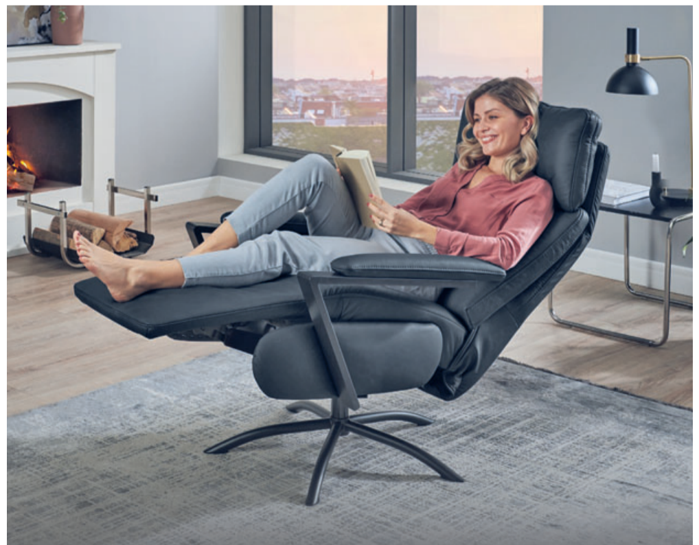
So wird Sitzen zum Vergnügen: Optimalen Komfort und jede Menge Bequemlichkeit garantieren auch die Orthopädisches-Relaxsessel.

Eine integrierte Sitz- und Aufstehhilfe rundet dieses moderne Sitzkonzept ab. cp