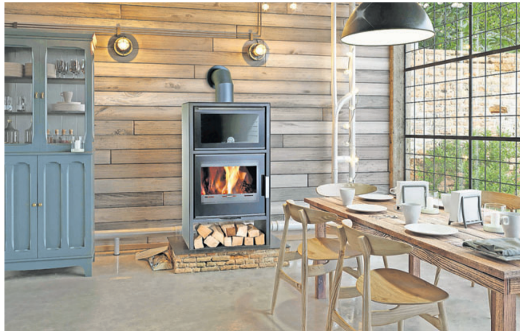
Spendet nicht nur Wärme, sondern sorgt auch für frische, duftende Croissants oder Kuchen: Der Holzkamin mit Backfach ist eine Bereicherung etwa für Wintergärten oder Foyers.

Holz als nachwachsender Brennstoff steht hoch im Kurs. Das Naturmaterial verbrennt klimaneutral, da es lediglich die Menge an Kohlen-