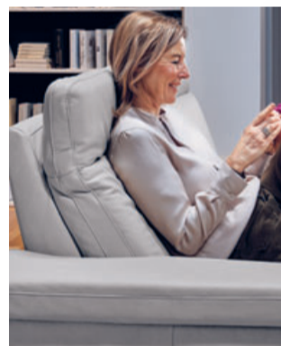
Die Extras der Orthopädisches-Serie machen den Unterschied: Der automatische Sitzvorzug zum lässigen Sitzen oder Liegen – die entspannende Herz-Waage-Funktion gibt es nun auch im Sofa – die Kopfteilverstellung für das bequeme Lesen. Vielseitiger geht es kaum.