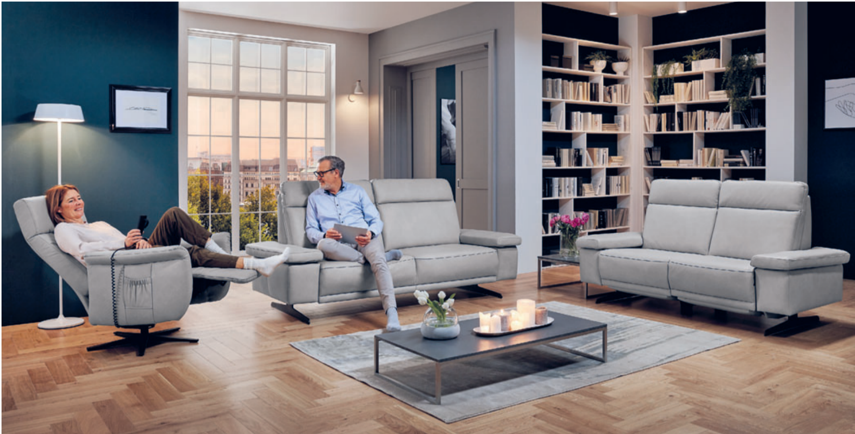
Orthopädisches Design – die Kombination aus stilischem Design und gesundem Sitzen. Die neue Kollektion begeistert die Kunden ebenso wie die Fleckschutz-Garantie, die Null-Prozentfinanzierung** oder der 500 Euro-Wert-Gutschein*.

500-Euro-Gutschein*, Fleckschutz und Null-Prozent- Finanzierung**