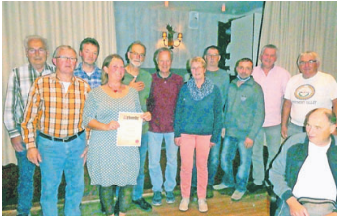
Die anwesenden Geehrten für 10jährige Mitgliedschaft.