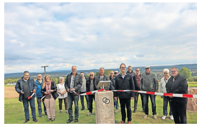
Heiraten mit Blick in die Rhön.

Neuhof. Ein ganz besonderer Ort zum Heiraten: Der neue Trauort in Rommerz wurde vor kurzem eingeweiht. Ab jetzt ist es möglich, in schöner Natur mit beeindruckendem Ausblick bis in die Rhön zu heiraten.