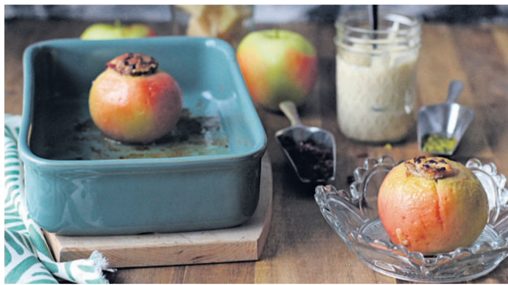
Bevor die Bratäpfel in die Röhre kommen, werden sie mit einer Gabel rundherum eingestochen. So wird verhindert, dass sie beim Backen platzen.