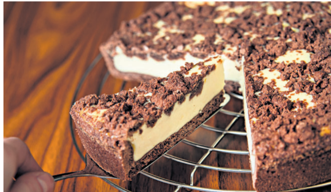
Für den Schoko-Mürbeteig eines runden Zupfkuchens (26 Zentimeter Durchmesser) sollten nicht mehr als 300 Gramm Mehl verwendet werden. Sonst wird der Teig schnell zu trocken.

Wer den Mürbteig mit Butter herstellt, sollte zügig arbeiten, ihn also nicht zu lange kneten, rät Anna Walz. Zu langes Kneten verhindert, dass der Teighoden nach dem Backen wirklich mürbe ist. «Ein weiterer Tipp nach Dietze ist, darauf zu achten, nicht zu viel Mehl für den Teig zu nehmen – möglichst nicht