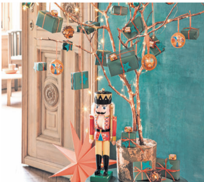
Das selbst gebastelte Lichterbäumchen wird zum Hingucker in jedem Haus und jeder Wohnung.

So wird es gemacht: Äste mit Sprühlack einfärben, gut durchtrocknen lassen. Gießbeton anrühren und in den Eimer zurückgießen. Deko-Äste senkrecht in den leicht angehärteten Gießbeton drücken und über Nacht aushärten lassen. Eimer mit einem Cutter vorsichtig einschneiden und von der Betonvase lösen. Mit Borstenpinsel die Äste sowie Betonvase ungleichmäßig mit Bastelkleber bestreichen, Blattkupfer auf die eingestrichenen Stellen legen, sanft andrücken. Bäumchen mit LED-Lichterkette schmücken. 24 kleine Geschenke in Geschenkpapier einschlagen, mit Schleifenband und Pralinen verzieren. Nach Vorlage Sterne aus Bastelkarton ausschneiden und mit Zahlen von 1 bis 24 beschriften. Geschenke mit Weihnachtsaccessoires und Blechkugeln an den Ästen befestigen.