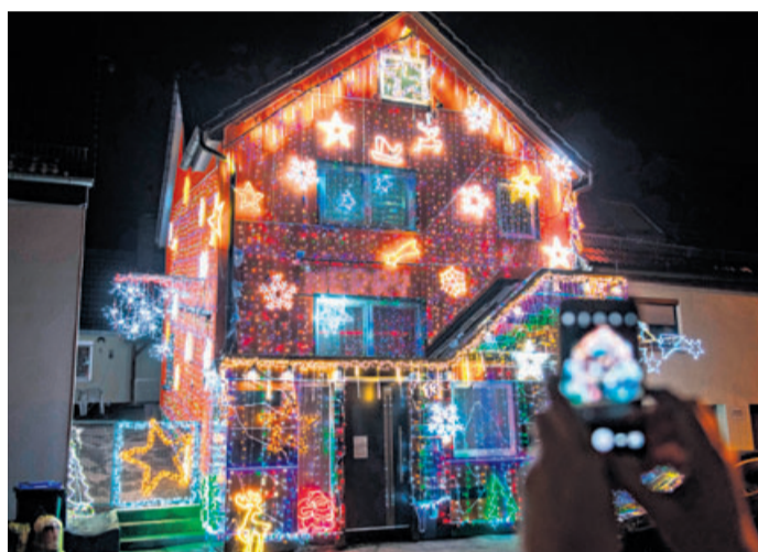
Zu Weihnachten holen viele ihre Lichterketten wieder raus. Doch wer zu viel aufhängt, kann mit dem Licht den Nachbarn um den Schlaf bringen.