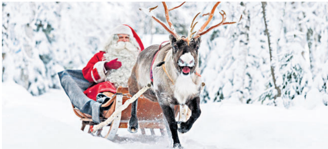
Der „echte“ Weihnachtsmann kann nur aus Finnland kommen, er ist mit dem Schlitten unterwegs und klopft Heiligabend an die Haustüren.

komfortablen Fähren Passagiere nach Finnland, Schweden und auf die Åland-Inseln. Die Anreise per Fähre bietet viele Vorteile: Auto, Reisemobil, Motorrad und sogar Haustiere können bequem mitgenommen werden, man spart Geld und Zeit.