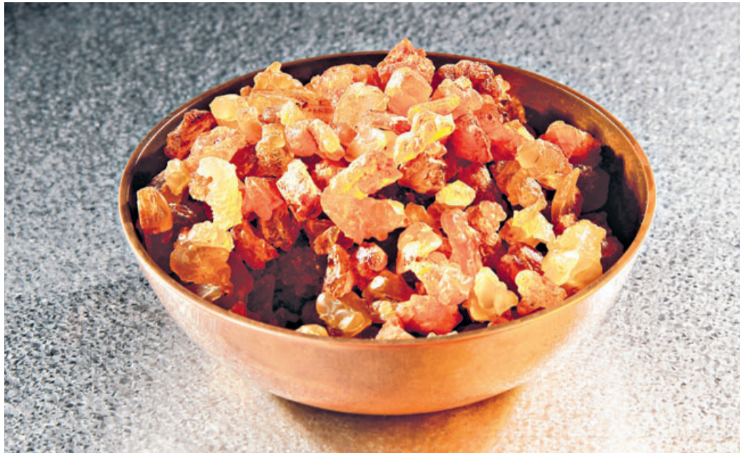
Myrrhe: Opfertgabe und begehrte Arzneipflanze.

Die Myrrhe gehört zu den ältesten natürlichen Heilmitteln der Menschheit, deren Einsatz sich besonders bei Darmerkrankungen bis heute ins moderne Zeitalter bewährt hat. Gerade jetzt in der (Vor-)Weihnachtszeit wird vielen Menschen auch die frühere Bedeutung der Myrrhe wieder bewusst.