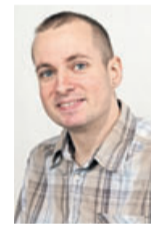
Kai Hergenröther Druckereiverwaltung