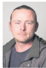
Sebastian Fleckenstein Versand