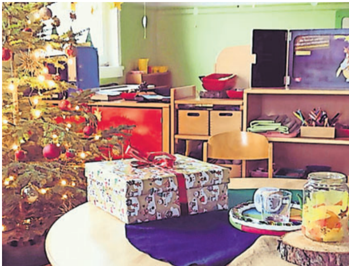
Adventskreis mit der Adventskiste.