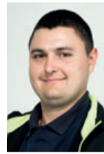
Marco Iljazovic Versand