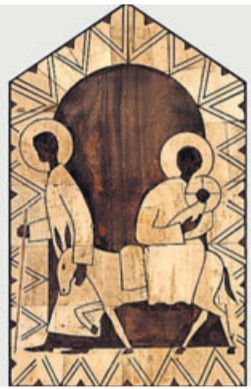
„Flucht nach Ägypten“. Foto: Ateliers et Presses de Taizé

Liebe Leserin, lieber Leser! Auf dem Esel ist noch Platz! Das war einer meiner ersten Gedanken, als ich das Kunstwerk „Flucht nach Ägypten“ in diesem Sommer in Taizé entdeckt habe. Frère Denis, der Künstler, einer der Brüder von Taizé, verdeutlicht mit seiner Darstellung eine dramatische Situation: Das Leben des neugeborenen Jesus von Nazareth ist bedroht, das Heil liegt in der Flucht! Die junge Familie folgt der Aufforderung: „Steh auf, nimm das Kind und seine Mutter und flieh nach Ägypten.“ (Mt 2,13) Ich denke dabei nicht nur an die Situation vor 2000 Jahren, sondern an die dramatischen Bilder der internationalen Krisenherde des Jahres 2021 und der Flutkatastrophe in Nordrhein-Westfalen und Rheinland-Pfalz.