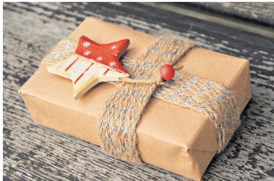
Aus Karton wird zu 80 Prozent wieder Karton.

Aber liegen sie damit überhaupt richtig? Ist Karton nachhaltig, wenn dafür Bäume sterben müssen? Werden gar tropische Regenwälder abgeholzt, um in Europa Karton zu produzieren? Diese Zweifel halten sich hartnäckig, sind aber völlig unbegründet. Das Holz für die hiesige Karton-Herstellung kommt nicht aus Regenwäldern, sondern größtenteils