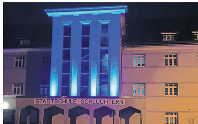
„Licht an! Die Stadtschule präsentiert sich“

Während einer abendlichen Führung werden die Unterrichtsumgebungen sowie das pädagogische Konzept der Haupt- und Realschule vorgestellt. Getreu dem Slogan „Licht an! Die Stadtschule präsentiert sich“ wird das gesamte Gelände durch vielerlei Lichter in Szene gesetzt. Hierdurch wird auch das Schulmotto „Sich wohlfühlen und etwas leisten“ an diesem Abend durch die passende Atmosphäre für alle erlebbar. Glanzpunkt wird sicherlich ein Gang durch die gerade erst neu entstandenen Räumlichkeiten der Schule sein.