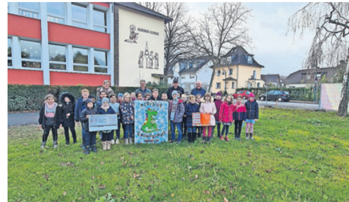
Die Kinder vor der Aloisius Grundschule in Ahrweiler.