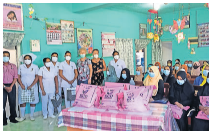
Die Geburtsklinik Maradana in Beruwala hat eine Lebensmittelspende erhalten.