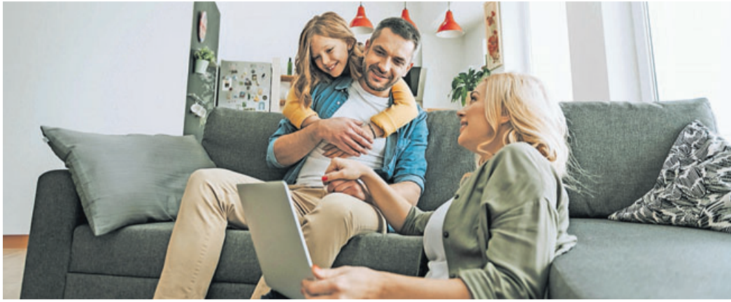
Familien werden 2022 stärker entlastet.