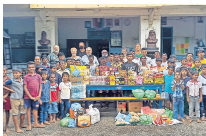
Das Bild zeigt die Übergabe einer Lebensmittelspende an das Waisenhaus Don Bosco.