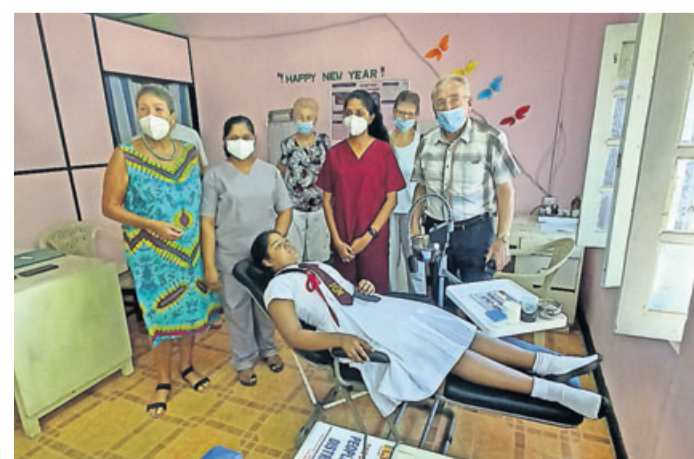
Ein dringend benötigter neuer Zahnarztstuhl konnte der Klinik Aluthgama übergeben werden.