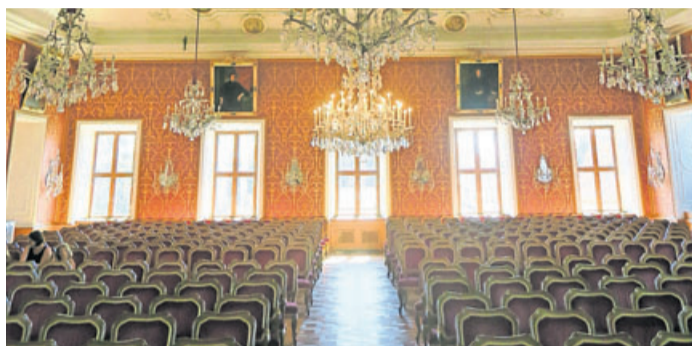
Leere Ränge in Fulda.

Fulda. Nachdem bereits die drei für Dezember 2021 geplanten Veranstaltungen aufgrund der aktuellen Situation verschoben werden mussten, müssen nun auch die beiden Januar-Veranstaltungen auf einen neuen Termin verlegt werden.