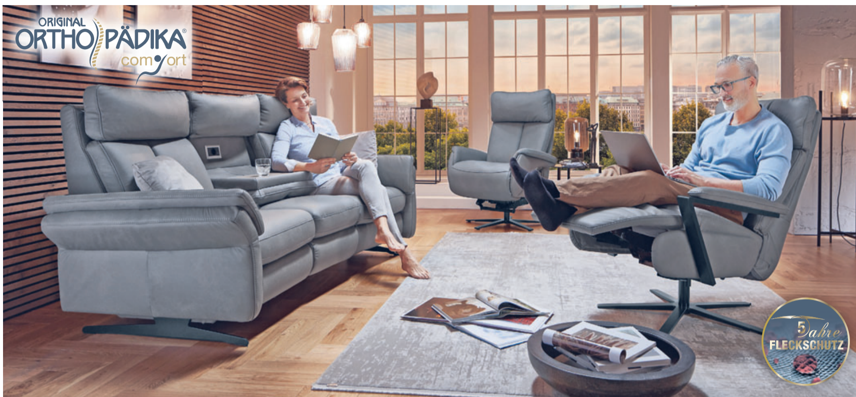
Exklusive Relaxfunktionen und Wohlfühlpolsterungen sorgen für die ergonomisch bequeme Haltung und ermöglichen das Relaxen in jeder Körpergröße.