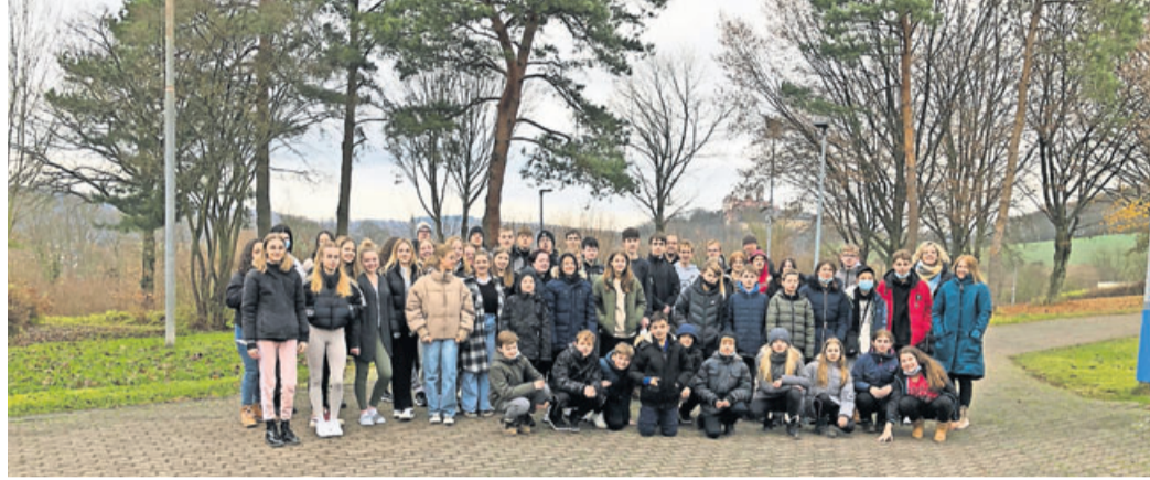
Schüler der Stadtschule Schlüchtern im Jugendzentrum.

Schlüchtern. Verschiedene Klassen der Stadtschule Schlüchtern verbrachten drei ereignisreiche Tage im Jugendzentrum Ronneburg.