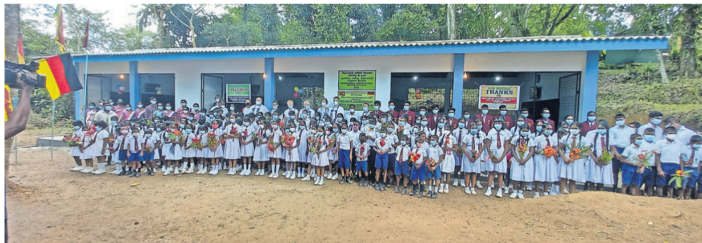
Das neue Schulgebäude der Badanagoda-School wurde feierlich eingeweiht, zur großen Freude der Kinder.

Kreissparkasse Schlüchtern: BIC HELADEF1SLÜ, IBAN DE27 5305 1396 0000 0999 94