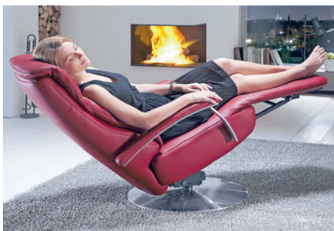
Das Relaxsessel-Zentrum bietet moderne Sitzkonzepte nach Maß an.