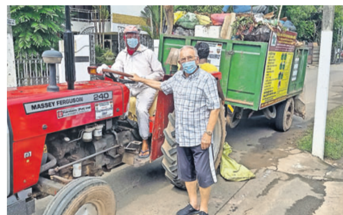
Der vom Kreisausschuss des Main-Kinzig-Kreises finanzierte Traktor wird von der Stadt Beruwala für die Müllabfuhr eingesetzt.