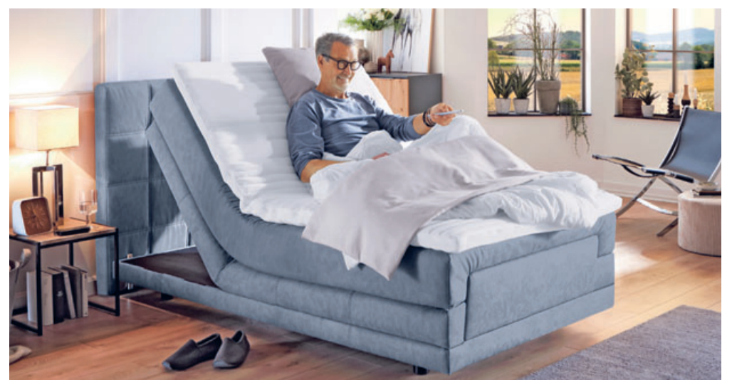
Die Original Orthopädiak Boxspringbetten gibt es bei Polster Aktuell. Aus Sicherheitsgründen können Sie auch einen persönlichen Beratungstermin vereinbaren.

und spezialisierter Herstellung. „Unsere Original Orthopädiak Möbel sind der Inbegriff gesunden Sitzens und Liegens. „Das hat uns das Bundespatentamt bestätigt.“ cp