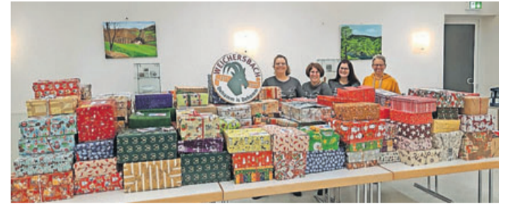
Viele Päckchen wurden gespendet.

Sinntal. 190 Weihnachtspäckchen und jede Menge Decken sind bei der diesjährigen Weihnachtspäckchen- und Deckensammel-Aktion des Kindergottesdienst-Teams aus Weichersbach zusammengekommen. Diese gehen an die Organisation „Das Kunterbunte Kinderzelt“ und kommen notleidenden Kindern in Rumänien zu Gute. Außerdem wurden Geldspenden gesammelt, die ebenfalls an das Kunterbunte Kinderzelt übergeben wurden. In diesem Jahr konnte wieder ein Kuchenbuffet, diesmal