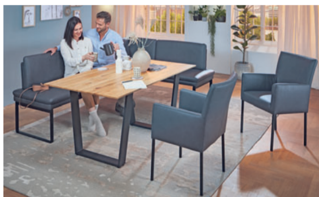
Ein einheitliches Gesamtbild: Die Essgruppen der Serie „Orthopädiak Dining“ lassen sich exakt auf Design und Bezugsmaterial aller Sofas anpassen

schadstofffrei, dermatologisch getestet und lebensmittelecht. „Wir schenken unseren Kunden, neben unserer kompetenten Ergo- und Komfort-Beratung, natürlich auch die Lieferung und Montage durch unsere speziell ausgebildeten Fachkräfte“, so Müller. Zu guter Letzt beinhaltet das Geschenkpaket attraktive Neueröffnungspreise* für individuell angepasste Sessel, Sofas und Betten. „Mit ihnen wird das kommende Jahr zum persönlichen 'Wellness-Jahr'.“ cp