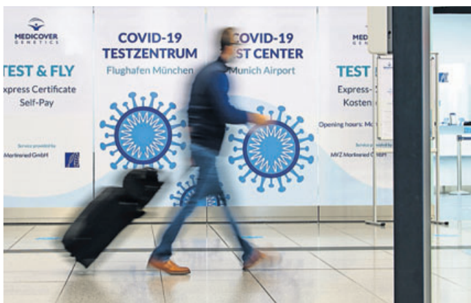
Testzentrum am Münchner Flughafen: Die Corona-Maßnahmen dürften das Reisen auch 2022 bestimmen.

Einst fühlte sich das weltweite Reisen selbstverständlich an. Doch seit bald zwei Jahren ist es damit vorbei. Die Corona-Pandemie zieht sich hin, Welle für Welle. Urlauberinnen und Urlauber schauen zugleich sehnsüchtig auf das Jahr 2022. Alles sieht danach aus, dass Corona auch das nächste Reisejahr prägen wird. Fünf Thesen mit einem Blick in die Zukunft.