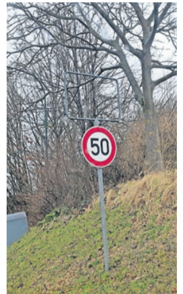
Auch andere Verkehrszeichen werden gerne entwendet.

„Das Verkehrszeichen entwendet werden kommt leider immer wieder vor“, führt Bürgermeister Dominik Brasch aus. „Besonders beliebt sind in der Regel Zeichen mit Geschwindigkeitsbegrenzungen“, ergänzt Brasch augenzwinkernd mit Blick auf den einen oder anderen Scherz für manch runden Geburtstag. Rechtlich betrachtet kann ein solcher Spaß aber weitreichende Folgen haben. Verfahren mit dem Tatbestand des Diebstahls, der Sachbeschädigung bis hin zum gefährlichen Eingriff in den Straßenverkehr sind die möglichen Konsequenzen, welche auf eine Person zukommen können, wenn diese Verkehrszeichen entwendet.