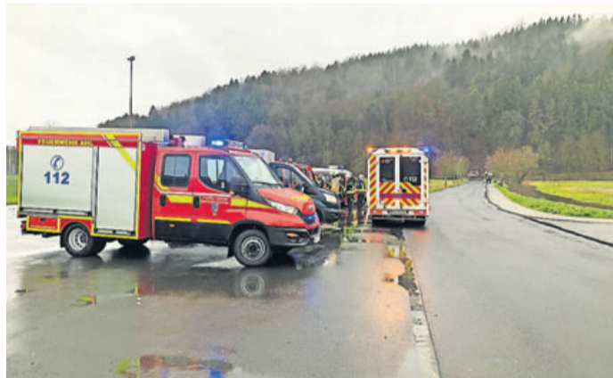
Nach intensiver Suche wurde der Einsatz abgebrochen.

suchten die Flußufer der Salz und der Kinzig zwischen Bad Soden und Wächtersbach koordiniert ab, aber auch über die Luftaufklärung konnte bei mehrfachem Überfliegen keine Person im oder am Wasser gefunden werden. Um 15.45 Uhr wurde der Einsatz schließlich nach intensiver Suche aller Kräfte abgebrochen, auch da es keine Bestätigung gab, dass sich tatsächlich eine Person in der Salz befand und in Not war. Ein Radfahrer hatte die Nachricht einer Passantin zugerufen mit der Bitte um Notruf, während dieser sich flussabwärts auf die vermeintliche Suche machen wollte. Der Radfahrer wurde aber während des gesamten Einsatzes nicht mehr angetroffen.