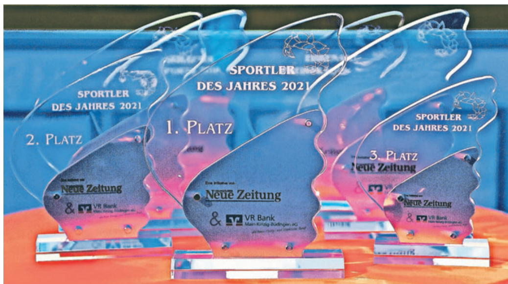
Auf die Sieger der GNZ-Sportlerwahl 2021 warten wertvolle Skulpturen und attraktive Geldpreise.

Pandemiebedingt wird im Rahmen der Sportlerwahl 2021 erneut kein Ehrungsabend ausgerichtet. Die Initiatoren der GNZ und der VR Bank Main-Kinzig-Büdingen werden allerdings für die herausragenden Vertreter der heimischen Sportszene eine offizielle Preisübergabe organisieren. Detaillierte Informationen dazu folgen.