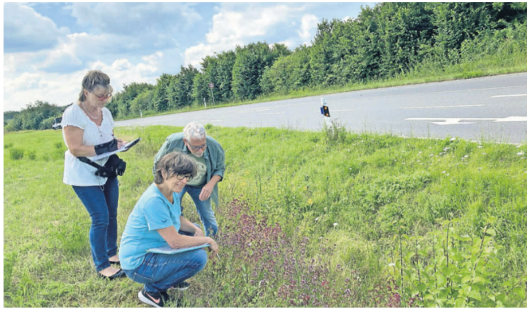
Im Lehrgang werden die Blühbotschafterinnen und Blühbotschafter sowohl theoretisch als auch praktisch geschult.