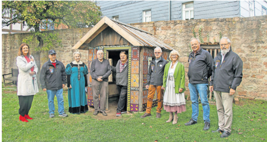
Alle Beteiligten freuen sich, dass nun ein neues und buntes Haus durch die gemeinsame Aktion geschaffen werden konnte.

Das Projekt „MKK-Märchenzeit“ wurde im Frühjahr 2020 während des ersten Corona-Lockdowns ins Leben gerufen. Es sollte eine nachmittägliche Unterhaltung für Familien geschaffen werden, die über die Homepage des Main-Kinzig-Kreises laufen konnte. In kurzer