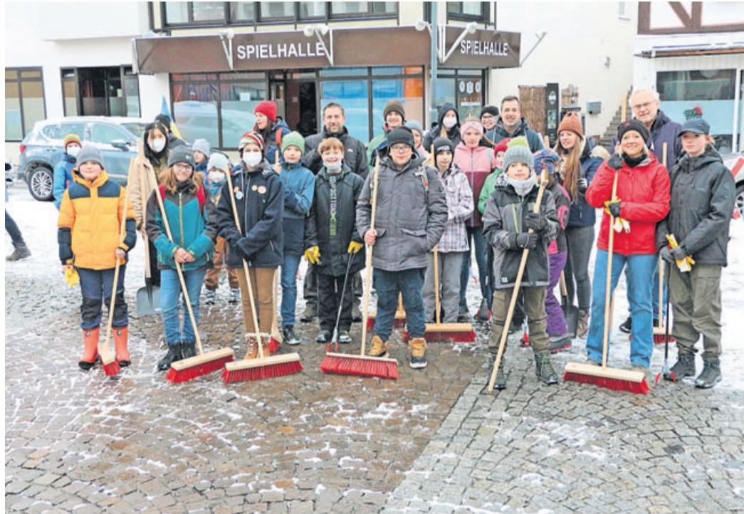
Das Ulrich-von-Hutten-Gymnasium war auch stark vertreten. Viele Schülerinnen und Schüler haben dem Wetter getrotzt und sich der Reinigung des Schulgeländes angenommen.

E-Mail: redaktion@bote.de Internet: www.bote.de