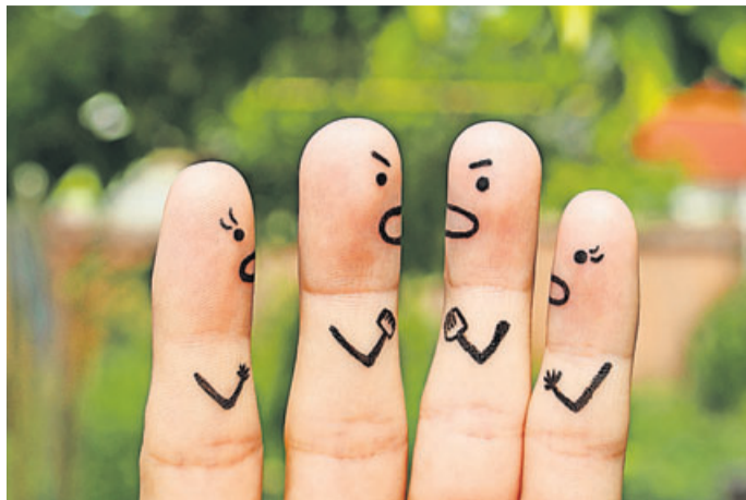
Auch in harmonischen Familien läuft nicht immer alles rund – und manchmal führt das zu langanhaltenden Konflikten. Ab sofort gibt es das Projekt Familienrat, das dabei hilft, wieder zueinander zu finden.

Der Familienrat kann Ihnen dabei gute Dienste leisten und mithelfen, die Probleme konkret anzusprechen und mit allen Beteiligten gemeinsam Lösungen dafür zu finden. Der Erfolg eines Familienrats beruht darauf, dass die Familie selbst viel besser als alle Profis und Fachkräfte weiß, was helfen kann und vor allen Dingen, welche Unterstützung sie benötigt. Immer wieder gibt es Hemmschwellen, sich in schwierigen familiären Situationen direkt ans Jugendamt zu