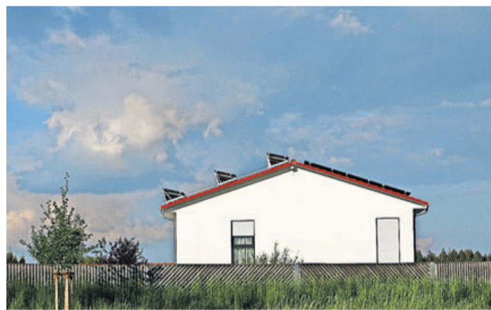
Wie gefährdet ein Haus bei Sturm oder Starkregen ist, hängt auch von seiner Lage ab.