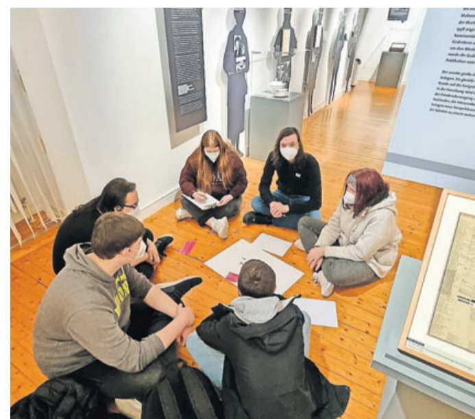
Gruppenarbeit während des Ausstellungsbesuches „Leben im Krieg“.