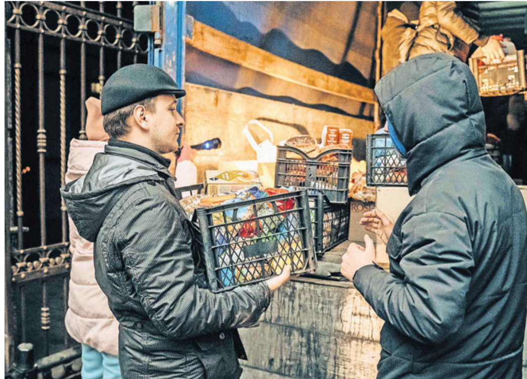
Verteilung der Lebensmittel.

Zusätzlich wird das Bistum jetzt 50.000 Euro an den Renovabis-Projektfonds der deutschen Bischöfe überweisen. Renovabis ist das Osteuropahilfswerk der Katholischen