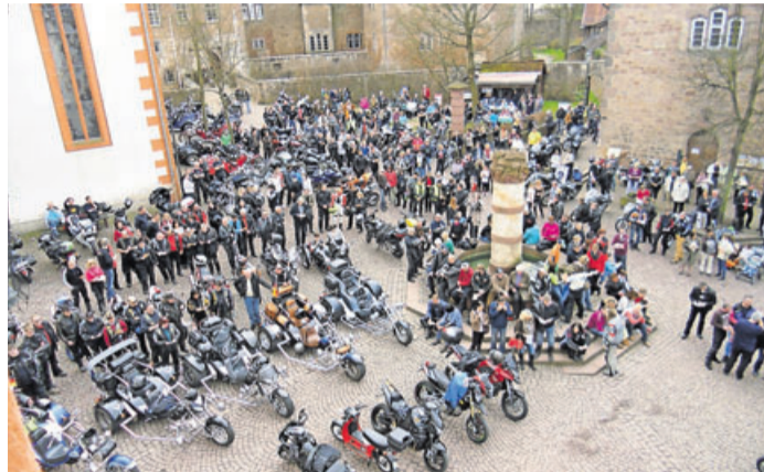
Motorradgottesdienst auf dem Kumpen.

Steinau. Nach zweijähriger pandemiebedingter Zwangspause veranstaltet der Club des Motorrads Steinau ( www.cdm-steinau.de ) gemeinsam mit den Steinauer Kirchen den Gottesdienst bzw. das Anlassen. Die Steinauer Bevölkerung sowie alle Freunde des motorisierten Zweirads sind für den Sonntag, 10. April ab 14 Uhr zu dem überregional bekannten „Anlassen“ eingeladen. Das „Anlassen“ beginnt mit einem ökumenischen Motorradgottesdienst und klingt bei Kaffee und Kuchen sowie Grilltem in der Markthalle