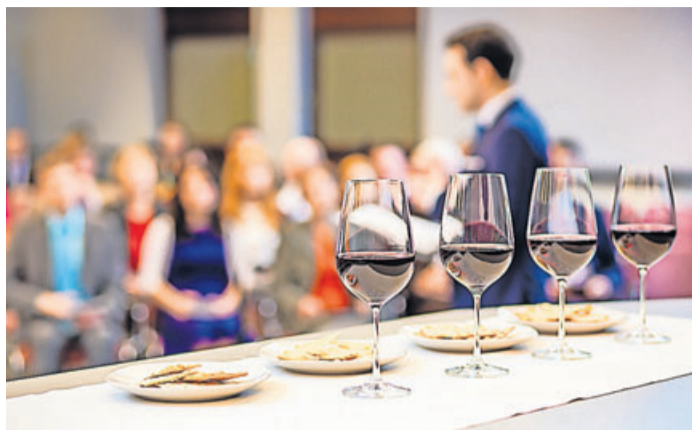
Gottesdienst am wichtigsten Feiertag von Jehovas Zeugen.