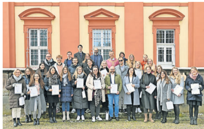
29 Frauen und Männer erhalten Missio Canonica

Die Verleihung in dem feierlichen Gottesdienst fand zum Abschluss eines Missio-Weekendendes für Religionslehrerinnen und Religionslehrer statt. Dabei standen neben dem gemeinsamen Austausch vor allem Anregungen für ihren Schulalltag sowie auch Fragen rund um die Zukunft des Religionsunterrichts im Fokus. In einer großen Runde mit Bischof Michael Gerber wurde über gesellschaftliche und per-