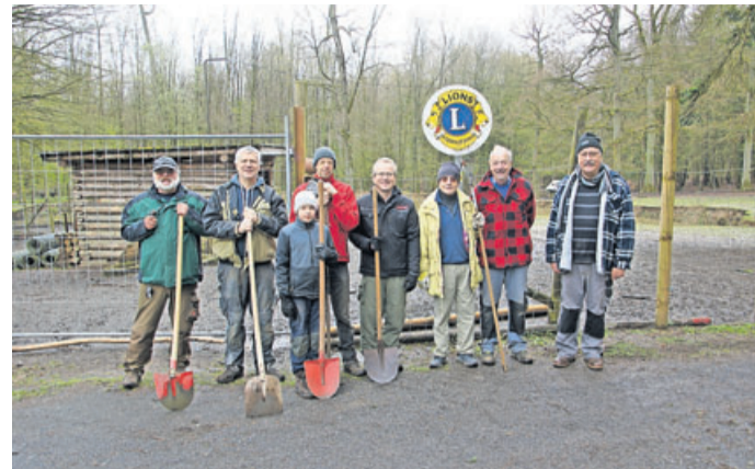
Gemeinsam wurde am Acis der Rundweg gesäubert.