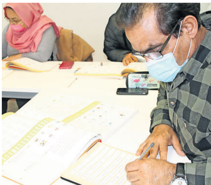
Im Mai startet ein Anfängerkurs A1.1 im „Check in“.

Bildungspartner Main-Kinzig erweitert Integrationskurs-Angebot