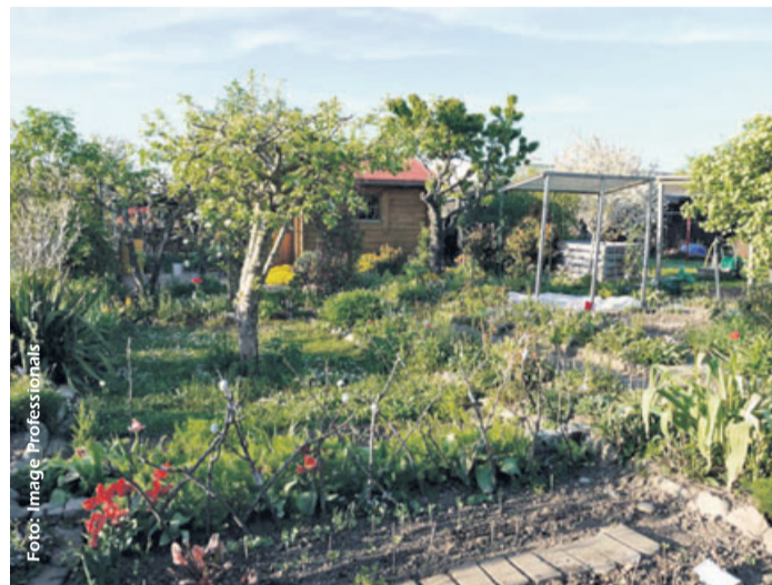
Täglich wird es grüner, man kann fast dabei zusehen. Wenn Gänseblümchen und Primeln nicht so schön blühen würden, hätte ich sogar schon den Rasen gemäht

Die Bedingungen sind also optimal – hoffentlich sieht das auch mein Gemüse so! Im Tomatenbeet habe ich Salat und Kohlrabi gepflanzt, daneben Spinat, Asia-Salate und Erbsen gesät. Kräuter und Unkräuter sprießen jedenfalls, schon kann ich Salate mit Zitronenmelisse, Giersch und Gundermann bereichern, Bärlauchbutter machen und Gartenschaukraut