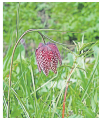
Führungen zu den Schachblumenwiesen bieten Naturparkführer an.

Die Führungen finden zwischen 11 und 17 Uhr statt und dauern jeweils 30 bis 45 Minuten auf einer Weglänge von etwa 1 Kilometer. Treffpunkt ist auf dem Festplatz, Aspenweg 1 in 36391 Sinntal-Altengronau. Der Landfrauenverein sorgt für das leibliche Wohl