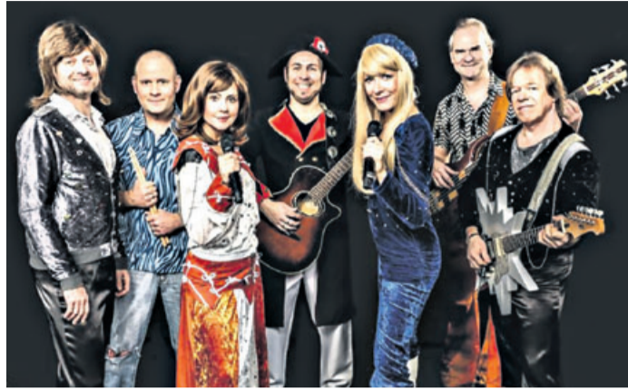
Zeitreise in die 70er-Jahre: „Waterloo – A Tribute To Abba“.

Die Cover-Show-Band „Waterloo – A Tribute To Abba“ präsentiert eine mitreißende Hommage und eine wunderbare Zeitreise in die goldenen 70er-Jahre. Zahlreiche Kostümwechsel und detailgetreue Abba-Choreografien erwecken ein Gefühl, wie man es aus Auftritten jener Zeit kennt. Zwei fantastische Sängerinnen mit einer Live-Band, die es versteht, den populären Abba-Sound nahezu authentisch rüberzubringen, spielen sich in die Herzen des Publikums und erschaffen unver-