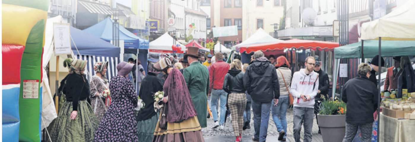
Der „Helle Markt“ dient auch als Plattform für den Handel. Am Sonntag ist verkaufsoffen.

Sonntag ist verkaufsoffen, großes Bühnenprogramm mit Vereinen