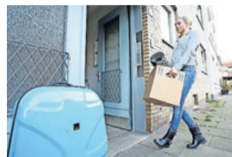
Die erste eigene Wohnung sollte nicht zu viel kosten.

Mit dem Beginn des Wintersemesters ziehen viele Studierende in ihre erste eigene Wohnung. Was das neue Zuhause kostet, hängt von der Stadt, der Lage, dem Zustand und der Größe ab, erklärt die Verbraucherzentrale NRW. Eine Faustregel: Die Miete sollte nicht mehr als ein Drittel des verfügbaren Budgets ausmachen.