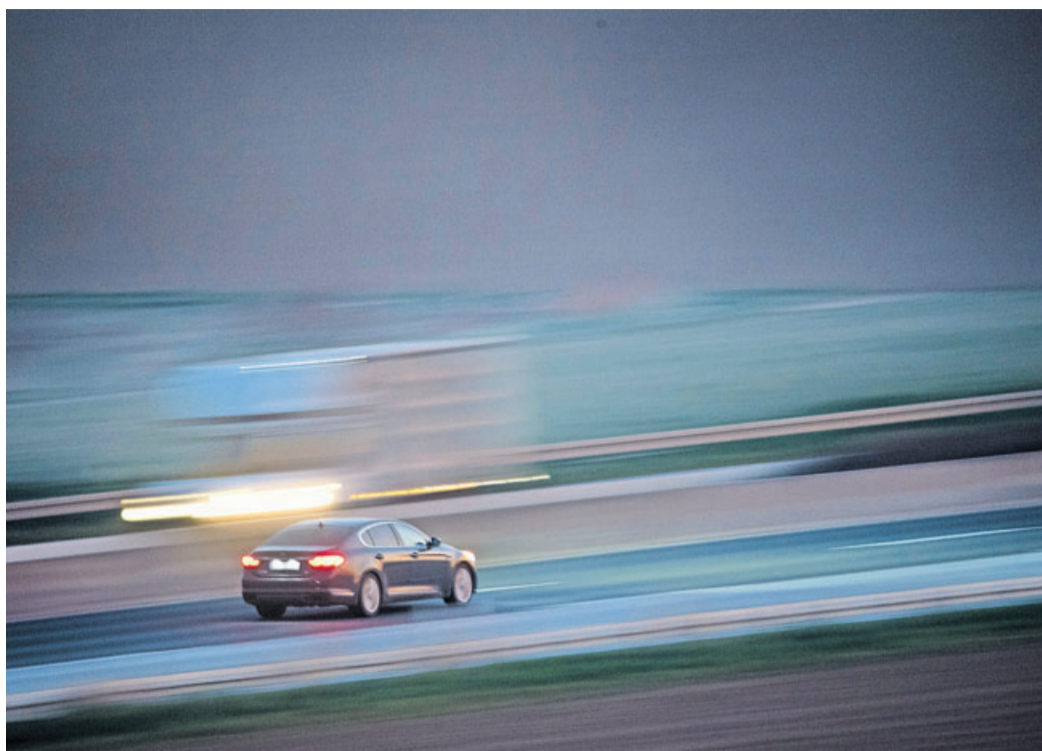
Flotte Fahrt: Wer aber schneller als erlaubt fährt, muss sich unter bestimmten Voraussetzungen dem Vorwurf des Vorsatzes stellen.

Für eine vorsätzliche Tempoüberschreitung reicht es aus, wenn Autofahrern bewusst ist, dass sie zu schnell sind. Dabei ist es egal, ob sie ihr exaktes Tempo kennen. Das zeigt ein Urteil (Az.: RBs 12/22) des Oberlandesgerichts Hamm, auf das der ADAC verweist. In dem Fall ging es um einen Autofahrer, der auf der Autobahn viel schneller als erlaubt gefahren ist. Dabei wurde er gebremst und das geforderte Bußgeld wurde verdoppelt, da die Behörde dem Mann Vorsatz vorwarf. Dagegen legte dieser Einspruch ein. Seine Begründung: Vorsätzliches Verhalten kann nur vorliegen, wenn er sein gefahrenes Tempo exakt gekannt hätte, was nicht der Fall gewesen sei. Die Sache ging vor Gericht. Das entschied in zweiter Instanz, dass es nicht nötig ist, dass der Fahrer exakt das Tempo kennt. Für Vorsatz reicht es demnach aus, wenn er weiß, dass er schneller als erlaubt fährt. Das hätte ihm hier bewusst sein müssen, denn die an-