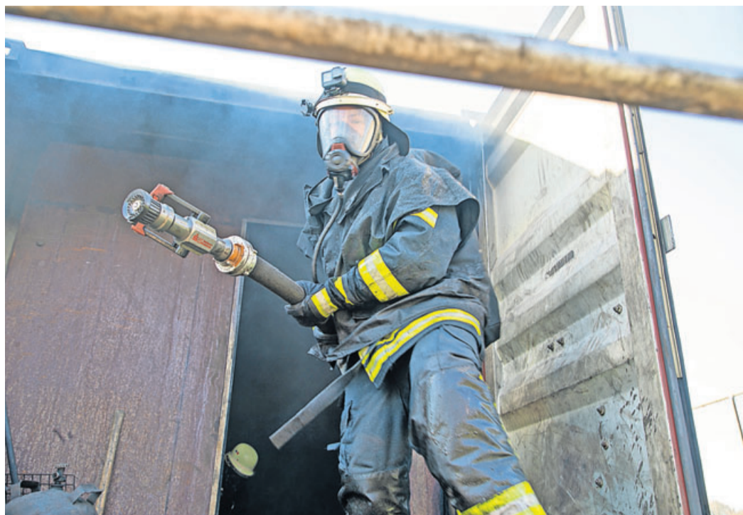
120 Atemschutzgeräteträger und -trägerinnen haben an den Übungen teilgenommen.

Insgesamt 120 Einsatzkräften absolvieren Realbrandausbildung