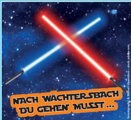
FAN-PROPS aus dem Star-Wars-Universum – von Fans für Fans