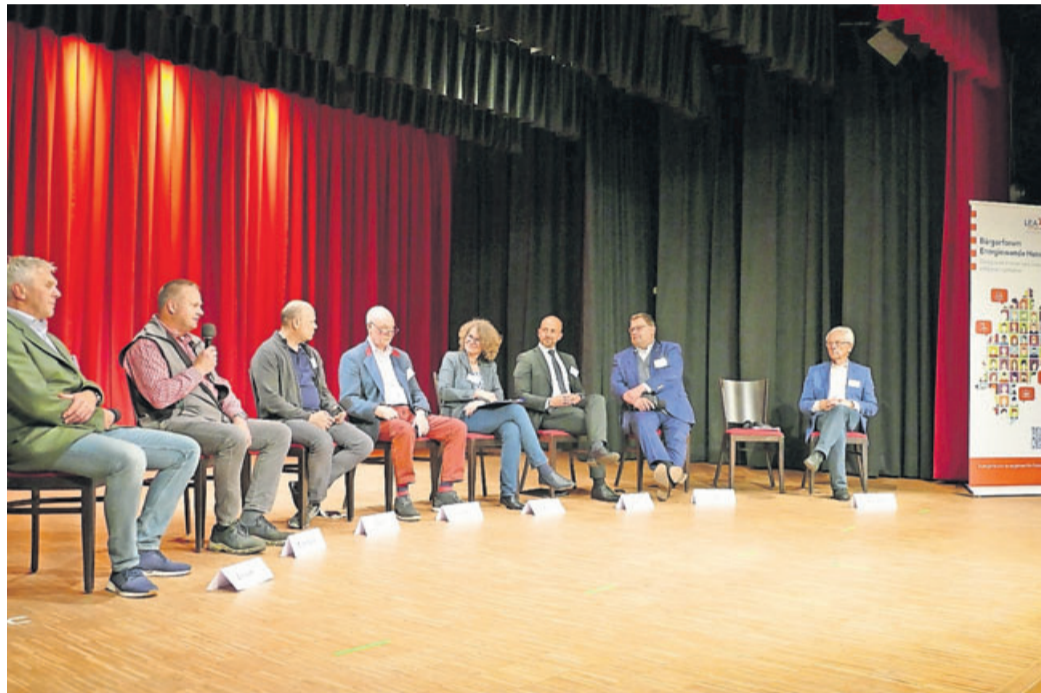
Die Podiumsrunde: Ein Stuhl war reserviert für Mitdiskutierende aus dem Publikum.

Gut 200 Interessierte in Bad Soden-Salmünster