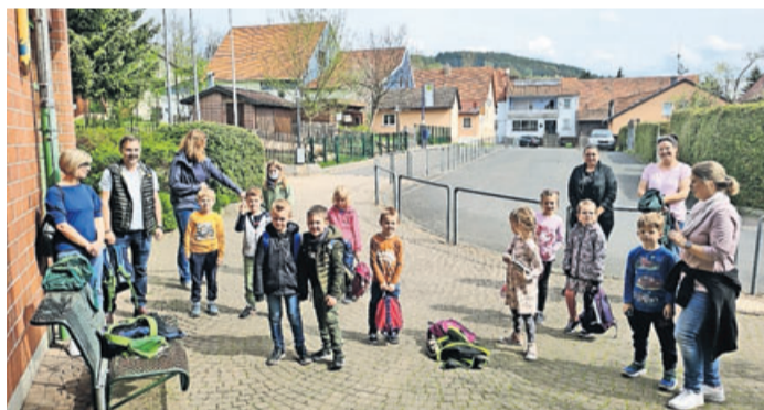
Voller Eindrücke wurden die Kinder nach zwei Stunden von ihren Eltern wieder in Empfang genommen.