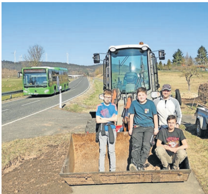
Die Jugendlichen leisten einen Beitrag zum Naturschutz.