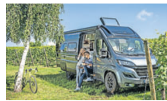
Das zulässige Gesamtgewicht des Campers darf nicht überschritten werden.