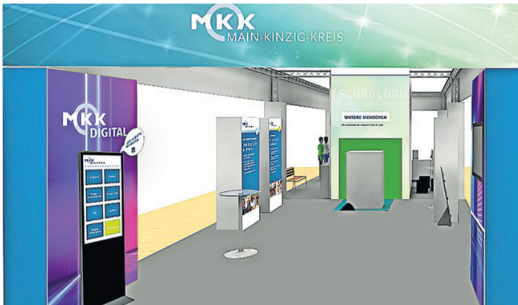
So wird der Messestand aussehen.

Die Besucher und Besucherinnen können sich je nach Bedarf über die Bereiche Energieversorgung, Gesundheit, Wirtschaft und Verwaltung, Bildung, Kultur, Soziales, Sicherheit sowie Tourismus informieren. In der Halle und auf einer Bühne finden zahlreiche Aktionen, Präsentationen und Diskussionen statt und die Gäste erfahren im direkten Dialog, was den Main-Kinzig-Kreis auszeichnet und ihn zu einem idealen Ort zum Leben und Arbeiten macht. Zudem wird unter der Titel „50 Jahre MKK“ ein Blick auf die Geschichte des bevölkerungsreichsten Landkreises in Hessen geworfen.