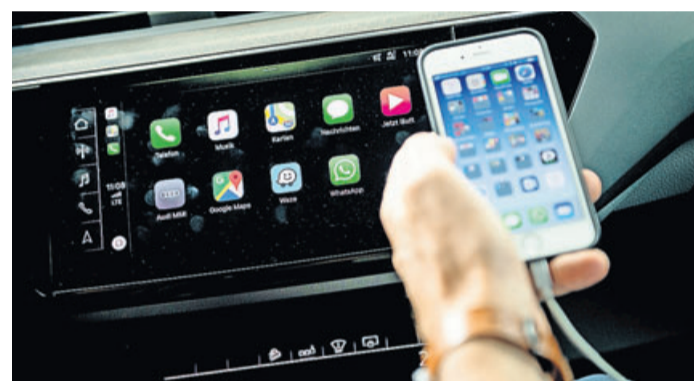
Voll vernetzt: Viele Funktionen in modernen Autos laufen über Apps – und brauchen dafür häufig auch persönliche Daten.