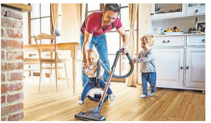
Besonders pflegeleicht: Der Boden sieht aus wie Holz, ist aber aus Kork.