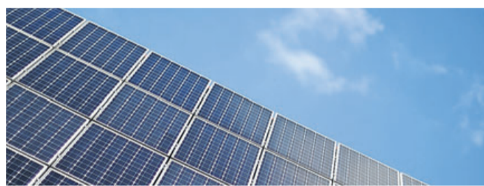
Photovoltaik-Anlage in Planung? Künftig könnte sich die volle Einspeisung des produzierten Stroms ins öffentliche Netz wieder etwas mehr lohnen.

Privatleute, die eine Photovoltaikanlage auf dem Dach haben, kennen die Rechnung vermutlich: Ins öffentliche Netz eingespeister Strom wird derzeit mit nur rund sechs Cent je Kilowattstunde (kWh) vergütet. Zugekaufter Strom vom Anbieter kostet