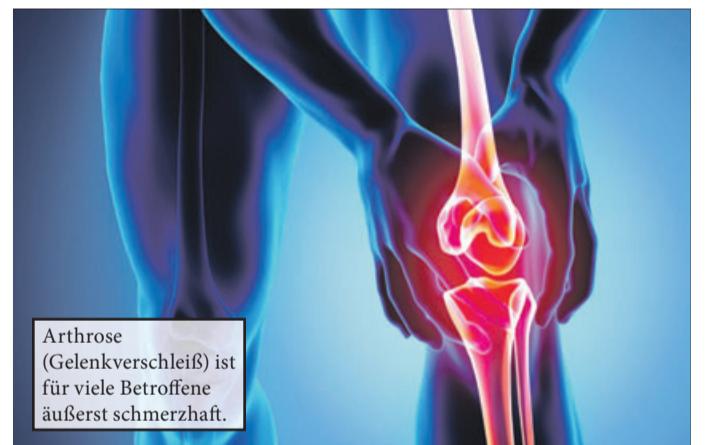
Arthrose (Gelenkverschleiß) ist für viele Betroffene äußerst schmerzhaft.