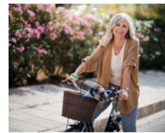
Bewegung macht nicht nur Spaß, sie stärkt auch die Knochen.

Eine kalziumreiche Ernährung ist für starke Knochen wichtig. Der Mineralstoff ist nicht nur in Milchprodukten enthalten, sondern auch in kalziumreichen Mine-