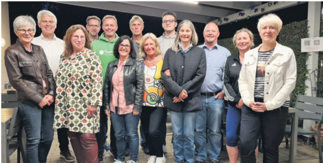
Das Vorstandsteam des Tennisclub Bad Soden-Salmünster.

Jahreshauptversammlung des Tennisclub Bad Soden-Salmünster – Verein zieht positives Resümee