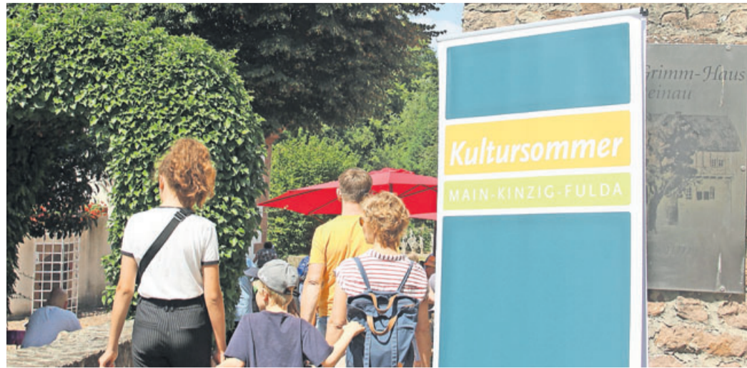
Der Kultursommer Main-Kinzig-Fulda hält insbesondere für die Kinder und Jugendliche zahlreiche Veranstaltungen und Mitmach-Angebote bereit.