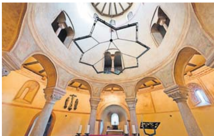
Blick in das Innere der Michaelskirche.

Fulda. Sie ist eine der ältesten Kirchen in Deutschland und feiert in diesem Jahr ihren 1200. Geburtstag; die Michaelskirche in Fulda. Sie wurde ab dem Jahr 820 von Abt Egil und dessen Nachfolger Rabanus Maurus als Begräbniskirche des Klosters Fulda errichtet und im Jahr 822 geweiht. Zwar hat sie durch die Jahrhunderte Zerstörungen und Umbauten erfahren, doch die Krypta mit der zentralen Christussäule ist vom ursprünglichen Bau erhalten.