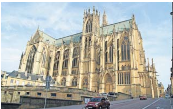
Cathédrale Saint Etienne.

Feier des zehnjährigen Jubiläums der Städtepartnerschaft Schlüchtern-Fameck