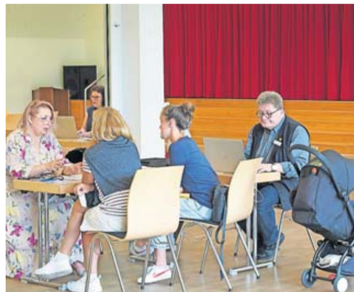
Zweiertteams aus Mitarbeitenden des KCA und der AQA beraten Vertriebene aus der Ukraine in einem „Erst-Assessment“ und beantworten Fragen rund um die Themen Arbeit und Ausbildung im Main-Kinzig-Kreis.

dann klappt das auch“, ist sie sich sicher. Schon in vielen Qualifizierungs- und Ausbildungsmaßnahmen der AQA waren in den vergangenen Jahren berufliche Bildung mit Deutschkursen eng verknüpft worden. Eine Herausforderung sieht die Erste Kreisbeigeordnete zudem in der Frage der Kinderbetreuung. Auch hier müssten flexible und möglichst schnelle Lösungen gefunden werden, um den ukrainischen Müttern den Zugang zum deutschen Arbeitsmarkt zu erleichtern. Dabei seien die Städte und Gemeinden schon mit viel Pragmatis-