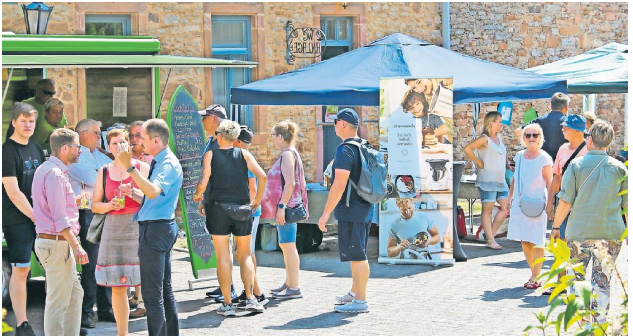
Die Besucher des „Dehaam“-Marktes trotzen den heißen Temperaturen.