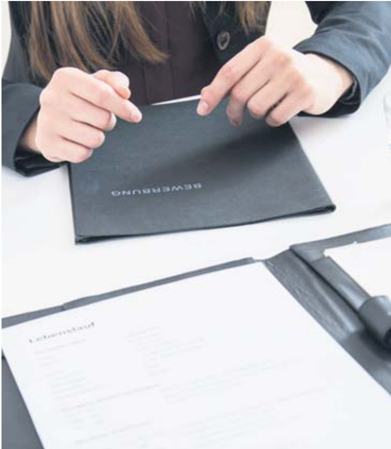
Gut vorbereitet sein: Ihre Selbstpräsentation für ein Vorstellungsgespräch sollten Bewerberinnen und Bewerber am besten mehrfach proben.