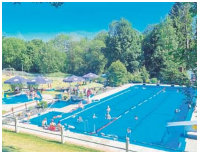
Das Freibad Hutten gilt als eines der gemütlichsten im Umkreis.

Interessant ist auch die Tatsache, dass in Schlüchtern ein ehemaliges Benediktinerkloster mit baugeschichtlichen Zeugnissen von 800 bis 1585 das Stadtbild mitprägt. Unter Abt Petrus Lotichius (1534-1567) wurde 1543 ein Gymnasium gegründet, das bis 1829 bestand. 1609 folgte die Aufhebung des Klosters durch die Grafen von Hanau. Seit 1947 dienen die alten Klostermauern als kirchenmusikalische Fortbildungsstätte und Ulrich-von-Hutten-Gymnasium (seit 1928). Eine Klosterführung ist sehr zu empfehlen. Ein weiteres markantes Bauwerk in Schlüchtern stellt