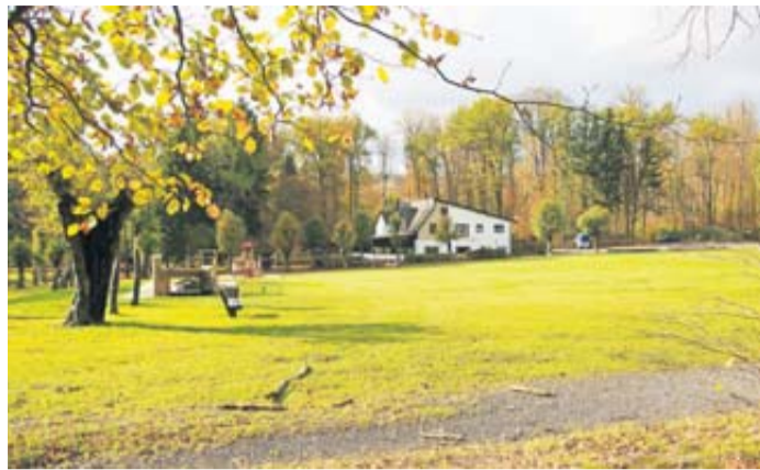
Der Acisbrunnen bietet zahlreiche Freizeitaktivitäten.

Stets einen Besuch oder einen kleinen Ausflug wert: der Luftkurort Schlüchtern mit seiner historischen Altstadt, die mit ihrer zauberhaften Atmosphäre zum Bummeln und Verweilen einlädt. An der ehemaligen Reichsstraße von Frankfurt nach Leipzig gelegen (Hanauer Straße/Unter den Linden/Obertorstraße/Fuldaer Straße), ist Schlüchtern die größte Gemeinde im oberen Kinzigtal. Im Jahr 933 ging die erste urkundliche Erwähnung als „sluohderin“ in die Geschichtsbücher ein. Die Verleihung der Stadtrechte erfolgte Mitte des 16. Jahrhunderts. Weitere markante Eckdaten in der Historie von Schlüchtern: Von 1975 bis 1995 wurde die Altstadt saniert. Ein kleiner „Stadtrundgang“ macht deutlich, was diese Stadt und ihren liebenswerten Charme im Besonderen ausmacht. Dazu zählt natürlich auch die Gastronomie, die ein sehr vielfältiges Angebot bereithält. In und um Schlüchtern gibt es viel zu erleben und zu entdecken. Es lohnt sich, einmal an einer Stadtführung teilzunehmen, um einen Überblick zu erhalten.