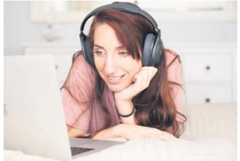
Lernen mit allen Sinnen: Wer bei der Wissenserweiterung verschiedene Techniken miteinander kombiniert, hat gute Chancen, den Stoff langfristig zu behalten.

dort ließe sich das Wissen gut entfalten, wenn bestimmte Sachverhalte abgefragt würden. In der Prüfung ist der Zettel natürlich tabu.