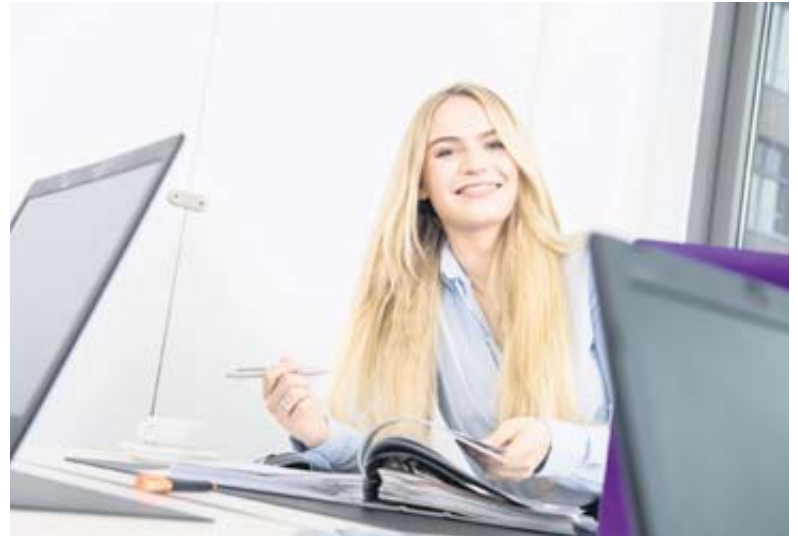
Was macht Sie einzigartig, und was können Sie besonders gut? Wer schaut, wo die eigenen Stärken und Schwächen liegen, kann sein berufliches Potenzial besser einschätzen.

Im letzten Schritt setzen Sie Stärken, Motivatoren und Bedürfnisse zu einem Gesamtbild zusammen. Dabei kann es laut Expertin Struss durchaus abstrakt zugehen: Wer als Leidenschaft „Kochen“ ausgemacht hat, kann daraus zum Beispiel Folgendes