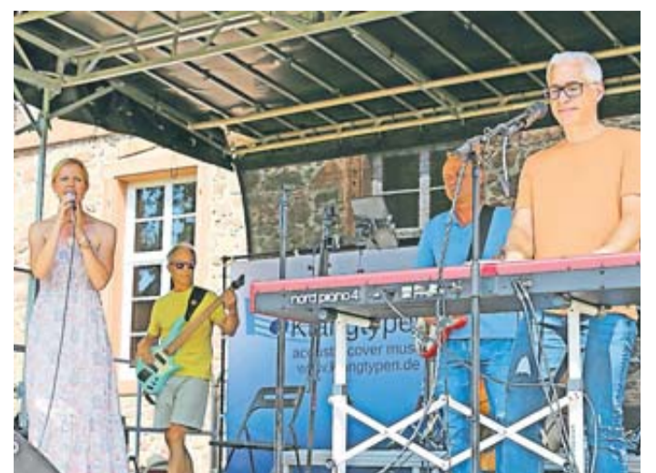
Die musikalische Untermalung durfte natürlich nicht fehlen.