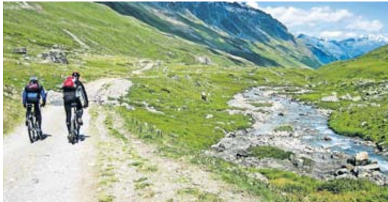
Mit dem eigenen Fahrrad bleiben Sie im Urlaub aktiv.

Fahrradträger für jeden Typ Vom Dachgepäckträger über Heckklappen-Fahrradträger bis hin zu einem Fahrradträger, der für die Anhängerkupplung geeignet ist: Die unterschiedlichen Modelle bieten Ihnen individuelle Lösungen. Lassen Sie sich vor dem Kauf von einem Fachmann beraten. Ganz nach Ihren Bedürfnissen und Anforderungen findet sich mit