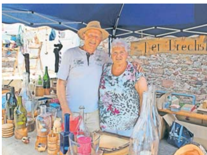
Kunsthandwerk aus der Region für die Region.

Schlendern und Bummeln direkt auf der Schlossparkwiese nieder und genoss das einmalige, herrschaftliche Flair und die gute Stimmung des Marktes.