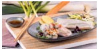
Leicht und lecker: Sommer-Roll Asia mit Friesenkroner Matjesfilet, Sprossen und Gemüse.

Piffige Rezepttipps finden sich unter www.friesenkroner.de sowie auf der Facebook-Seite.