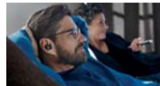
Sonova Consumer Hearing GmbH, Am Labor 1, 30900 Wedemark, Deutschland

Die TV Clear App führt Nutzer*innen intuitiv durch die Einstellungen, berücksichtigt die persönlichen Vorlieben und sorgt so für ein individuelles Hörerlebnis.