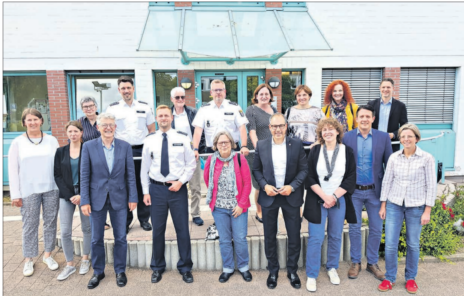
Der Präventionsrat der Stadt Eschborn trifft sich zu seiner Jubiläumsveranstaltung und hat für dieses Jahr einiges geplant.