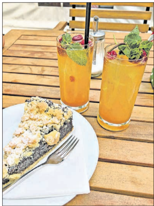
Eine hausgemachte Maracuja-Minz-Limo mit Himbeeren, dazu ein leckeres Stück Mohnstreusel – die Pause im „Schwyzer Hüsl“ bringt verbrauchte Energie zurück.

flächen zum Chillen zum Beispiel, sehenswerte Pflanzen, einen Basketballplatz, und auch ein sogenannter Soccer Cage, ein runder Fußball-Käfig zum Kicken, kann getestet werden. Für Fußball ist es heute zu warm, nächstes Ziel ist daher der 1907 errichtete Goldsteinturm, ein Aussichtsturm in Gestalt eines mittelalterlichen Wehrturms, von dem aus man bis zum Johannisberg blicken kann. Uns zieht die Sonne magisch an. Diesmal nicht die, die vom Himmel auf uns herab scheint, sondern die des Planetenwanderwegs, der nur ein paar Schritte vom Aussichtsturm entfernt beginnt.