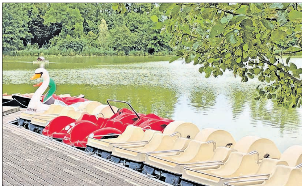
Elvis und Marilyn, ihres Zeichens Schwan und Ente, warten auf Ausflügler, die auf ihren Bänken Platz nehmen und eine Tretbootrunde auf dem Großen Weiher im Kurpark drehen.

flächen zum Chillen zum Beispiel, sehenswerte Pflanzen, einen Basketballplatz, und auch ein sogenannter Soccer Cage, ein runder Fußball-Käfig zum Kicken, kann getestet werden. Für Fußball ist es heute zu warm, nächstes Ziel ist daher der 1907 errichtete Goldsteinturm, ein Aussichtsturm in Gestalt eines mittelalterlichen Wehrturms, von dem aus man bis zum Johannisberg blicken kann. Uns zieht die Sonne magisch an. Diesmal nicht die, die vom Himmel auf uns herab scheint, sondern die des Planetenwanderwegs, der nur ein paar Schritte vom Aussichtsturm entfernt beginnt.