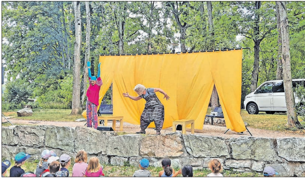
„Die Hase und der Igel“ präsentiert das Theater „Schreiber und Post“ im Rahmen des „Kindersommertimes“ und erntet viel Applaus.