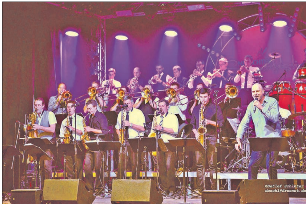
„Vorsicht Gebläse“ fackelt bei ihren Konzerten ein wahres Feuerwerk bekannter Hits aus Rock, Pop, Funk & Soul ab.

Eschborn (ew) . Zum Summertime-Abschluss am Mittwoch, 24. August um 19.30 Uhr spielen „Vorsicht Gebläse!“ im Süd-West-Park. Die Party-Bigband ist im wahrsten Sinne des Wortes eine „riesige“ Band. Bei ihren Konzerten fackeln die Musiker ein wahres Feuerwerk bekannter Hits aus Rock, Pop, Funk & Soul ab. Auf der Hitliste stehen Songs der 70er, 80er und 90er Jahre von Joe Cocker, Earth Wind & Fire, Tower of Power, Robbie Williams, Jan Delay oder Bruno Mars. Die lockere Art und die Professionalität mit der sich die fünf Sänger der Band präsentieren, lässt den Funken schnell auf das Publikum überspringen. Die 20-köpfige Bläsersection hinter der Rhythmusgruppe sorgt für einen unvergleichlichen Sound. So werden Gloria Estefans „Conga“ oder Jan Delays „Klar“ zu