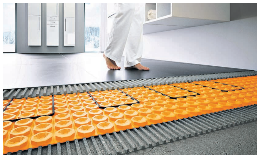
Mit einer elektrischen Boden- und Wandheizung können Flächen gezielt, schnell und energiesparend erwärmt werden.

(djd). Mit einer elektrischen Heizung lassen sich Boden- und Wandflächen schnell und effizient erwärmen - und das kostengünstig und komfortabel. Mit der Steuerung per Smartphone oder Tablet kann die Temperatur jederzeit individuell geregelt werden. Die Grundlage der elektrischen Boden- und Wandheizung Ditra-Heat-E von Schlüter Systems etwa bildet eine flach aufbauende Entkopplungsmatte, in der die Heizkabel verlegt werden, unmittelbar darüber die Fliesen oder Natursteinplatten. So macht sich das System die gute Wärmeleit- und Speicherfähigkeit dieser Materialien zunutze. Die milde Strahlungswärme der Flächenheizung kommt schnell und gleichmäßig an der Oberfläche an. Innerhalb von 15 Minuten wird eine Temperatursteigerung von bis zu vier Grad erreicht. Mehr Infos unter www.bekotec-therm.de .