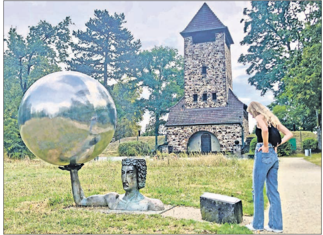
Schon von Weitem ist die glänzende Edelstahlkugel zu sehen, die Sonnengott Apollo auf seiner Hand balanciert. Mit der Sonne am Bad Nauheimer Goldsteinturm beginnt der Planetenwanderweg, der bis auf den Johannisberg führt und die Dimensionen des Sonnensystems anschaulich macht.

Nach einigen kräftigen Atemzügen Meeresluft schlendern wir weiter durch den Kurpark, vorbei an der Bücherei – angeblich eine der schönsten Deutschlands, untergebracht in einem 1901 im Gründerstil erbauten Fachwerkgebäude – und erreichen das Flüsschen Usa. Dort machen wir eine ganz besondere Bekanntheit. Auf der Brücke, die weiter in Richtung Dankeskirche führt, steht er – der King. Lässig lehnt er am Geländer, gekleidet in Uniform, der Blick in die Ferne schweifend. Seit August vergangenen Jahres steht der bronzenne Elvis Presley, der von 1958 bis 1960 in Bad Nauheim gelebt hat, dort und posiert geduldig für so manches Selfie. Nach Hessen gekommen war Elvis im Rahmen seiner Wehrpflicht in der US Army, die er in Friedberg ableistete. Weil ihnen Bad Homburg als schönster Ort der Region empfohlen worden war, bezogen er und seine Familie zunächst Quartier im dortigen Ritters Park Hotel. Doch der Weg nach Friedberg erwies sich schnell als zu weit. Bad Nauheim wurde als Wohnort gewählt. Nach einem Aufenthalt im Hilberts Parkhotel, das 1989 abgerissen wurde, zogen die Presleys ins Hotel Grunewald um. Doch schnell kam es zu Reibereien: Der Hotelinhaber beklagte Ruhestörungen durch laute Musik und die ständige Belagerung durch Fans. Elvis mietete schließlich ein Haus in der Goethestraße an, in dem die Familie gut ein Jahr