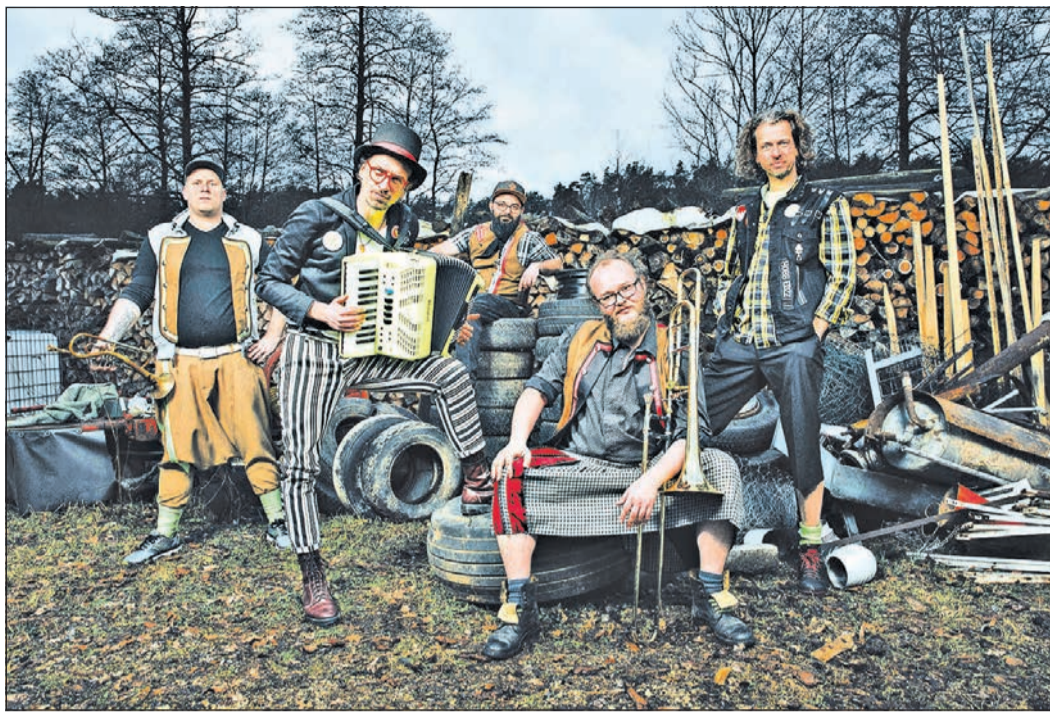
Am Freitag in der Ziegelei dabei: „Kellerkommando“.