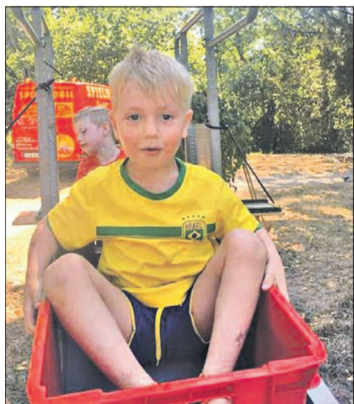
Auch für die Kleineren gibt es altersgerechte Spielmöglichkeiten.

Am Samstag eröffnete Günter Pabst in Abwesenheit des Vorsitzenden Dieter Kunze das Eichendorffweiherfest, das endlich wieder stattfinden konnte. 2019 musste es aufgrund schlechter Witterungsbedingungen abgesagt werden, und 2020 und 2021 verhinderte Corona die Durchführung.