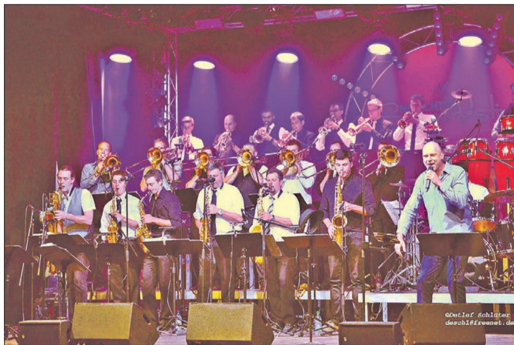
„Vorsicht Gebläse“ fackelt bei ihren Konzerten ein wahres Feuerwerk bekannter Hits aus Rock, Pop, Funk & Soul ab.

Eschborn (ew) . Zum Summertime-Abschluss am Mittwoch, 24. August um 19.30 Uhr spielen „Vorsicht Gebläse!“ im Süd-West-Park. Die Party-Bigband ist im wahrsten Sinne des Wortes eine „riesige“ Band. Bei ihren Konzerten fackeln die Musiker ein wahres Feuerwerk bekannter Hits aus Rock, Pop, Funk & Soul ab. Auf der Hitliste stehen Songs der 70er, 80er und 90er Jahre von Joe Cocker, Earth Wind & Fire, Tower of Power, Robbie Williams, Jan Delay oder Bruno Mars. Die lockere Art und die Professionalität mit der sich die fünf Sänger der Band präsentieren, lässt den Funken schnell auf das Publikum überspringen. Die 20-köpfige Bläsersection hinter der Rhythmusgruppe sorgt für einen unvergleichlichen Sound. So werden Gloria Estefans „Conga“ oder Jan Delays „Klar“ zu