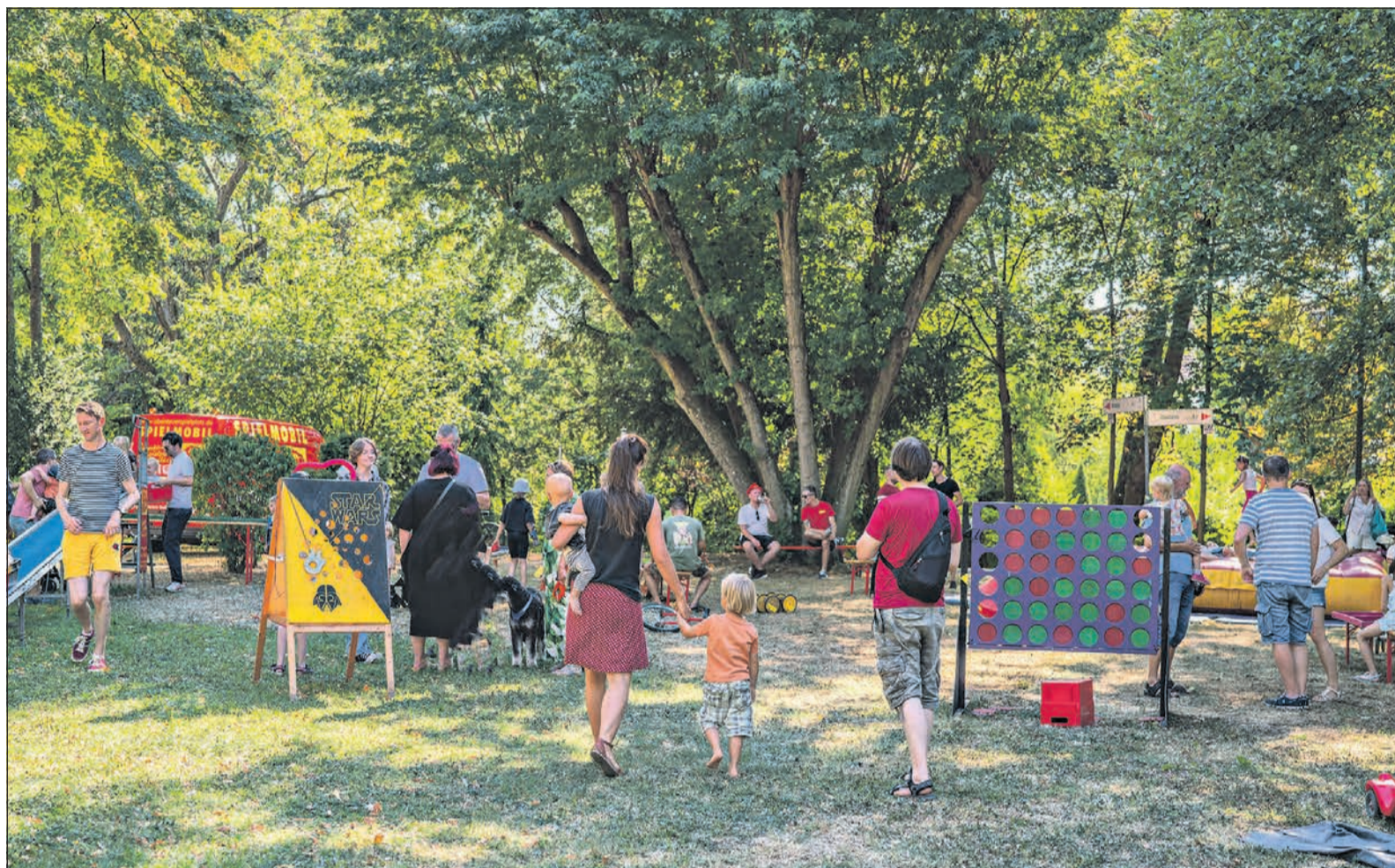
Dass die Schwalbacher und auch Gäste aus den umliegenden Gemeinden dieses Fest besonders lieben, zeigt sich am zahlreichen Besuch von Jung und Alt.