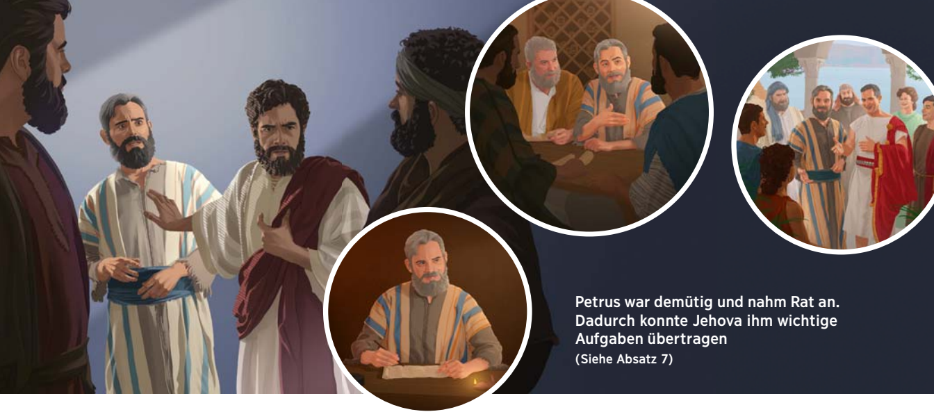
Petrus war demütig und nahm Rat an. Dadurch konnte Jehova ihm wichtige Aufgaben übertragen (Siehe Absatz 7)

oder zu streng behandelt worden. Uns könnte dann etwas Wertvolles entgehen: wahrzunehmen, dass Zurechtweisung ein Ausdruck der Liebe Jehovas ist. ( Lies Hebräer 12:5, 6, 11. ) Wenn wir uns von unseren Gefühlen beherrschen lassen, kann Satan das außerdem ausnutzen. Er möchte, dass wir Zurechtweisung ignorieren und – schlimmer noch – uns von Jehova und der Versammlung distanzieren. Wie kannst du bei klarem Verstand bleiben, wenn du korrigiert wirst?