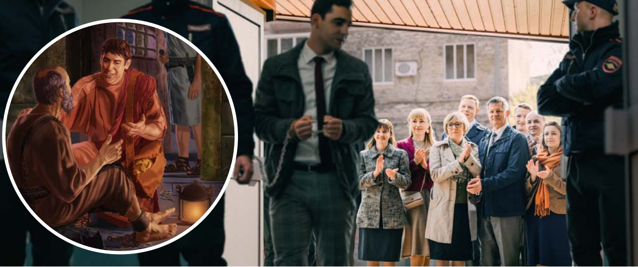
Als Paulus in Ketten lag, unterstützte ihn Onesiphorus mutig. Auch wir stehen unseren Brüdern bei, wenn sie verhaftet werden, wie diese nachgestellte Szene zeigt (Siehe Absatz 11, 12)