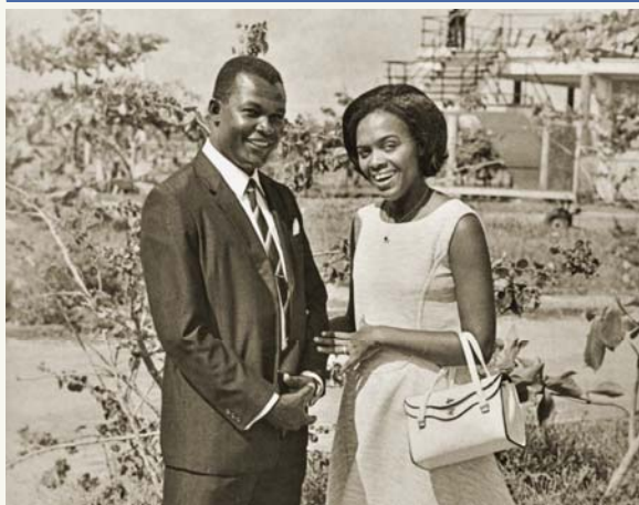
Bei unserer Hochzeit im September 1971