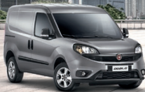
FIAT DOBLÒ CARGO