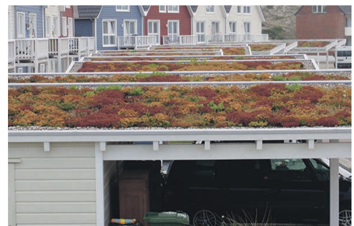
Die Dächer beispielsweise von Carports sind prädestiniert für eine Begrünung.

Besonders attraktiv ist eine Kombination von Dachbegrünung und Solarnutzung, denn durch den Kühleffekt der Vegetation steigt der Stromertrag. „Auch die Artenvielfalt von Insekten und anderen Kleinlebewesen kann durch eine Solaranlage auf einem begrüntem Dach weiter gefördert werden, weil die Solarmodule abwechslungsreichere Licht-, Schatten- und Feuchtigkeitsverhältnisse schaffen“, so Baumhauer.