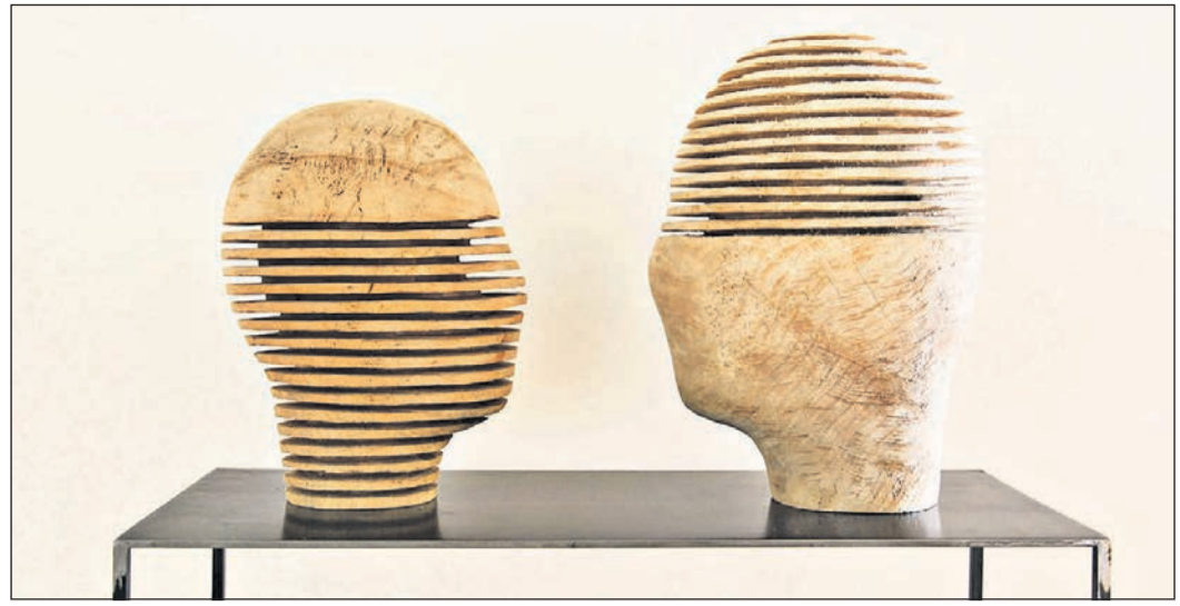
Kunstwerk von Alfred Haberpointner, „K – TZZ“: Gezeigt wird es derzeit in der Galerie Scheffel (courtesy Galerie Scheffel & Künstler). Foto: Archiv Galerie Scheffel