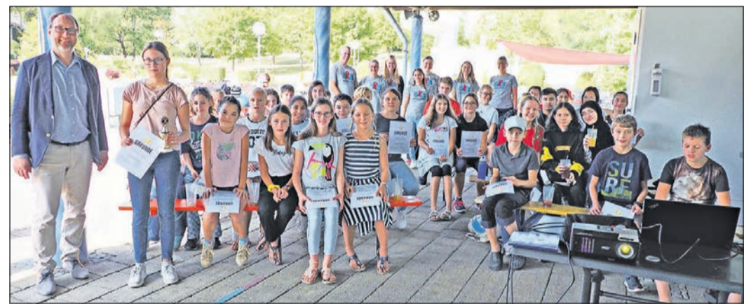
51 Teilnehmer haben im Sommerleseclub der Stadtbücherei mitgemacht. Jeder von ihnen hat mindestens drei Bücher gelesen und bewertet.