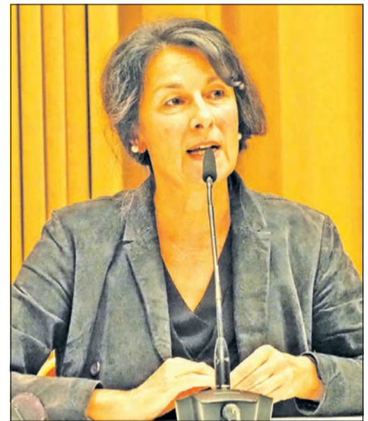
Zsuzsa Bánk liest aus ihrem Bestseller „Sterben im Sommer“ auf Einladung des Hospiz-Dienstes im Kurhaus.

„Irgendwann ist der Tod deutlicher als das Leben, [...] das Leben weicht dem Tod.“ Dort, in Höchst, findet ein wunderbar erfülltes Leben sein Ende. Es sind die heißesten Tage des