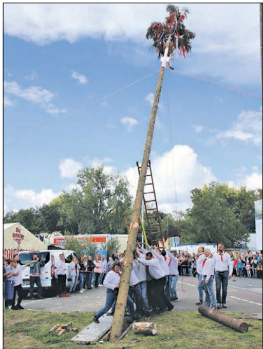
Die Kerbeburschen brauchen nicht lange, bis der mächtige Kerbebaum vor zahlreichen Zuschauern aufgestellt ist.

Der Montag begann mit dem traditionellen Frühschoppen, bei dem die Blaskapelle aus Langen-Brombach aufspielte. Der Gickelschmiss und die Verleihung des Bachrechts durften ebenso nicht fehlen. Außerdem gab es ein Ratespiel der Kerbeburschen. Abends stand Live-Musik mit dem Duo „No Filter“ im Programm. Um 22 Uhr läutete das Verbrennen der Kerbelies schließlich das Ende des Jubiläumsfestes ein.