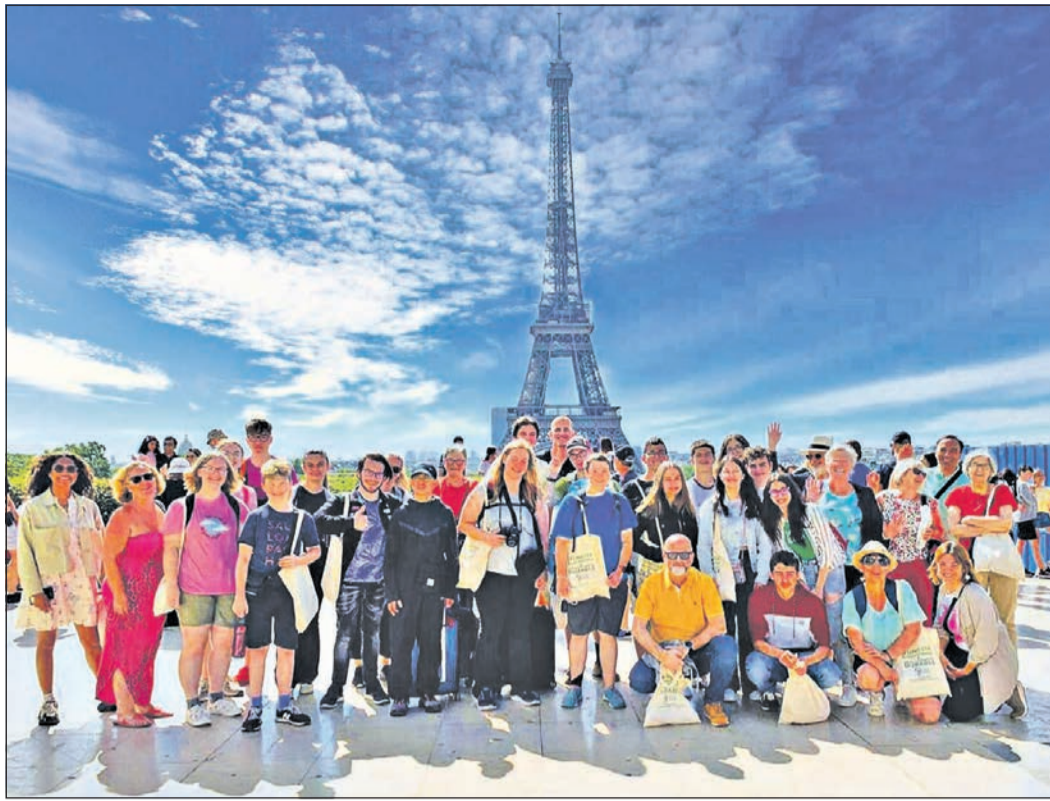
Natürlich darf beim Sightseeing der Friedrichsdorfer Jugendvertretung in Paris mit Jugendlichen aus anderen Ländern ein Bummel zum Eiffelturm nicht fehlen.