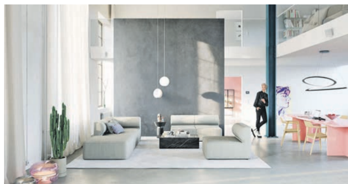
Lust auf mehr Großzügigkeit: Loftartige Räume verwöhnen die Bewohner mit viel Platz und gleichzeitig viel Behaglichkeit.

Ein Malerfachbetrieb hat schon in der Planungsphase beraten und kreative Ideen vorgeschlagen. Dank der professionellen Ausführung des Malerbetriebs mit hochwertigen Produkten wie von Brillux entstand ein einladendes Loft mit offenem Wohnkonzept. Mehr Inspirationen gibt es etwa unter www.brillux.de/zuhause . Hier sind ebenfalls passende Kontakte von Fachhandwerkern vor Ort zu finden.