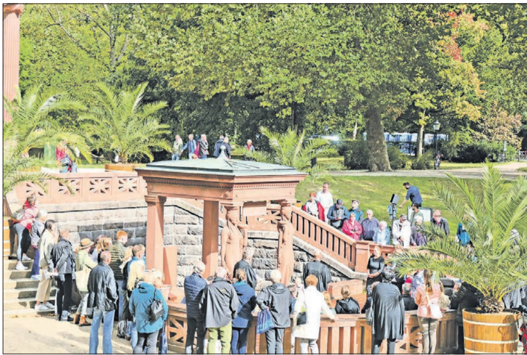
Wie hier am Elisabethenbrunnen an der Brunnenallee taufen Gemeindepfarrer und -pfarrerinnen beim ersten Tauffest des Evangelischen Dekanats Hochtaunus im Bad Homburger Kurpark insgesamt 42 Kinder vom Säuglingsalter bis zwölf Jahren, und die Familien, Paten und Freunde feiern gemeinsam mit ihren Täuflingen.