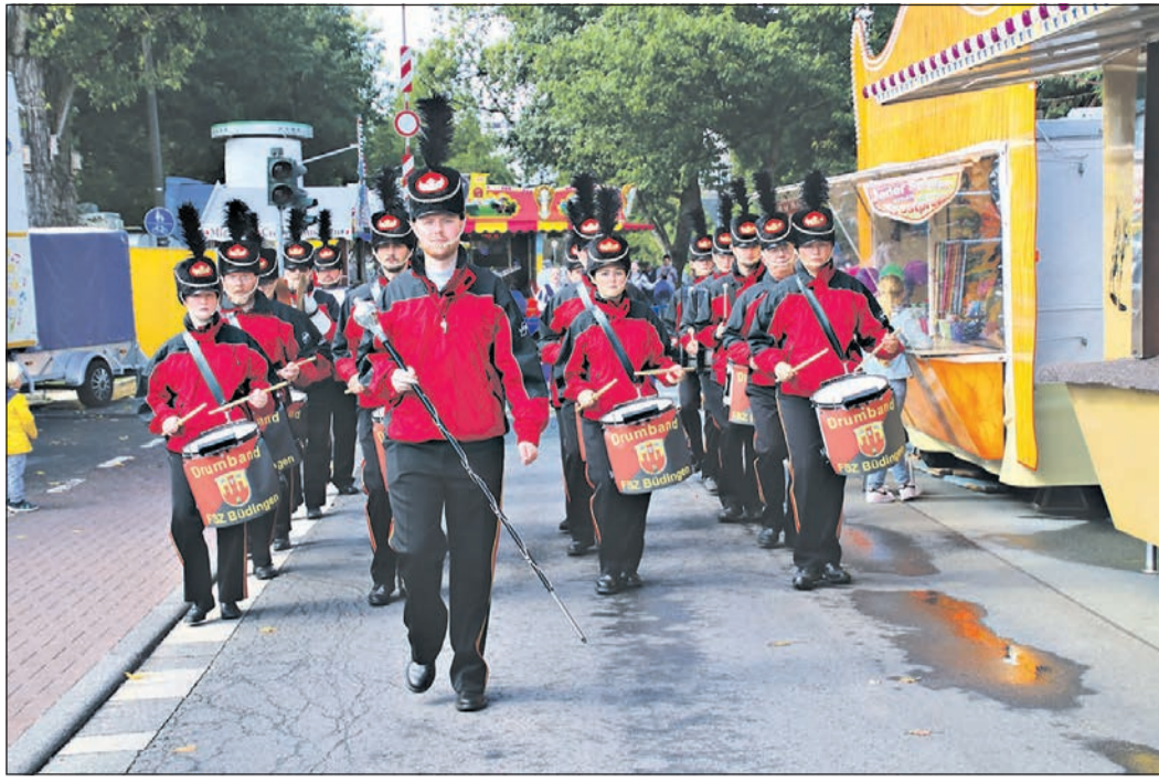
Die Drumband „FSZ Büdingen“ führt den Festumzug durch Ober-Eschbach an.