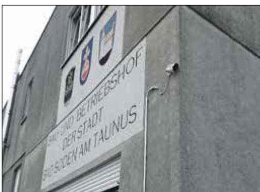
Insgesamt vier Kameras wurden auf dem Gelände des städtischen Bau- und Betriebshofs zur Einbruchabschreckung installiert.

Bad Soden (bs) – Der städtische Bau- und Betriebshof in der Hunsrückstraße wird neu-