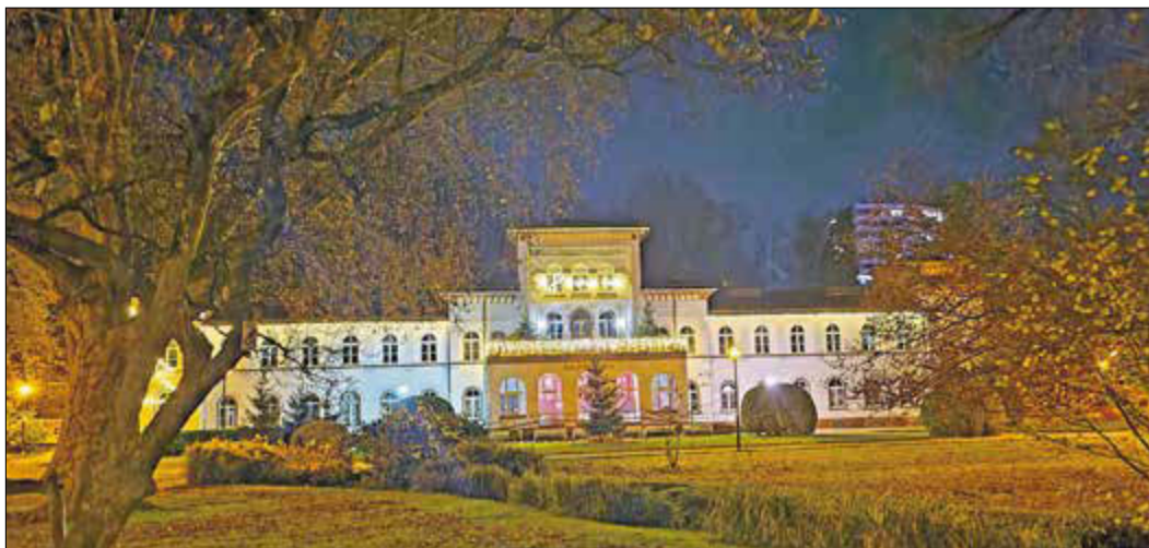
Die Bad Sodener Weihnachtsbeleuchtung aus dem vergangenen Jahr.