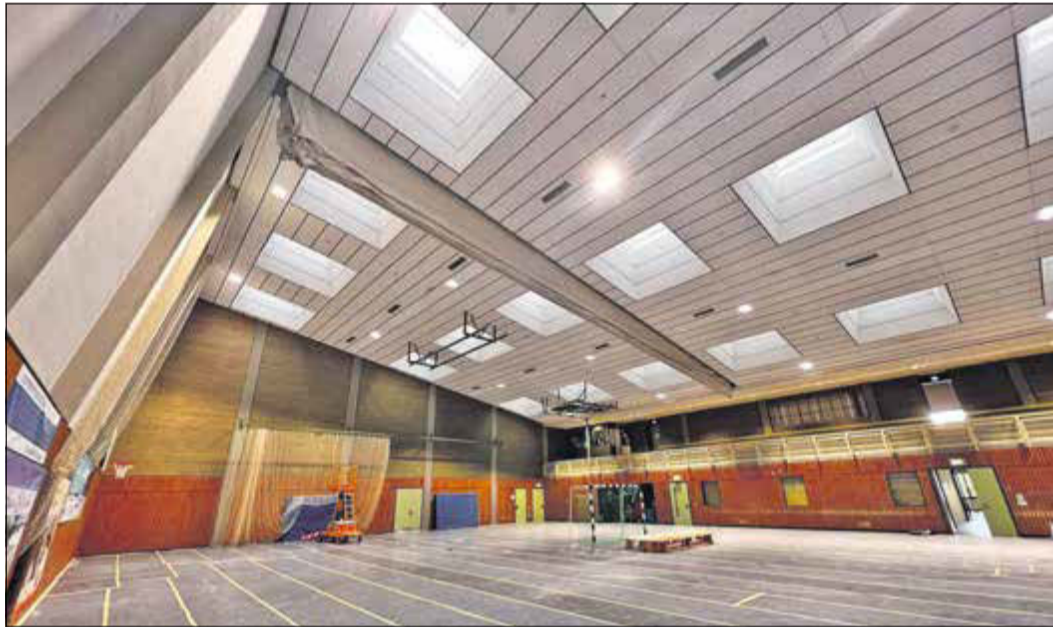
Hell und modern ist jetzt die Ausleuchtung in der Kahlbachhalle.

Bad Soden (bs) – Die Sporttreibenden in der Altenhainer Kahlbachhalle können sich ab sofort über nahezu optimale Lichtverhältnisse freuen. Rechtzeitig zum Ende der Sommerferien und zu Beginn der Schulzeit war der Austausch der Beleuchtung abgeschlossen. Die Halle verfügt nun über eine Beleuchtung mit Leuchtdioden (LED), die sich mit einem Steuerungselement je nach Anforderung dimmen lassen. So wird es nun auch keine dunklen Ecken in der Kahlbachhalle geben, denn in jedem Hallendrittel sind Lichtsensoren angebracht. Dadurch werden unter Berücksichtigung der äußeren Lichtverhältnisse konstante lichtstarke 500 Lux erreicht. Sogar die Tribünen werden nun – unabhängig vom Hallenbereich – mit den LEDs ausgeleuchtet. Die Sporttreibenden werden also auf jeden Fall eine Verbesserung gegenüber der bisherigen Lichtanlage, die aus dem Jahr 1984 stammte, feststellen. Zudem ist die neue