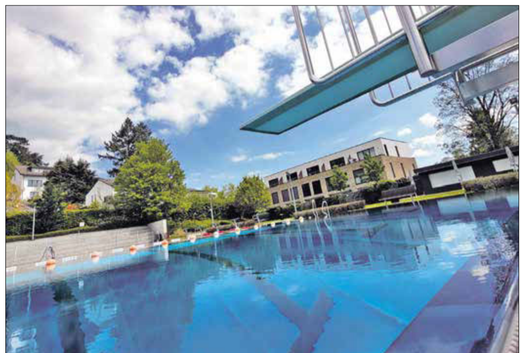
Nun ist es wieder ruhig im Freibad bis zur nächsten Saison.