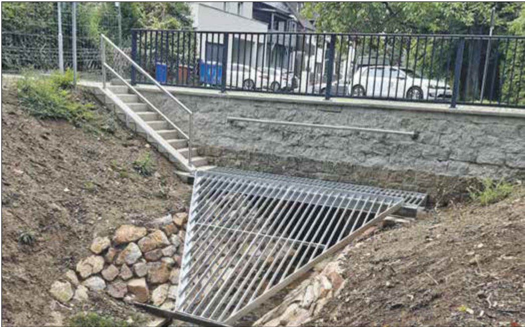
Mit dem Neubau der Rechenanlage und der Errichtung eines Geröllfangs sind zwei weitere Maßnahmen zum Hochwasserschutz in Bad Soden abgeschlossen.

Bad Soden (bs) – Der Neubau der Rechenanlage in der hinteren Dachbergstraße am Sulzbach und die Errichtung eines neuen Geröllfangs in diesem Bereich sind abgeschlossen. Die Bauzeit der Maßnahme dauerte vom 5. Juli bis 9. September 2022. In diese Hochwasserschutzmaßnahmen hat die Stadtverwaltung 145.000 Euro investiert. Der Starkregen am 14. August 2020 mit der Überflutung des Freibads in der Kelkheimer Straße hatte gezeigt, dass die alte Rechen-