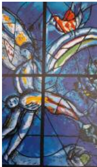
Chagall-Fenster in Mainz (s. S.10)

ACHTUNG: Redaktionsschluss in der nächsten Woche ist wegen des Feier- tags Fronleichnam bereits am MONTAG, 13. Juni, pünktlich um 17 Uhr – bitte daran denken! Vielen Dank!