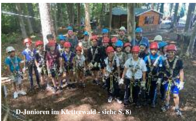
D-Junioren im Kletterwald - siehe S. 8)