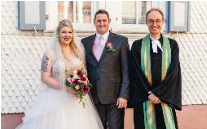
Hochzeit Krämer - Ev. Kirchengemeinde Birstein