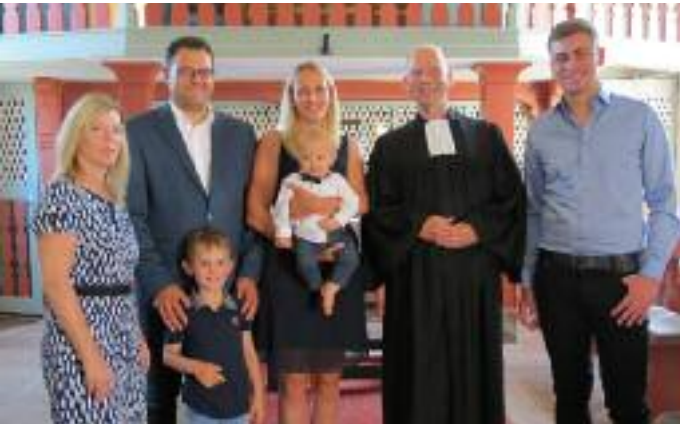
Weil die Fotos bunt bleiben sollten, nicht auf den "Kirchenseiten", sondern an dieser Stelle - Texte auf Seite 14!