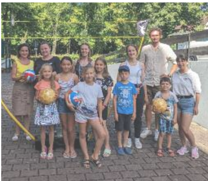
Foto unten: Sportgeräte für ukrainische Kinder gespendet - Artikel auf Seite 12

Über die vielen Glückwünsche und Geschenke anlässlich unserer