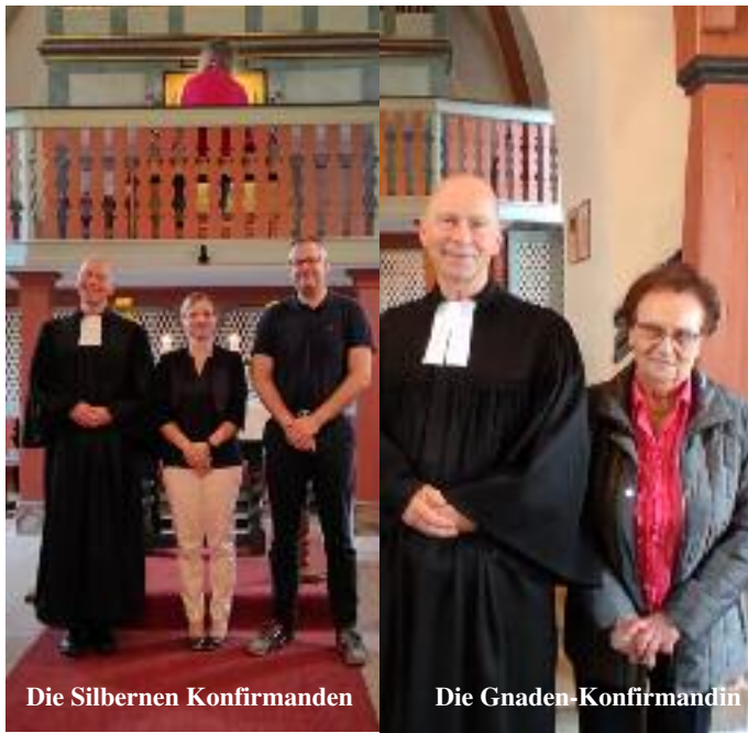
Die Silbernen Konfirmanden

In der Nikolauskirche Kirchbracht feierten am 18. September 2022 in zwei Gottesdiensten das Jubiläum der Konfirmation gefeiert: Für Silberne sind 25 Jahre, für Goldene 50 Jahre, für Diamantene 60 Jahre, für Eisernen 65 Jahre, für Gnadenkonfirmation 70 Jahre und und Kronjuwelenkonfirmation 75 Jahre seit ihrer Konfirmation vergangen.