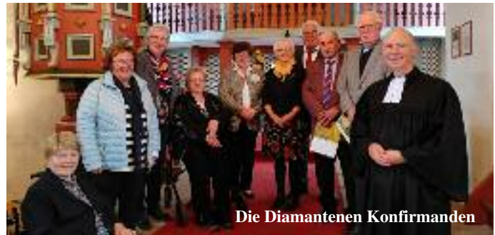
Die Diamantenen Konfirmanden