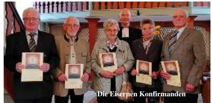
Die Eisernen Konfirmanden