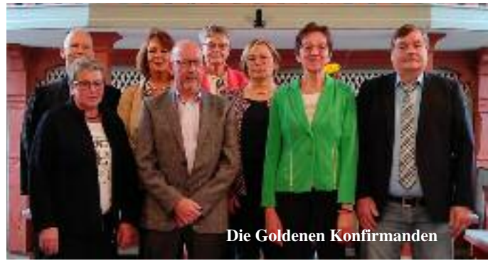
Die Goldenen Konfirmanden