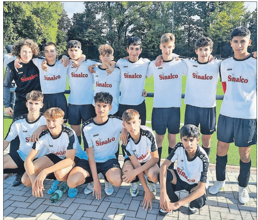
Die Fußballer der Wettkampfklasse II der Heinrich-von-Kleist-Schule haben sich für den Regionalscheid bei „Jugend trainiert für Olympia“ qualifiziert.