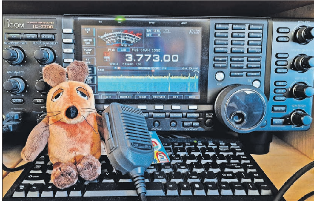
Mit ihrer Einladung „Türen auf mit der Maus – spannende Begegnungen“ haben die Funkamateure Interesse geweckt.