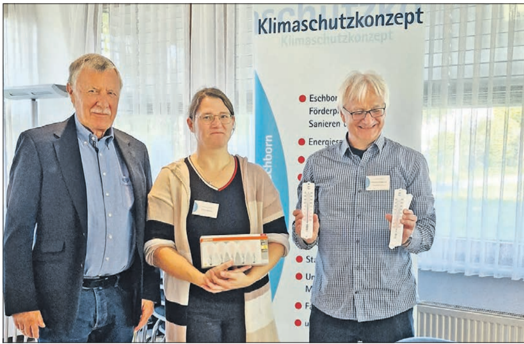
Tipps zum Energiesparen werden den Gästen beim Seniorenfrühstück gegeben. Weitere Termine für den „EnergieSpar-Check“ gibt es für Senioren ab kommendem Montag.