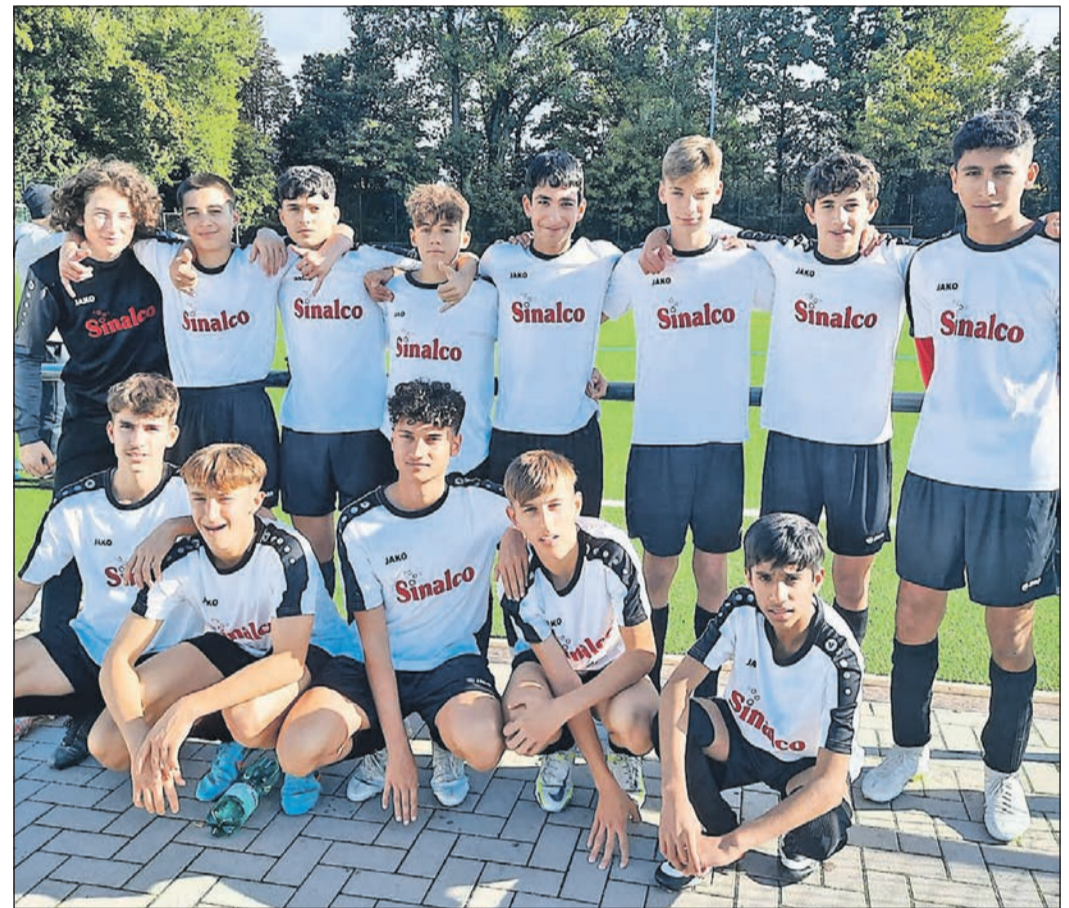
Die Fußballer der Wettkampfklasse II der Heinrich-von-Kleist-Schule haben sich für den Regionalscheid bei „Jugend trainiert für Olympia“ qualifiziert.