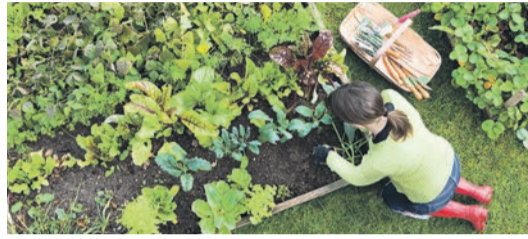
Frischer und regionaler geht es nicht: Gemüse aus dem eigenen Garten.

(djd). In Deutschland ist 2022 vieles teurer geworden: vor allem Energie, aber auch Lebensmittel. Gerade bei Nahrungsmitteln können die Menschen aber gegensteuern, etwa durch den eigenen Anbau von Gemüse. Anfänger sollten sich im Vorfeld gut informieren, wie der Garten für den Gemüseanbau beschaffen sein muss und welches Timing man in Sachen Aussaat und Ernte beachten muss. Selbstversorgerboxen mit ausgewähltem Saatgut, wie es sie in verschiedenen Ausführungen beispielsweise von Saatgut Dillmann gibt, können deshalb nicht nur für Anfänger eine schöne Geschenkidee zu Weihnachten sein. Die Boxen sind in der naturbelassenen Version mit 32 Sämereien, in der Biovariante mit 22 Sämereien sowie 14 in der Balkon- und Terrassenausführung unter www.saatgut-dillmann.de erhältlich.