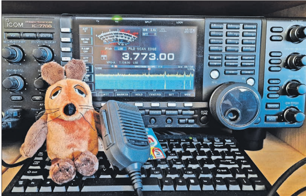
Mit ihrer Einladung „Türen auf mit der Maus – spannende Begegnungen“ haben die Funkamateure Interesse geweckt.

zuletzt ihm ist es zu verdanken, dass die HvK schon seit 2013 „als Umweltschule des Landes Hessen“ zertifiziert ist, das letzte Rezertifizierungsverfahren konnte im vergangenen Jahr erfolgreich abgeschlossen werden. Beim ersten Treffen der neuen Umweltscouts sammelten die Schüler zunächst Ideen, was die Schüler und ihre Lehrer konkret tun können. Die Gruppe entschied sich, das Thema „Nachhaltigkeit im Klassenraum“ besonders in den Blick zu nehmen. Hierbei wollen sich die jungen Umweltschützer um die Mülltrennung kümmern und ihre Mitschüler über das richtige Lüften informieren. Schulleiter Heimann ist beeindruckt vom Engagement seiner Fünftklässler. „Gerade die Entwicklung in den vergangenen Wochen führt uns noch einmal sehr eindringlich vor Augen, wie wichtig die Aktivitäten der Umweltscouts sind. Auch wir als Schule wollen mit unseren verschiedenen Maßnahmen unseren Beitrag für Umweltschutz und Nachhaltigkeit leisten.“