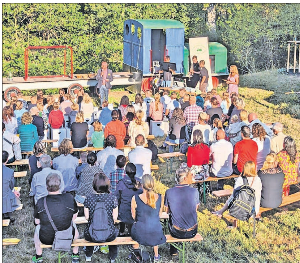
Für viele Kinder und Eltern startet die Einschulung mit einem Gottesdienst auf dem Abenteuerspielplatz.

„Ein Koffer voll mit Büchern“ ist Teil eines umfassenden Maßnahmenpakets, für welches das Auswärtige Amt Mittel aus dem Ergänzungshaushalt zur Abmilderung der Folgen des russischen Angriffskrieges gegen die Ukraine bereitstellt.