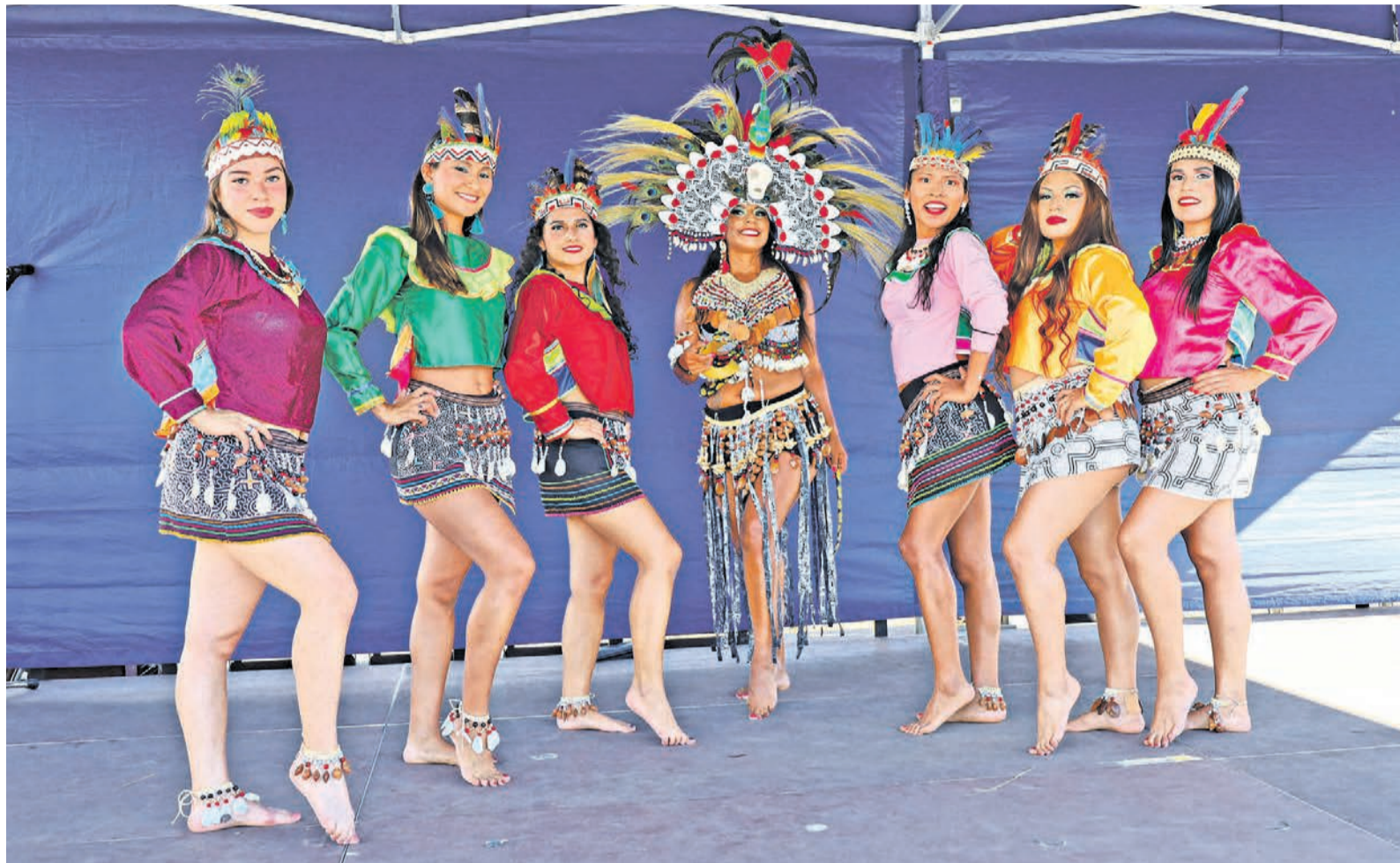
Einen Hauch von Exotik bringt das peruanische Tanzensemble „Amazonia“ – nicht nur durch seine bunten Trachten – auf den Marktplatz. Die Tänzerinnen nehmen auch mit ihren beschwingten Rhythmen das Publikum mit.