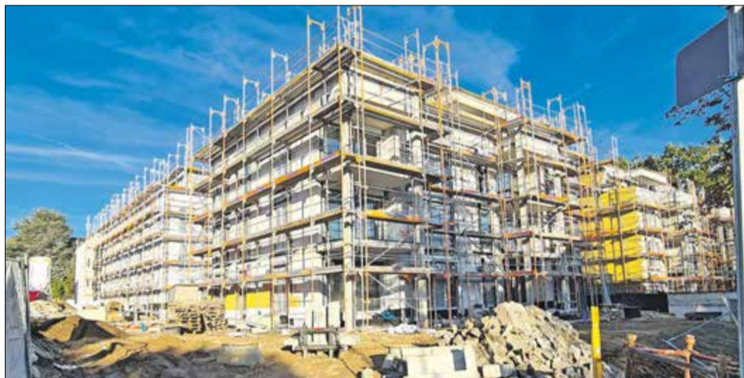
In der Kronberger Straße entstehen auf dem ehemaligen Reitplatz 22 städtisch geförderte Wohnungen für Menschen in sozialen Berufen.

Bad Soden (bs) – Interessierte können sich ab sofort für eine der insgesamt 22 Belegwohnungen bewerben, die derzeit auf dem Gelände des ehemaligen Reitplatzes an der Kronberger Straße 26 entstehen. Bewerbungsschluss hierfür ist der 31. Oktober . Die Wohnungen sollen ab dem 1. März 2023 über die Horn Projektgesellschaft GmbH aus Kelkheim vermietet werden. Die Belegung erfolgt durch die Stadt Bad Soden. Bewerben können sich alle, die haupt- oder ehrenamtliche Dienst- oder Arbeitsverhältnisse in den Bereichen Erziehung und Pädagogik, Kranken- und Altenpflege, Rettungsdienst, Feuerwehr oder Polizeidienst ausführen. Weitere Kriterien wie Alleinerziehende, Kinder unter 14 Jahren und die Ortsansässigkeit werden ebenfalls berücksichtigt.