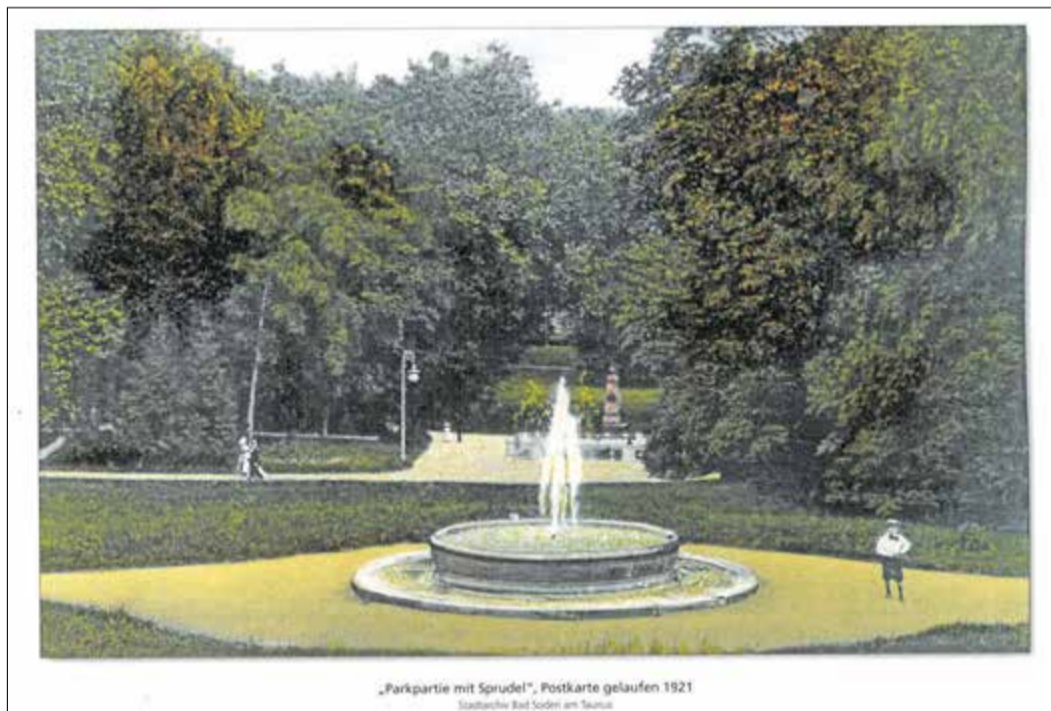
Zwölf Motive plus Titelseite zeigen historische Aufnahmen aus Bad Soden am Taunus, Neuenhain und Altenhain.

Bad Soden (bs) – Der Historische Kalender 2023 mit Motiven aus Bad Soden am Taunus, Neuenhain und Altenhain ist ab sofort im Stadtmuseum, der Stadtbücherei und im Bürgerbüro für 10 Euro erhältlich. Darüber hinaus wird er in der Buchhandlung Boris Riege und der Zeitungsentente in der Kernstadt sowie im Kiosk Marinschag in Neuenhain verkauft. In Kooperation mit dem Stadtarchiv hat der Heimatgeschichts-Verein Neuenhain e.V. den in limitierter Auflage erschienenen Kalender herausgegeben, der 13 ganz unterschiedliche historische Motive aus dem gesamten Stadtgebiet zeigt. Von einer Darstellung des „Kerwe-