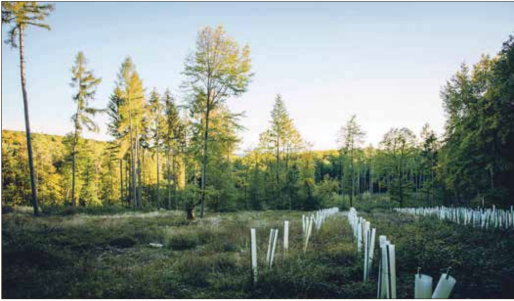
Der viel zu trockene Waldboden macht es den neu gepflanzten Bäumchen schwer.