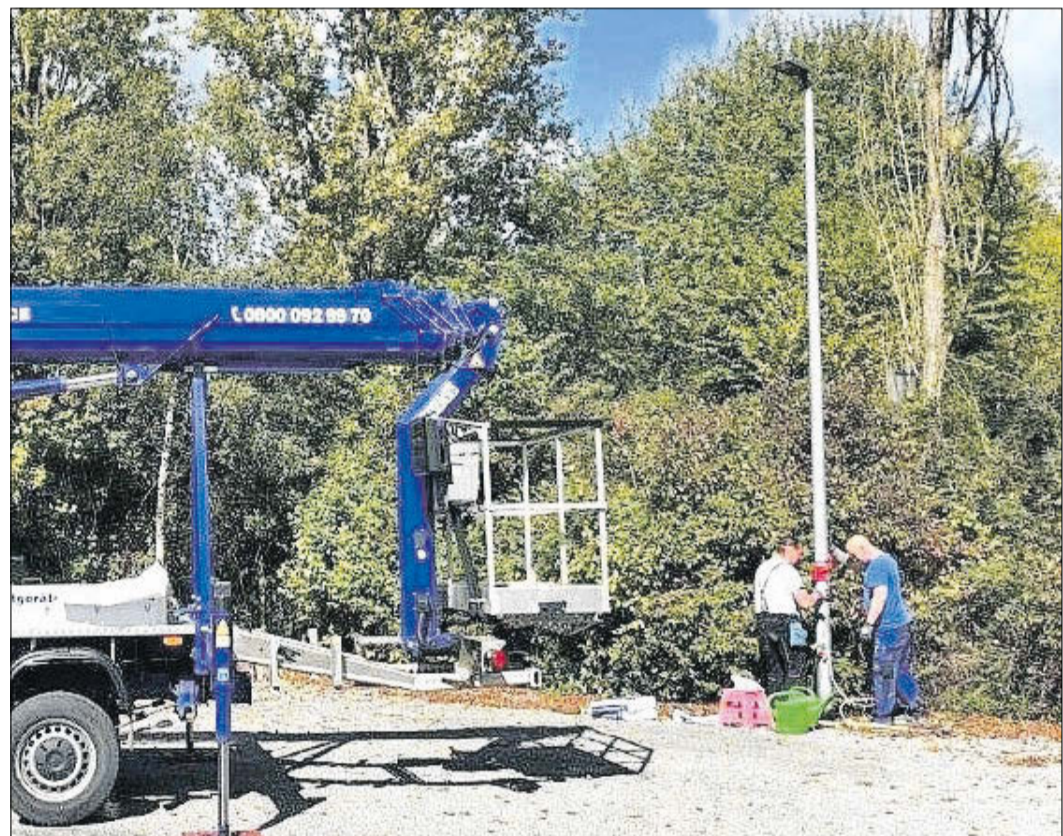
Installation der Beleuchtung auf dem neuen Schotterparkplatz

Bad Soden (bs) – Nicht nur, dass der Parkplatz vor der Altenhainer Kahlbachhalle mit seinen 24 Stellflächen bei größeren Veranstaltungen restlos zugestellt wird. Autohalter parken sogar „wild“ an der Straße und auf Wegen in der Nachbarschaft. Abhilfe schafft demnächst ein nach oben in Richtung Bundesstraße angrenzender geschotterter Parkplatz für zusätzliche 29 Fahrzeuge. Die knapp 900 Quadratmeter große Fläche ist so gut wie fertiggestellt, derzeit fehlen wegen Lieferengpässen noch die Palisaden zur Begrenzung bzw. Markierungen und Schilder. Aushub und Schotterung hatten im Mai begonnen; im November soll der Parkplatz dann endgültig fertig sein. Warum wird die Fläche nicht asphaltiert? Das liegt am entsprechenden Bebauungsplan, in dem dieses Areal als nicht überbaubare Grundstücksfläche ausgewiesen