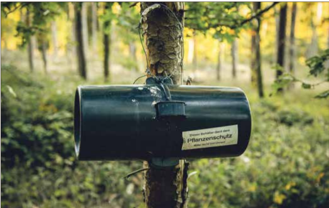
Die Borkenkäferfalle als „Pflanzenschutz“.

„Zudem kann ich unseren Bürgerinnen und Bürgern das Signal geben, dass wir 2023 ohne höhere kommunale Steuern und Gebühren auskommen werden und damit in Bad Soden am Taunus nicht zur ohnehin bereits merklichen Teuerung beitragen müssen. Zudem gelingt es, unsere zahlreichen freiwilligen Leistungen wie Veranstaltungen und Feste, die Unterhaltung des Freibads oder die Büchereien beizubehalten. Neue und zusätzliche freiwillige Leistungen sind allerdings momentan finanziell nicht abbildbar.“ Nach dem Haushaltsplanentwurf beginnen nun die Beratungen in den Gremien. Geplant ist, den Haushalt 2023 am 16. November von den Parlamentariern verabschieden zu lassen.