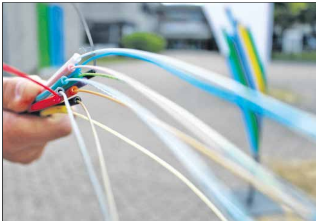
Der Glasfaserausbau schreitet voran.