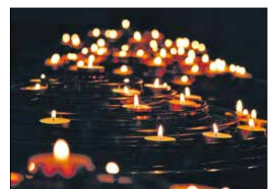
51 Kerzen – so viele Frauen sterben täglich an Brustkrebs in Deutschland.

men mit der Frauenseלבhilfe Krebs (FSH) Hofheim sowie den Evangelischen Frauen in Hessen und Nassau an der „Aktion Lucia“. Im Durchschnitt ist jede achte bis zehnte Frau im Verlauf ihres Lebens von Brustkrebs betroffen. Rund 192 Frauen erhalten täglich die Diagnose Brustkrebs – 69.900 Frauen und 720 Männer erkranken nach Schätzungen des Robert-Koch-Instituts Berlin jährlich in Deutschland. Durch intensive Forschung, verbesserte Therapien und Prävention sinkt das Sterberisiko seit Jahren, die Sterberate ist bei dieser Krebserkrankung jedoch nach wie vor hoch. Das vollständige Programm gibt es auf der Internetseite www.mtk.org/aktionlucia .