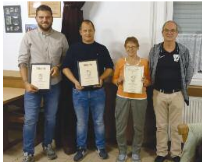
Oben: Ehrungen 2021