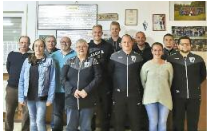
Oben: Der neue Vorstand

Fotos zur Jahreshauptversammlung - Text auf Seite 6.