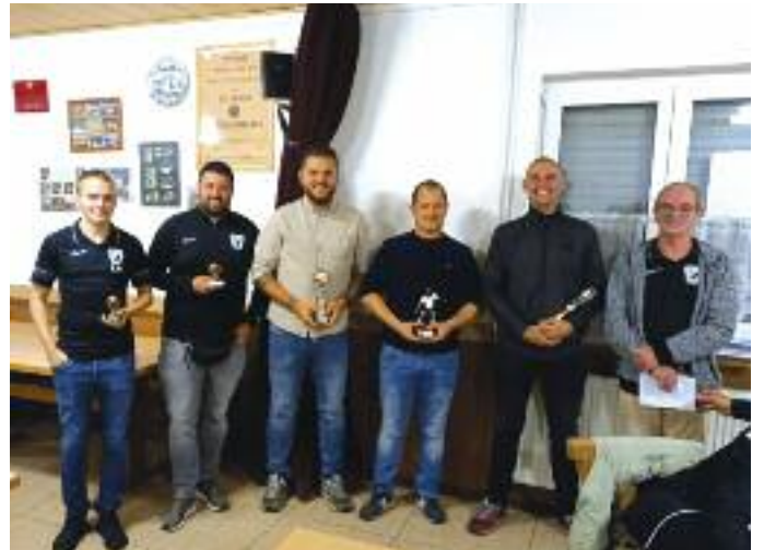
Oben: die geehrten Spieler