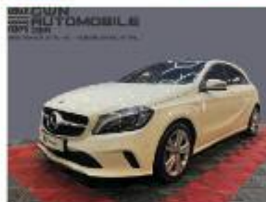
Mercedes-Benz A 180

Erstzulassung 10/2017 76.570 km 90 kW (122 PS) Benzin