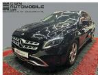
Mercedes-Benz GLA 200

Erstzulassung 12/2018 87.932 km 115 kW (156 PS) Benzin Automatik