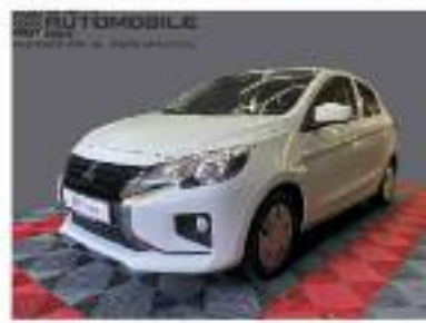
Mitsubishi Space Star

Erstzulassung 07/2020 15.231 km 52 kW (71 PS) Benzin