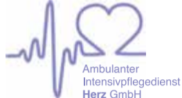
Ambulanter Intensivpflegedienst Herz GmbH

Für unsere neu errichtete Wohngemeinschaft zur ambulanten Versorgung von Intensivpatienten in Glashütten / Taunus suchen wir ab sofort