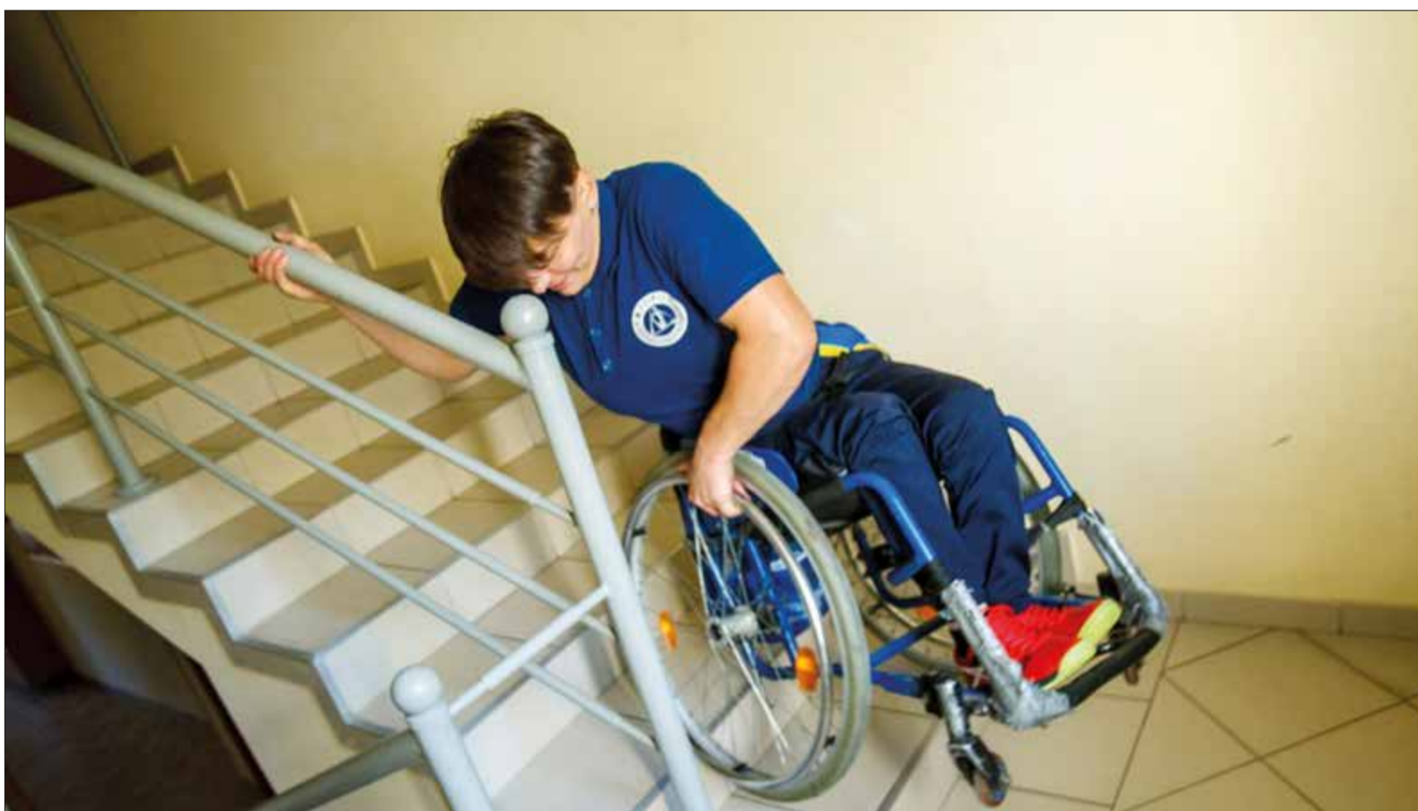
Behindertengerechter Wohnraum ist knapp und der Bedarf hoch. Das Foto soll helfen, das Problem zu veranschaulichen.

Königstein/Bad Soden (h mz) – In einem überschaubaren Rahmen könnte es ein Vorzeigeprojekt werden: Noch ist das Wohnhaus mitten in der Stadt eine Baustelle, im kommenden Jahr soll es Menschen mit und ohne Behinderungen zur Verfügung stehen. Ein privater Träger hat es erworben und setzt damit ein Zeichen für die soziale Inklusion, die erst dann verwirklicht ist, wenn jeder Mensch die Möglichkeit hat, am gesellschaftlichen Leben mitwirken und teilhaben zu können. In diesem Fall soll das Inklusionskonzept einer Wohngemeinschaft (WG) umgesetzt werden und in einer Zeit, in der Wohnraum und Ressourcen knapp sind, dürfte ein Projekt dieser Art willkommen sein. Aufgrund der hohen Nachfrage ist überall ein bedrückender Wettbewerb um bezahlbares Wohnen entstanden. Die Situation für Mieter und Mieterinnen mit Behinderung ist besonders prekär, denn ihr Zuhause muss nicht nur bezahlbar, sondern vielfach auch barrierefrei sein.