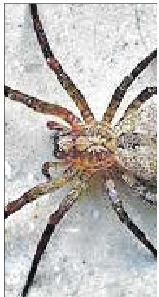
Die Nosferatu-Spinne ist in Deutschland angekommen.

Sie kann spürbar zubeißen, tut das aber nur sehr selten bei direkter Bedrohung. Als nächtliche Jägerin hält sie im Haus den Bestand an Fliegen und anderen Insekten klein.