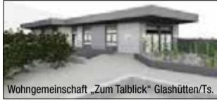
Wohngemeinschaft „Zum Talblick“ Glashütten/Ts.

Benzstraße 6, 65779 Kelkheim, info@wille-gastronomie.de Tel.: 0151 58 00 7922