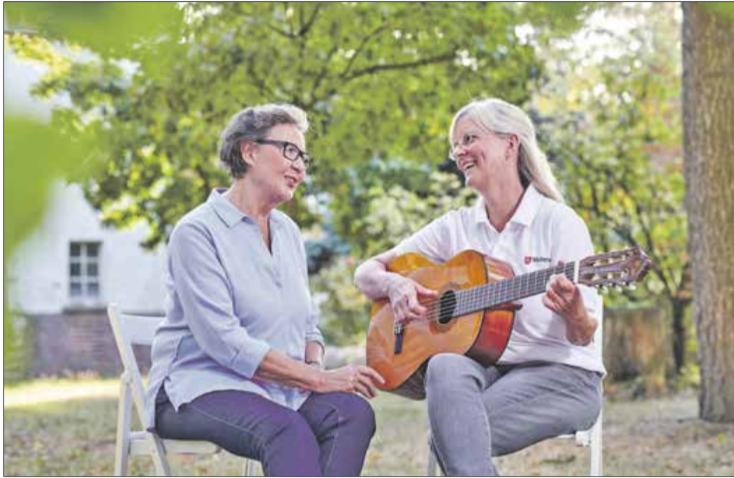
Der Malteser Besuchs- und Begleitungsdienst (BBD) besteht aus ehrenamtlich Helfenden, die Menschen besuchen, die entweder alleine zu Hause oder in einer Pflege- oder Senioreneinrichtung leben und wenig soziale Kontakte haben.