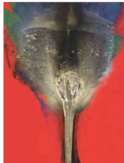
Otto Piene – „Kautschuk“