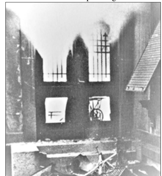
Gedenkveranstaltung anlässlich des Novemberpogroms 1938

um 19.30 Uhr im Foyer des Kulturzentrums Badehaus im Alten Kurpark begrüßen.