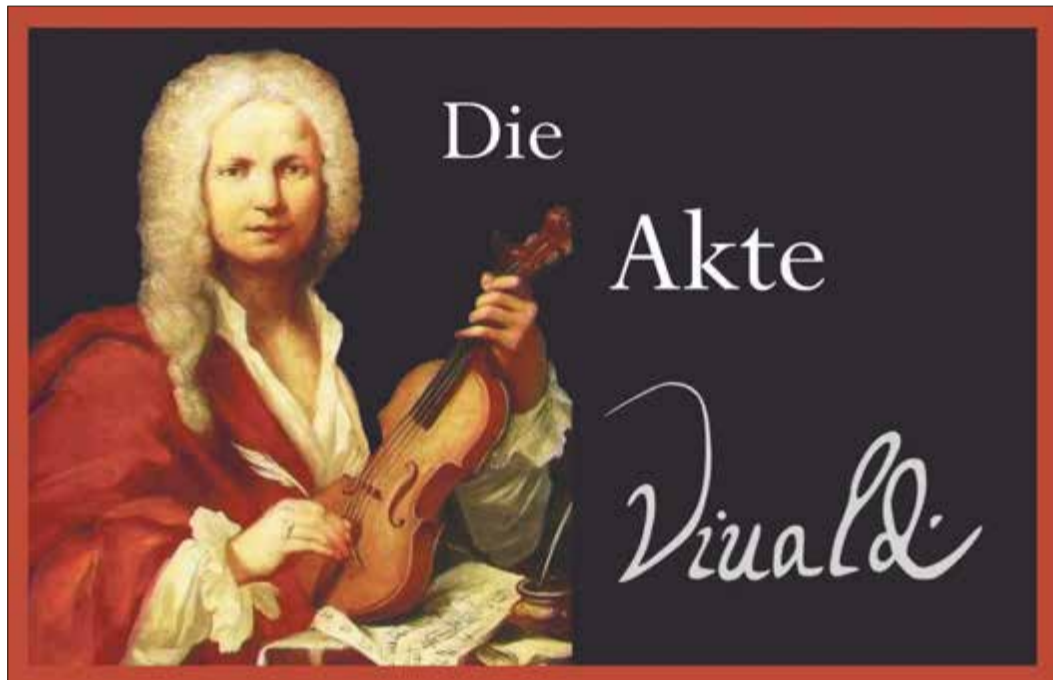
Die Akte Vivaldi