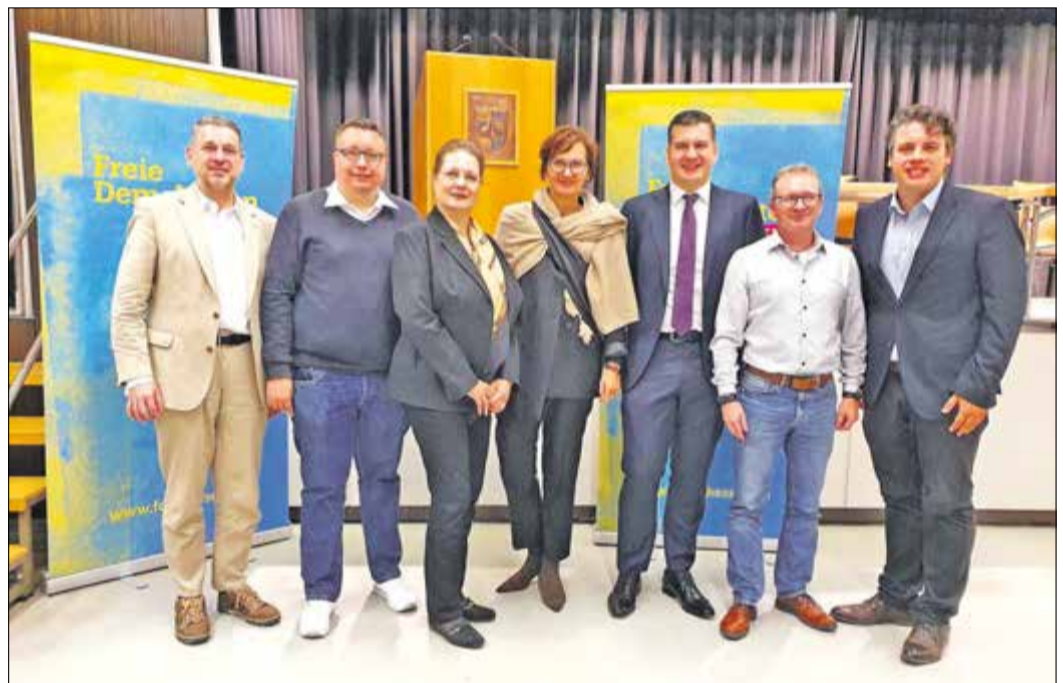
Die Kandidaten der Freien Demokraten für den Landtagswahlkampf 2023