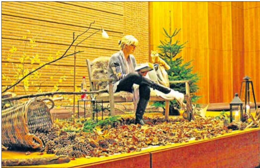
Nele Neuhaus bei einer Lesung im Landratsamt.