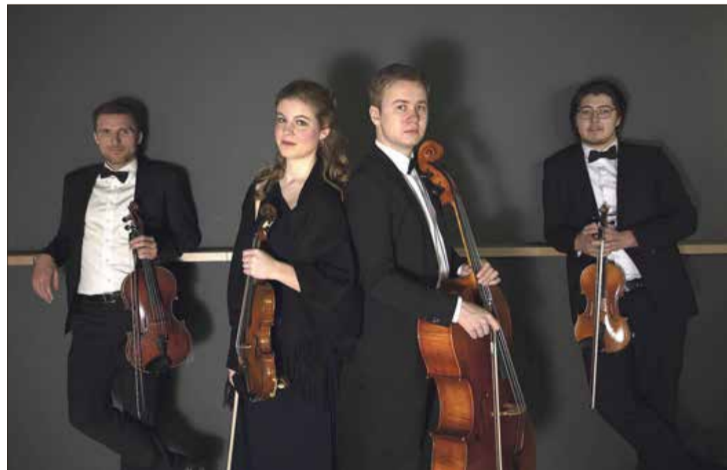
Das Alinea Quartett