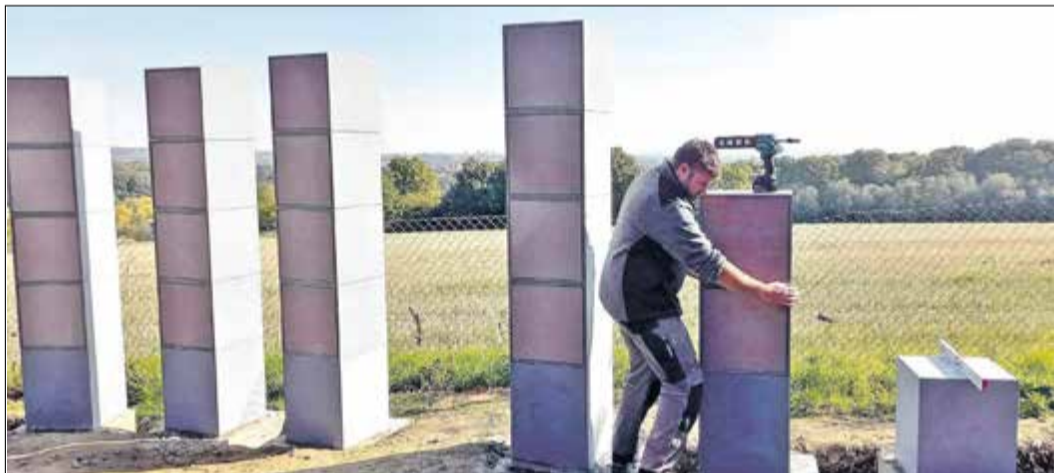
Mitte der Woche wurde die letzte der 20 Stelen aufgestellt.

Neuenhain (bs) – Die Nachfrage nach Urnenkammern auf dem Friedhof am Rother Weingartenweg ist ständig gestiegen. Eine Warteliste wurde längst angelegt. Darauf haben Magistrat und Stadtverwaltung reagiert und den Kauf und die Aufstellung von 20 Urnenstelen beauftragt. In diesen Tagen wurden die Stelen errichtet. Bereits Mitte August hatten die Arbeiten auf dem Friedhof begonnen. So wurden Fundamentgräben ausgehoben und betoniert. Anschließend mussten sie vier Wochen aushärten. In den vergangenen Tagen nun wurden die 20 Stelen aus bayerischem Granit mit je vier Kammern an der süd-östlichen Grundstücksgrenze des Fried-