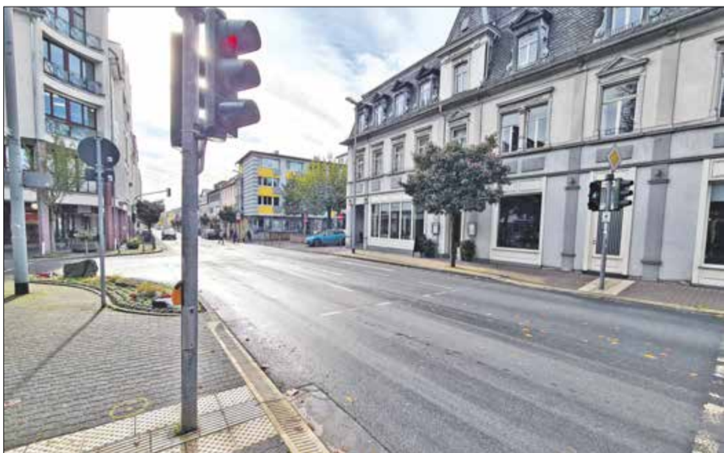
Die Ampelanlage an der Kreuzung Königsteiner Straße/Kronberger Straße muss erneuert werden.

Bad Soden (bs) – Die Ampelanlage an der Kreuzung Kronberger Straße/Königsteiner Straße muss erneuert werden. Die Arbeiten dazu beginnen am Freitag 28. Oktober, und dauern voraussichtlich bis 18. Dezember 2022. Die veraltete Anlage wird auf ein modernes LED-System mit Kamerasteuerung umgerüstet. Dadurch werden die Ampelphasen wie schon an der Kreuzung Königsteiner Straße/Hauptstraße in Neuenhain bedarfsgerecht an den Verkehrsfluss angepasst. Die neue Anlage