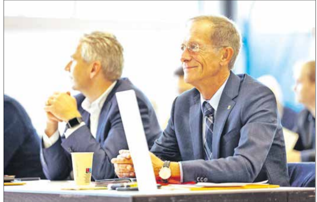
Rückenwind für die Landtagswahl 2023 für Landrat Michael Cyriax (li.) und Staatsminister Axel Wintermeyer.

Damit werben wir 2023 wieder um das Vertrauen der Bürgerinnen und Bürger im MTK.“