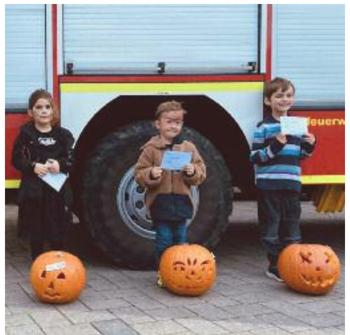
Foto unten: Drei Schnitzer erhielten für ihre schönen Kürbisse Preise

Neue Mitglieder sind jederzeit willkommen: die Kinderfeuerwehr übt 14-tägig samstags von 10 bis 11 Uhr und die Jugendfeuerwehr jeden Donnerstag von 18 bis 20 Uhr.