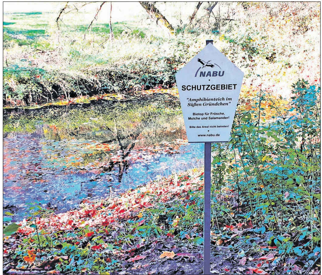
„Amphibienteiche – Leben im und am Teich“, so lautet das Projektmotto des Nabu Main-Taunus, unter dem sich die Naturschützer für einen Projektgewinn bei der Umweltlotterie „Genau“ angemeldet hatten.