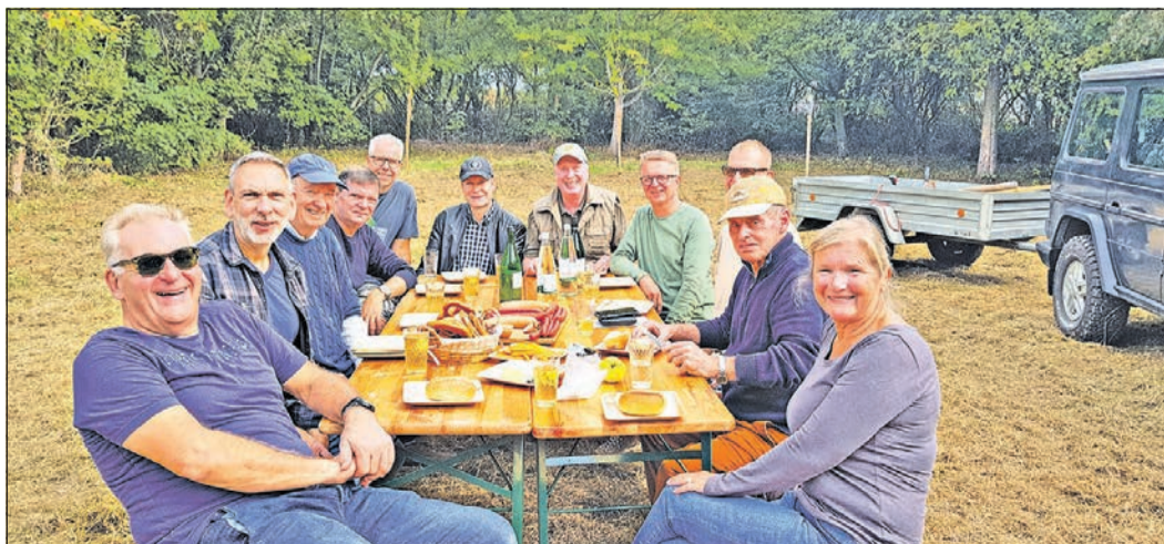
Die Lions-Club-Mitglieder nach getaner Feldgehölzarbeit.