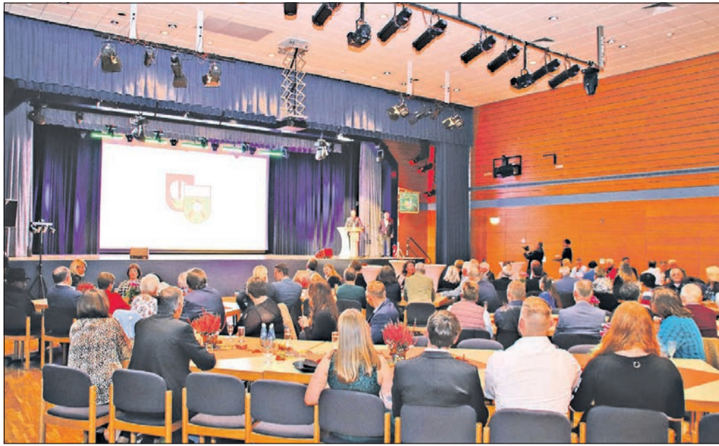
Die Schützengesellschaft Eschborn feiert endlich wieder ihr Herbstfest im Niederhöchstädter Bürgerzentrum.