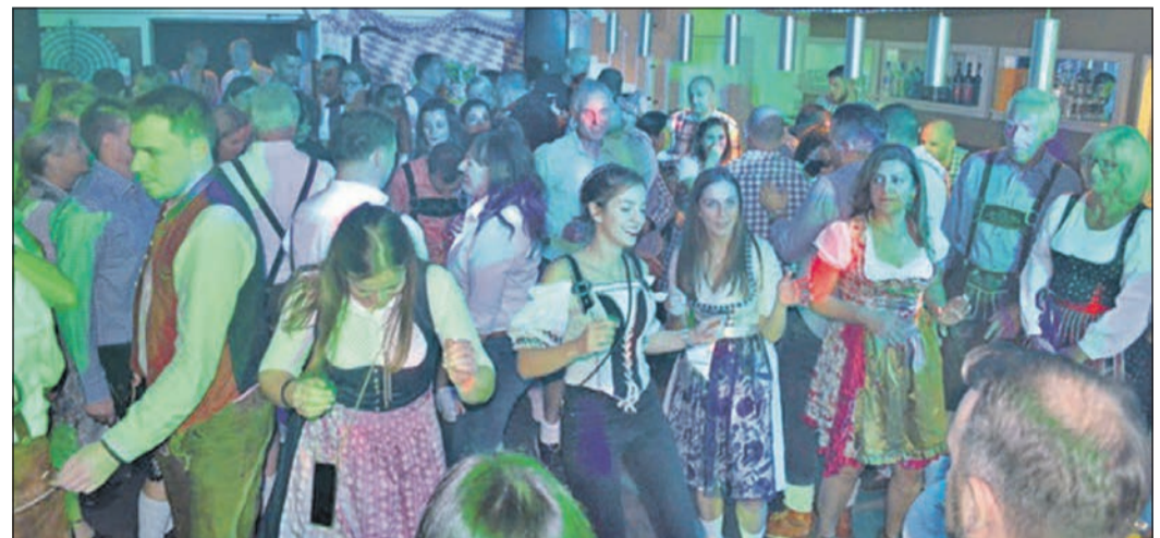
Beim Oktoberfest des Vereins „tennis westerbach eschborn“ herrscht auch im November beste Stimmung.

Blumenschale. Anschließend eröffnete er das zünftige, leckere Büfett. Frisch gegrillte Haxe und Hendl gab es frisch vom extra engagierten Grillwagen. Passend dazu wurde original Wiesn-Bier in Maßkrügen gezapft. Zum Essen wurde zünftige Oktoberfest-Musik gespielt. Anschließend drehte DJ Peter den Party-Mix hoch, und die Lichtorgeln sowie der eingespritzte Nebel tauchten die „Hütte“ in eine bezaubernde Atmosphäre. Im Nu war die Tanzfläche gefüllt. Zwischendurch wurde das Büfett noch mit Apfelstrudel und exquisiten italienischen Nachtischhäppchen angereichert. Wie üblich beim twe wurde ausgelassen bis tief in die Nacht getanzt und gefeiert.