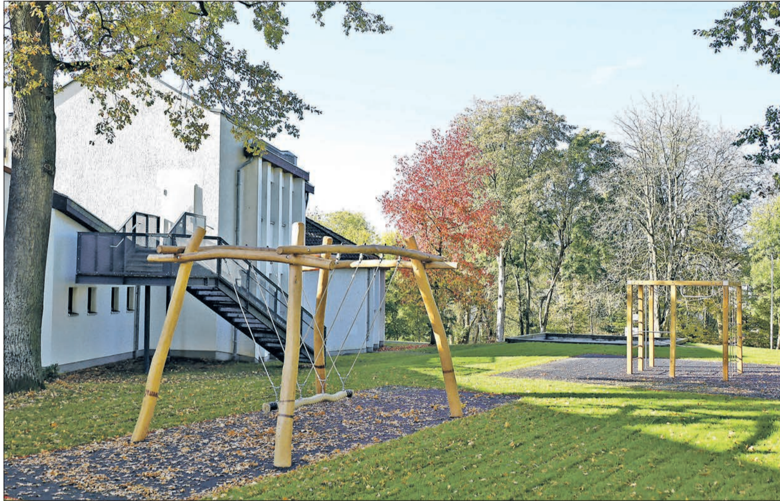
Ab sofort können Kinder hier wieder toben: Der neu gestaltete Spielplatz an der Geschwister-Scholl-Schule.