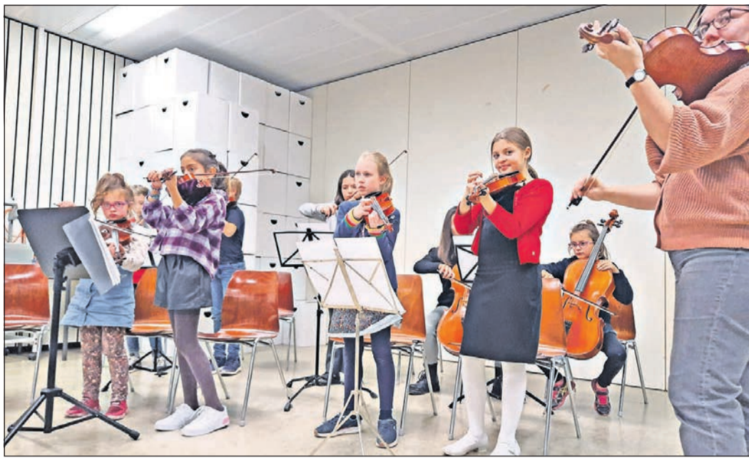
Auch die Jüngsten spielen beim Streichertag der Musikschule Taunus.