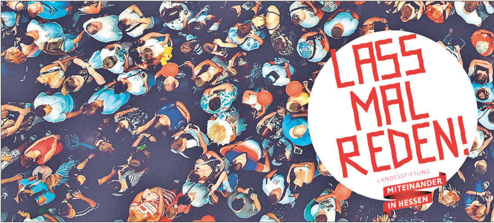
Das aktuelle Plakat zur Aktion.