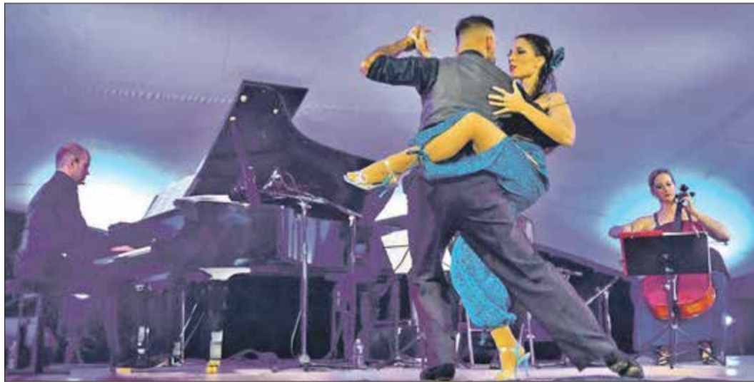
Einklang von Musik und Tanz beim Tango