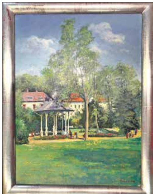
Harald Sommer, „Quellenpark mit Sodenia-Tempel“ Foto: Stadt Bad Soden

Jetzt hat er sich aus Platzgründen allerdings von einigen Bildern trennen müssen. Bei den geschenkten Werken handelt es sich um Ölgemälde, die wohl allesamt Landschaften aus der Region zeigen, wie eine Ansicht des Quellenparks mit dem Sodenia-Tempel aus dem Jahre 1997 oder ein Blick auf Kronberg mit Burg aus dem Jahre 2000. Ein vierteiliger Zyklus mit den Jahreszeiten lässt nur vermuten, dass es sich um Orte aus der Umgebung von Bad Soden handelt. Der Künstler Harald Sommer wurde am 16. April 1930 in Coburg geboren. Bereits 1944 begann er eine Ausbildung als Porzellanmaler, die er 1947 erfolgreich abschließen konnte. Inzwischen Meister des Glas- und Porzellanmalerhandwerks war er unter anderem Leiter der Dekor-Abteilung der Wächtersbacher Keramik und Technischer Direktor der Höchster Porzellanmanufaktur. 1976 eröffnete er ein eigenes Atelier in Bad Soden am Taunus. Laut eigenen Aussagen malte er bis zu 80 Werke im Jahr. „Die Stadt Bad Soden ist sehr dankbar über