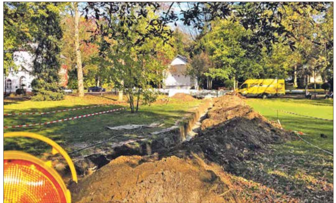
Der Graben führt mitten durch die „Vogelwiese“.