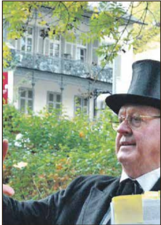
Im Hintergrund das „Graue Haus“