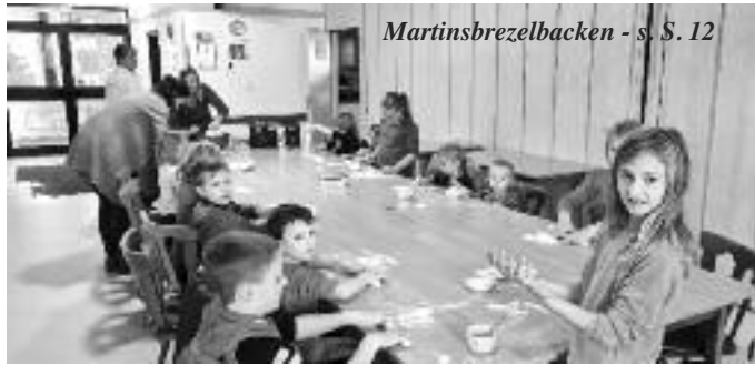
Martinsbrezelbacken - s. S. 12