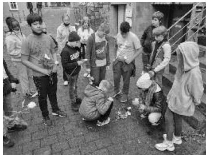
Auf dem Foto: Rosen für die von den Nationalsozialisten vertriebenen und ermordeten Bürgerinnen und Bürger Salmünsters