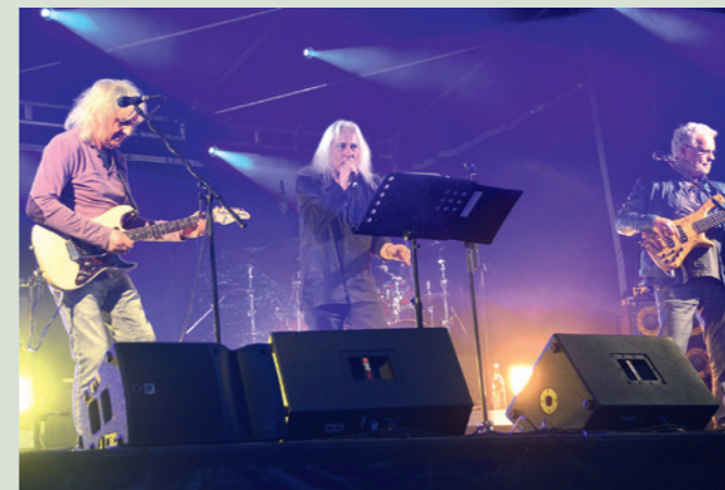
Die Oldies, eine Institution in Wetzlar, spielen auf der Lahninsel.

Durch den Vergnügungspark auf der Lahninsel und den nicht zur Verfügung stehenden Parkmöglichkeiten auf dem Haarplatz, stehen die wichtigsten altstadtrelevanten Parkplätze nicht zur Verfügung. Vom Parkplatz Bachweide ist nur eine Brücke zu überqueren, um sich am Stadion vorbei schon in der Altstadt zu befinden. Es wird gebeten, die freien Parkplätze in der Avignon-Anlage, Steighausplatz, Rathaus-Parkplatz, Hauser Gasse, Zwack'schen Lahninsel, Stadthalle und vor allem die Bachweide mit Zufahrt über Uferstraße zu nutzen oder einfach mit dem ÖPNV anzureisen. Die Stadtpolizei wird beim Gallusmarkt den Parkraum in der Kernstadt kontrollieren und Verstöße ahnden. Besucher werden gebeten, bei ihrem Besuch in Wetzlar zum Gallusmarkt 2022 die dann geltenden Coronaregeln zu beachten: „Bleiben Sie gesund und Wetzlar gewogen“!