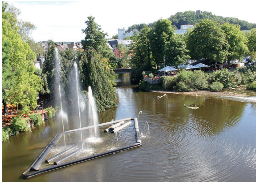
Hier laufen viertelstündlich 21 Pumpen und 42 Strahler zur Höchstform auf.

Der 18. Oktober 2008 war für die Goethe- und Optikstadt vielleicht kein historischer, zumindest aber ein ganz besonderer Tag. Seinerzeit feierten die Wetzlarer die Einweihung des spektakulärsten Projekts im Rahmen des Wetzlarer Optikparcours. Zum Startschuss wurde jedoch kein Band zerschritten, kein „Buzzer“ gedrückt oder eine Flasche Sekt an einem Schiffsbug zertrümmert. Letzterer Akt kam dem Anschalten allerdings schon ziemlich nahe, denn hier