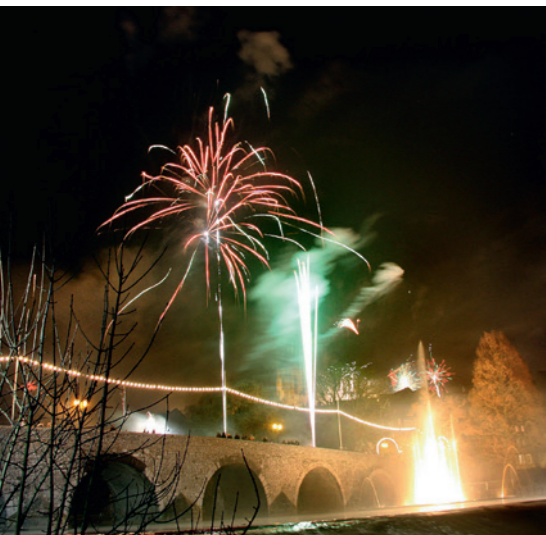
Zum Jahreswechsel 2008/09 erlebte die illuminierte Wasserorgel ihr erstes Silvesterfeuerwerk.

Übrigens: Nach jetzigem Stand soll die Wasserorgel während der Wintermonate nicht ausgestellt werden, insoweit Frost- oder Sturmgefahr nicht dagegen sprechen. Einem durchgängigen und vor allem langjährigen Musik- und Wasserspielvergnügen steht damit hoffentlich nichts im Wege.