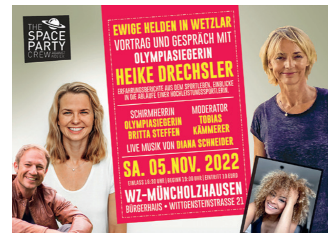
Mit Heike Drechsler kommt erfolgreiche Sportprominenz nach Wetzlar.

Für Samstag, 5. November, lädt die Space Party Crew zur Veranstaltung „Ewige Helden in Wetzlar“ ab 19 Uhr (Einlass ab 18.30 Uhr) in das Bürgerhaus in Münchholzhausen, Wittgensteinstraße 21, ein. Zu Gast ist mit einem Vortrag und Gespräch Weitsprung-Olympiasiegerin Heike Drechsler.