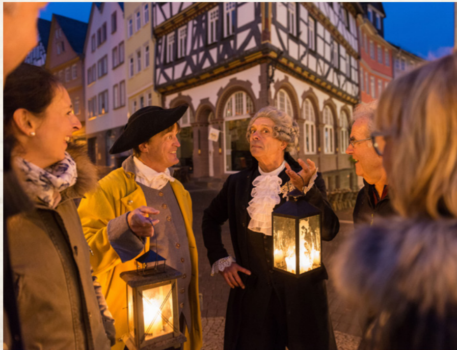
Die Tourist-Information lässt sich bei den Stadtführungen einiges einfallen, um das besondere Flair zu garantieren.

Das Aussehen von Städten und Dörfern befindet sich in einem stetigen Wandel. Selbst in relativ kurzen Zeiträumen kann sich das Gesicht einer Stadt ändern – und manches bleibt wie es ist. Wie Wetzlar vor fünfzig Jahren aussah und was die Stadt damals bewegte, erfahren Interessierte mit zahlreichen Bildern bei einem anderthalbstündigen Rundgang durch die Altstadt. Treffpunkt ist am Samstag, den 22. Oktober 2022 um 15 Uhr am Brunnen am Domplatz. (Preis: Erwachsene 5,00 Euro und ermäßigt 2,50 Euro, Anmeldung erforderlich). Rätselhafte und außergewöhnliche Aspekte der mittelalterlichen Stadtgeschichte