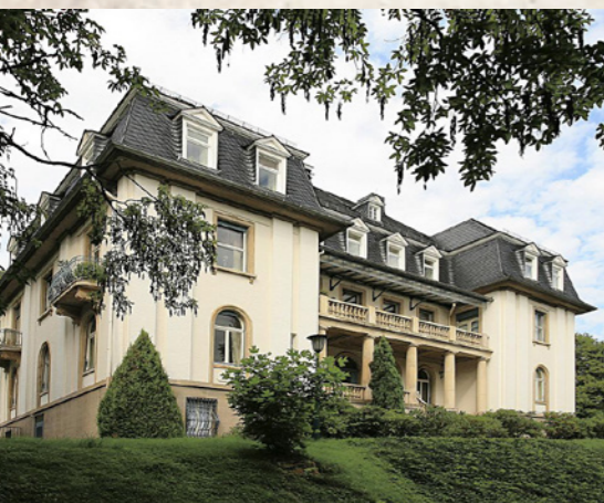
Einblicke in das prunkvolle Anwesen von Haus Friedwart werden am 15. und 16. Oktober gewährt.

Programmänderungen vorbehalten. Eine aktuelle Übersicht findet sich online unter www.wetzlar-tourismus.de .