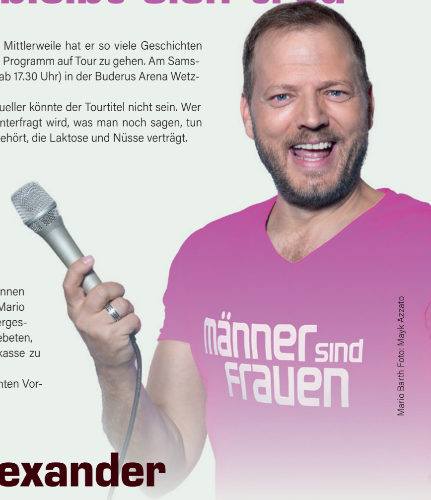
Mario Barth

Das Stadtmagazin verlost zum Abschied fünf CDs der beiden. Wer gewinnen will, schickt bis 15. Oktober eine E-Mail mit dem Stichwort „Marshall & Alexander“ an stadtmagazin-wetzlar@vrm.de (Adresse nicht vergessen!). Die Gewinner bekommen die CDs vom Veranstalter zugeschickt. Viel Glück! Tickets gibt es ab 45,90 Euro unter anderem beim Reisebüro Gimmler, Bannstraße 1, Tel. 06441-9010-0, Reisebüro Lahnbrücke, Langgasse 6, Telefon 06441-2091540. www.reservix.de , www.eventim.de und an der Abendkasse. Kontakt: www.stadthallewetzlar.de .