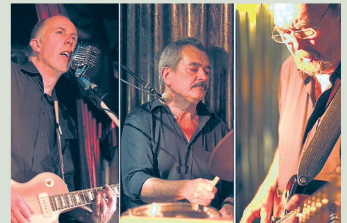
The Booster beschallen den Eisenmarkt.