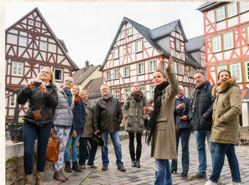
Bei den informativen Spaziergängen durch die Stadt darf auch das Fachwerkkambiente des Kornmarktes nicht fehlen.

Karten sind vorab in der Tourist-Information, Domplatz 8, Wetzlar, Telefon 06441 99-7755, E-Mail: tourist-info@wetzlar.de sowie bei vielen bekannten Vorverkaufsstellen und online im Ticketshop unter www.wetzlar-tourismus.de erhältlich.