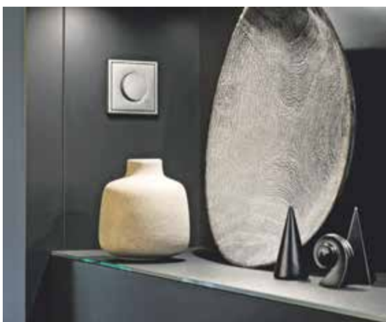
Die Raumthermostate sind passend zur übrigen Elektroinstallation in unterschiedlichen JUNG Schalterprogrammen erhältlich.

(epr) Um Energie und Heizkosten zu sparen, muss man im Winter nicht frieren. Oft reichen schon relativ einfache Lösungen, um den Heizenergieverbrauch in Haus oder Wohnung effek-