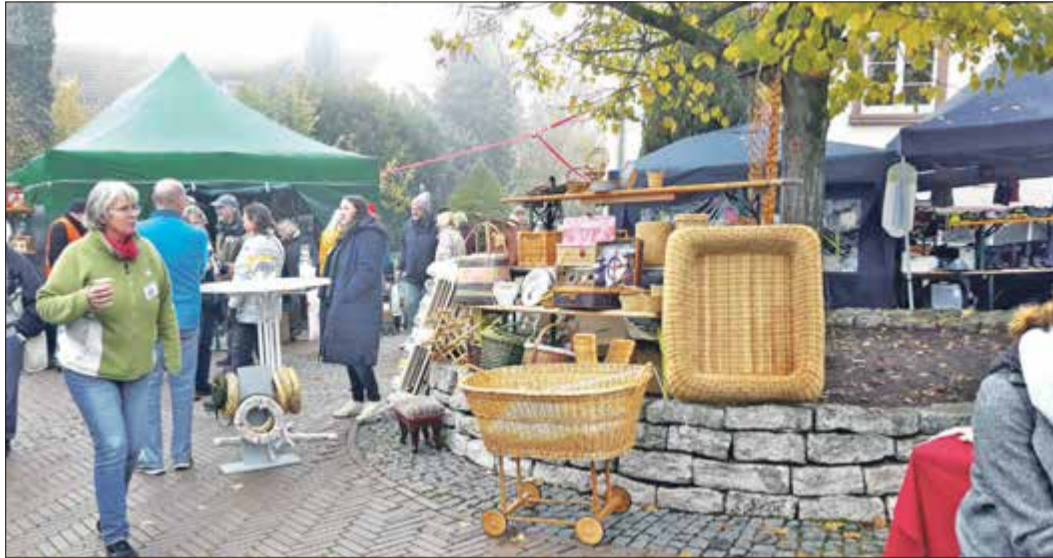
Reges Treiben im typischen Novemberwetter...