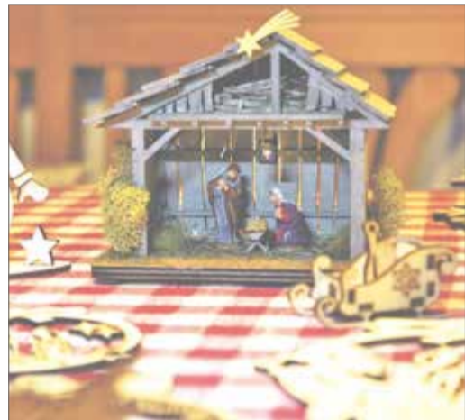
Die liebevoll gestalteten „Miniatur-Krippen“ – sogar mit sparsamer LED-Beleuchtung

Eingriff ist für arme Menschen unbezahlbar in manchen Ländern. Seit 1966 hat die CBM schon über 14 Millionen Kindern und Erwachsenen das Sehen geschenkt – unbezahlbar! Allein im Jahr 2018 verhalfen Spenderinnen und Spender zu 605.443 Grauen-Star-OPs . Und das ist nur ein Puzzleteil der Hilfe.