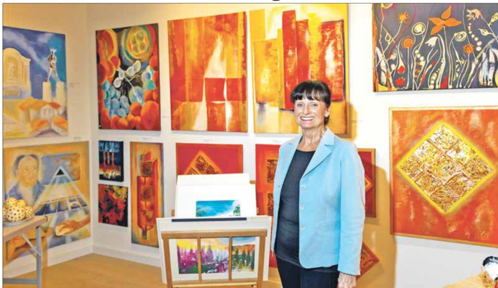
Bereits beim Eintreten lädt das mit viel Liebe und bunten Kunstwerken gestaltete Atelier zum Verweilen ein.