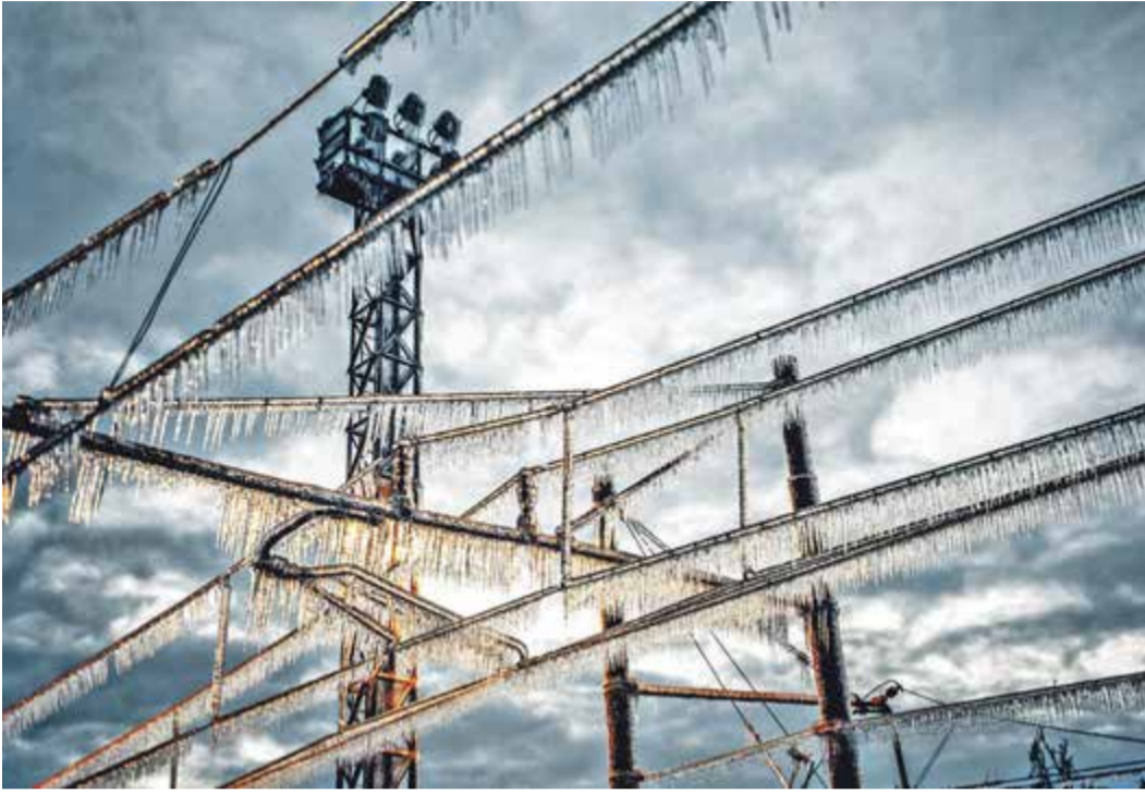
Vereiste oder gebrochene Strommasten können zu einem zeitweiligen Stromausfall führen.