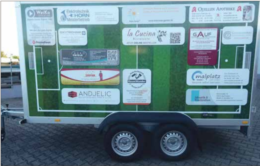
Die Soccer Arena wurde inklusive einem Anhänger geliefert.